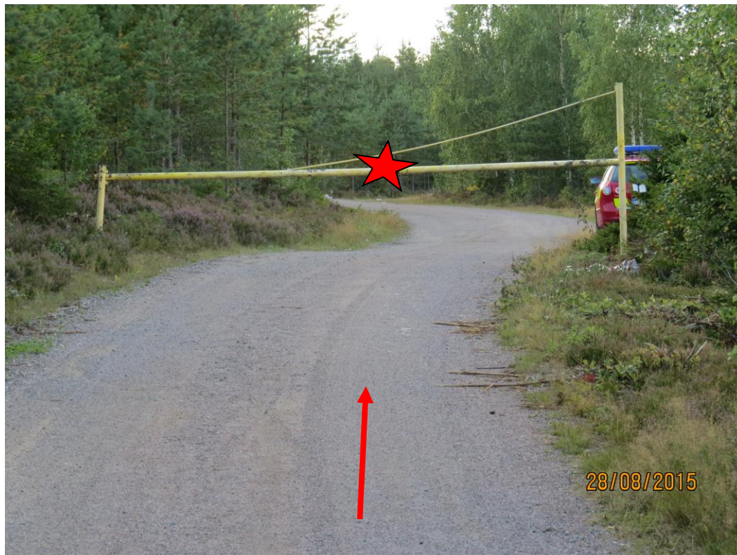
Bild 1: Den röda stjärnan anger olycksplatsen och pilen visar mc:ns färdriktning.

Vägen är en mindre skogsväg som är ca 4 meter bred med beläggning av grus, sand och småsten. Sikten fram till vägbommen är vid normala fall mycket god, den syns på över 100 meters håll (se bild 2)