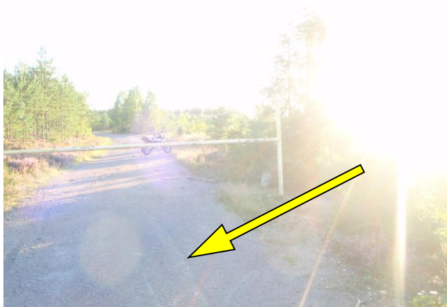
Bild 3: Solens läge en stund efter olyckan som visar på Att föraren kan varit bländad. Pilen visar de bromsspår som fanns på platsen