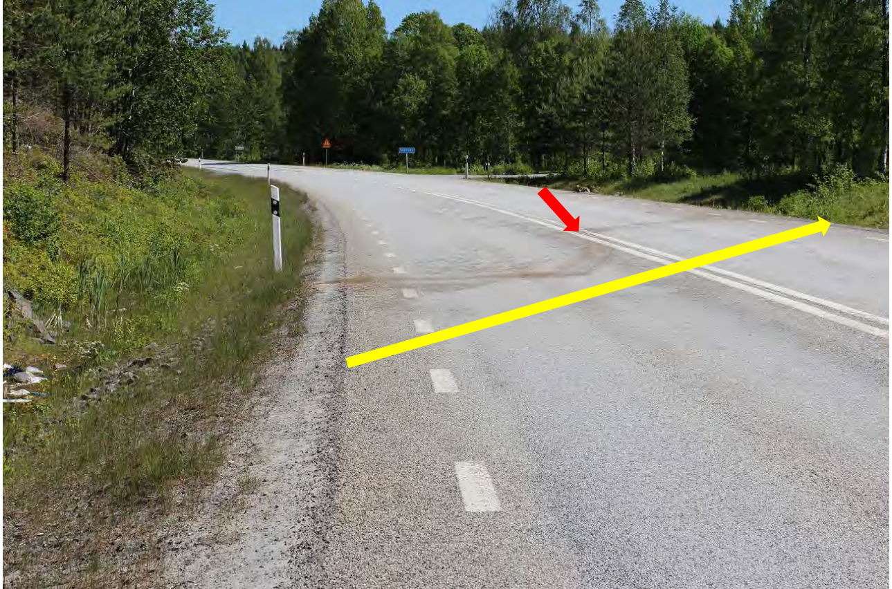
Bild 5. Kollisionsplats, röd pil. Vägbanan är på platsen 9,3 meter bred, gul pil.