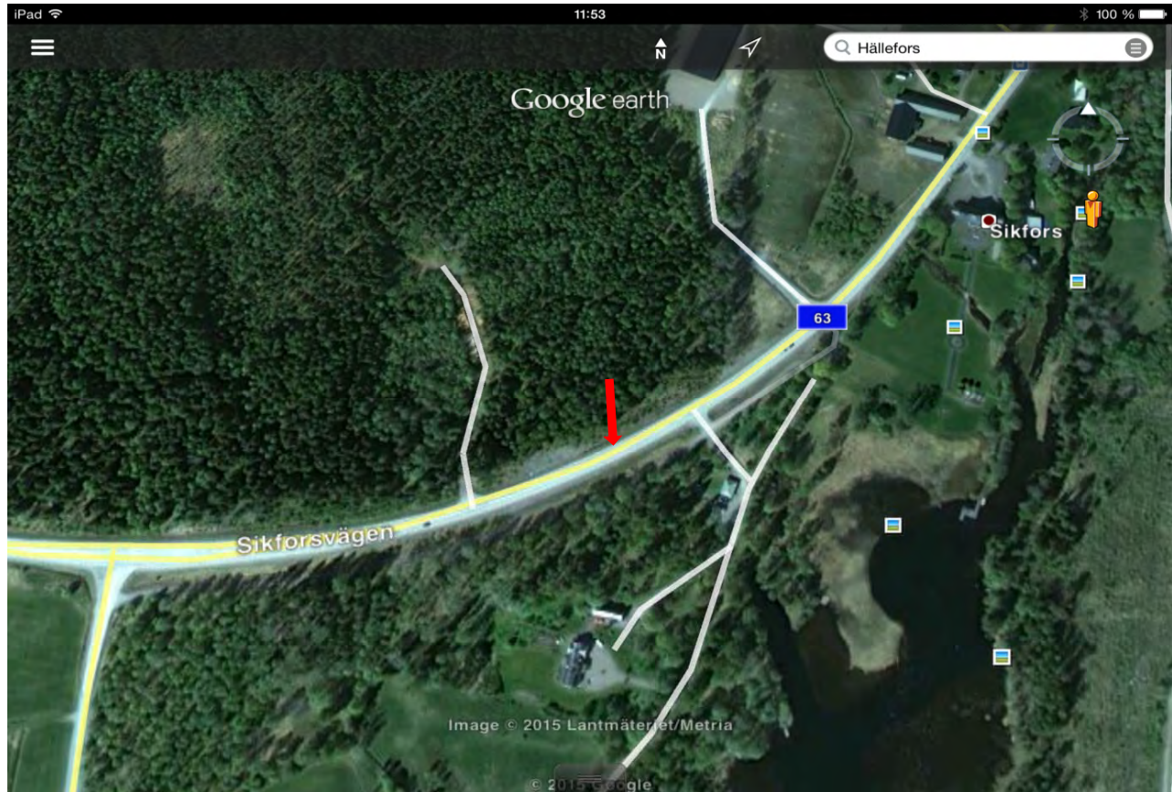
Bild 2. Vid den röda pilen inträffar olyckan.