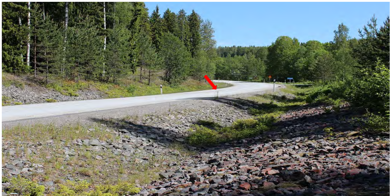
Bild 3. Kollisionsplatsen.