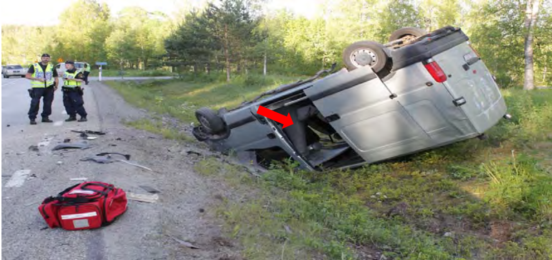
Bild 4. Servicebussen voltade och blev liggande på taket, chauffören och passageraren kröp ut genom skjutdörrarna på denna sida.