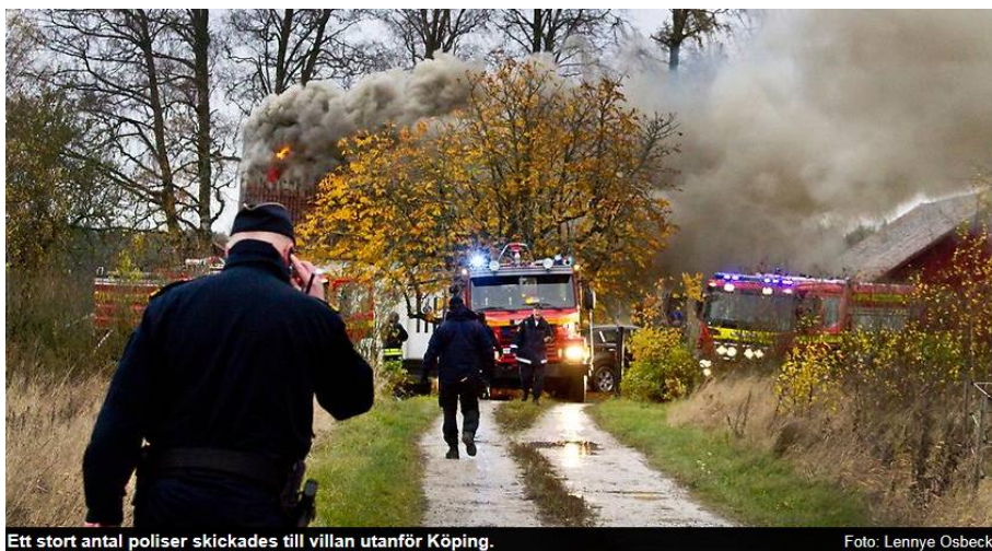
Ett stort antal poliser skickades till villan utanför Köping.