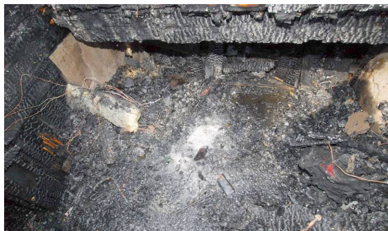
Bild 2. Vitaktig aska som påträffades under golvluckan i krypgrunden.

Det primära brandområdet är lokaliserat till krypgrunden i mittendelen av huset. Kvarvarande golvbjälkar från ovanliggande sovrum samt brädor till gång i krypgrunden är brända på insidan. Detta indikerar att branden varit koncentrerad till detta utrymme. Vidare påträffades en vitaktig aska samt en del av en trolig golvlucka på marken (Bild 2).