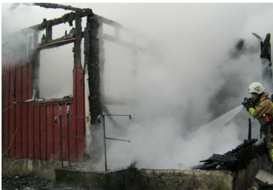
Bild 3. Yttre släckning av huset

Efter ett tag hade den yttre släckningen börjat få resultat (Bild 3) och det gick att gå in i huset med rökdykare. Ganska snart fann rökdykarna en person i sängen, det var den saknade kvinnan som var avliden. Hon hade omkommit innan rökdykarna fann henne.