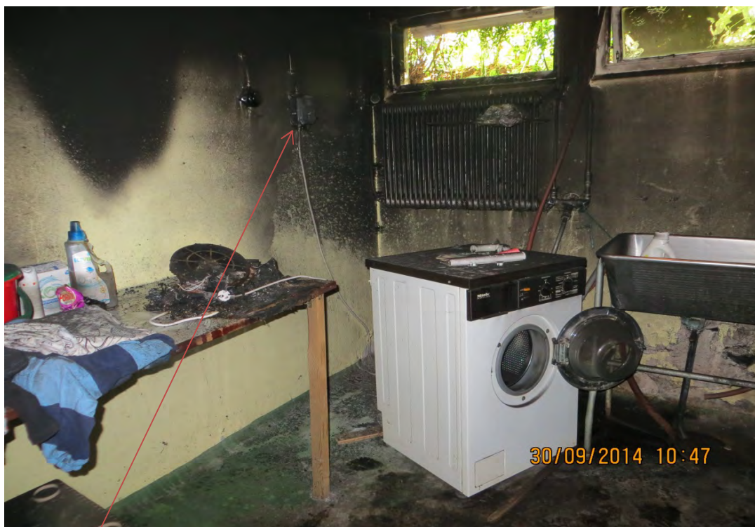
Kontakt där strömmen bröts till tvättmaskin av säkerhetsskäl vid släckning.