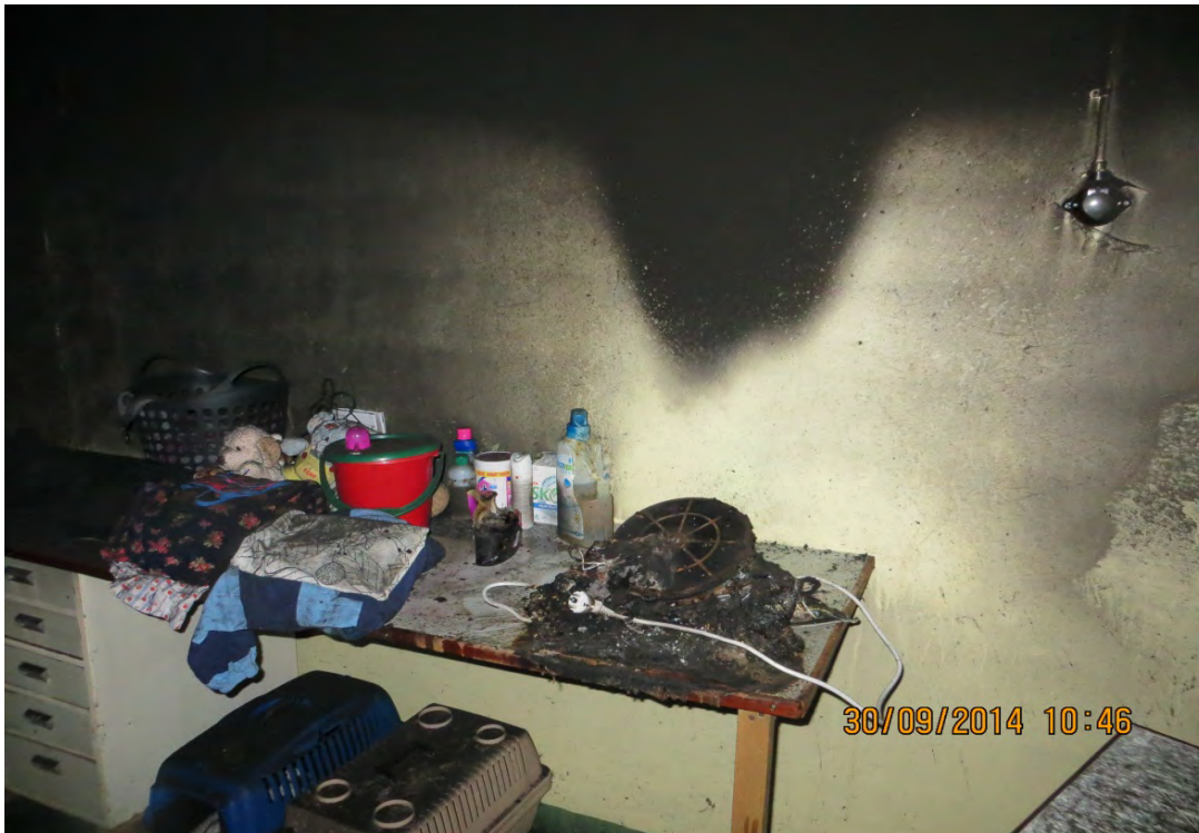
Brandbilden visar tydligt på brandstart i luftavfuktare.