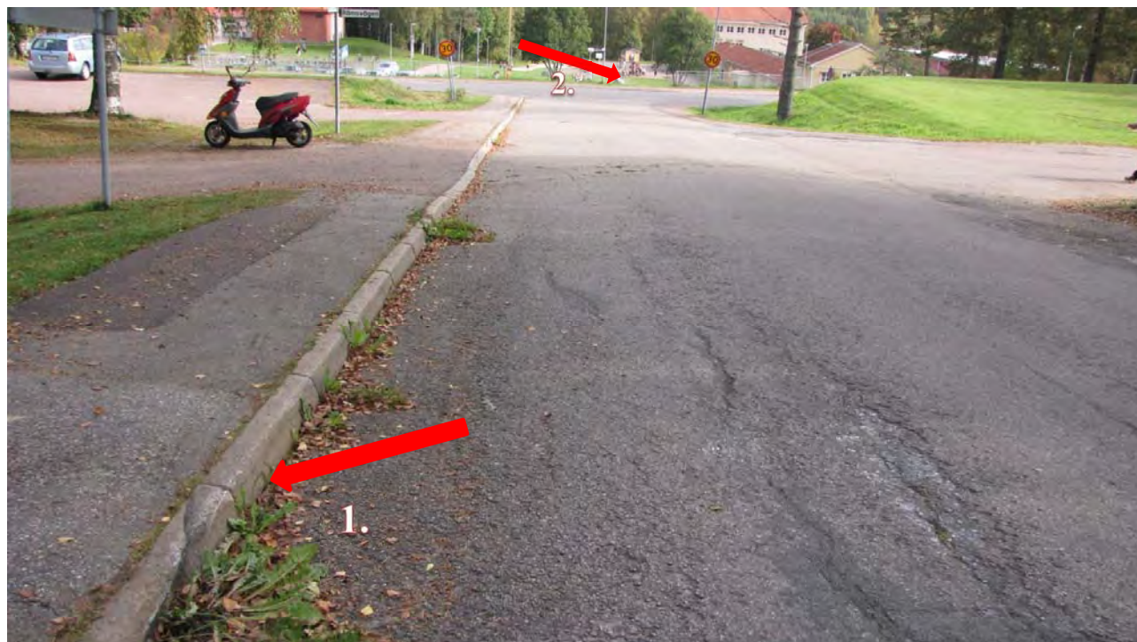
Pil 1. Visar vart bilen går upp på trottoaren, där den sedan åker ända ner till Skolgatan. Pil 2. Visar vart bilen kör igenom staketet och flyger ner med bilen mot skolbyggnaden.