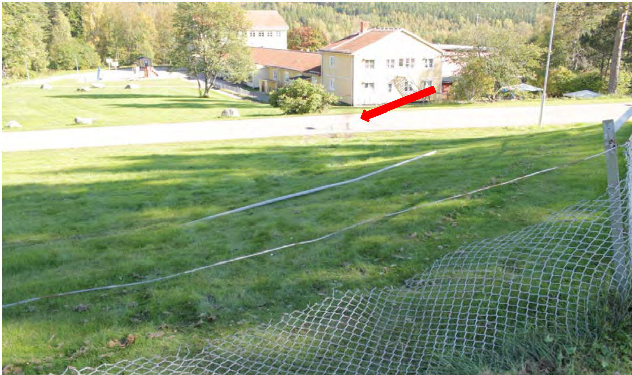
Första nedslagsplatsen med bilen.