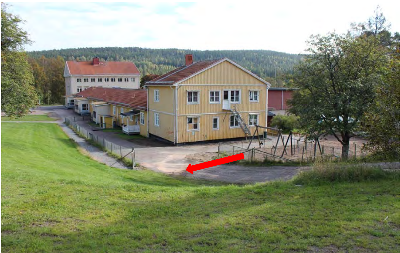
Det andra hoppet bilen gör är 15 meter långt, när bilen slår i underredet här så vänder bilen upp sig på sidan och flyger in med taket före i väggen.