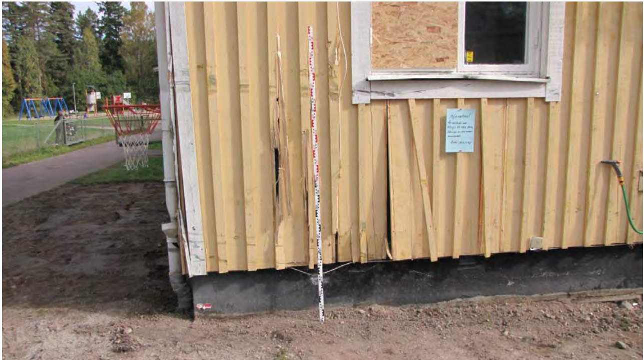
Bilen har varit som högst upp på väggen 1,93 cm. Då det ej var några skrapmärken på marken så tyder allt på att bilen har kastats i luften och in i väggen.