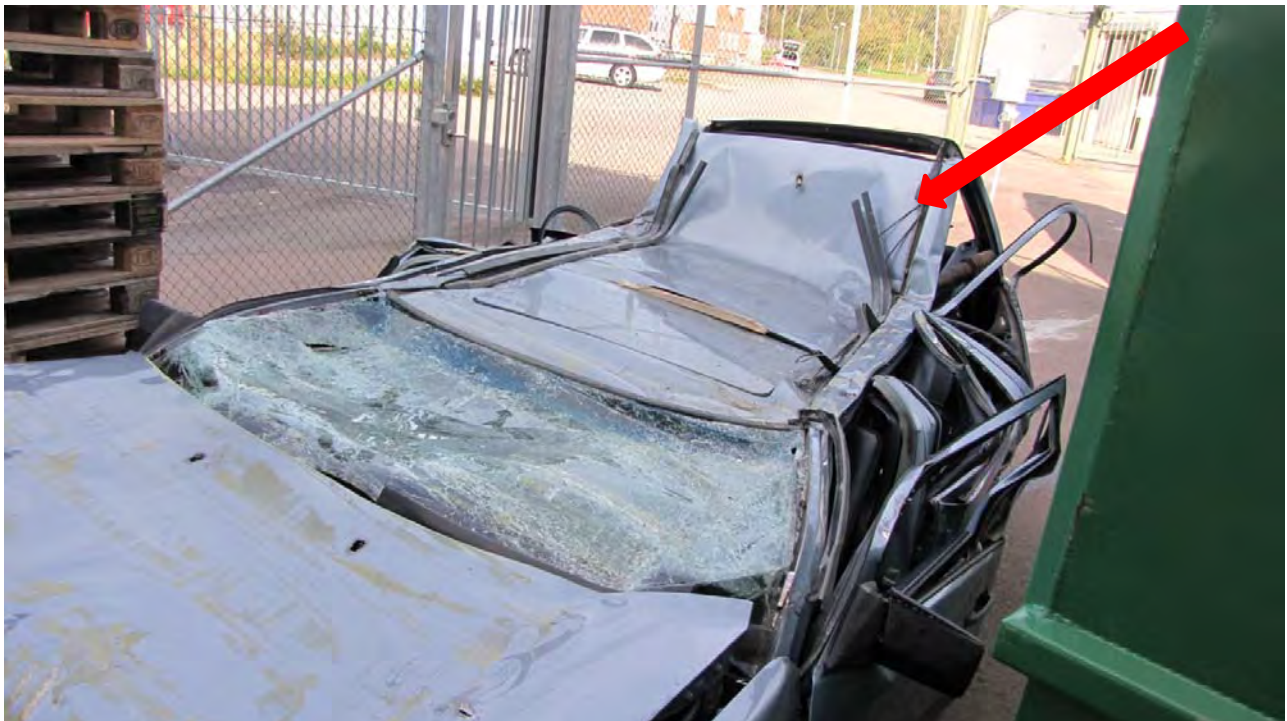
Bild tagen vid Polisens garage i Karlstad. det tydliga vecket på taket visar vart husväggen slutade.