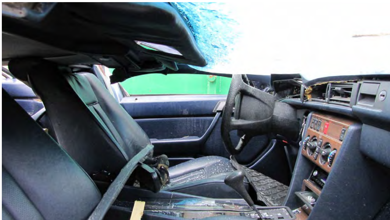
Ratten är rejält intryckt, troligen orsakat av kroppsvåldet mot ratten i det första nedslaget efter att bilen flög från Skolgatan och ner mot den asfalterade vägen ner mot skolan.