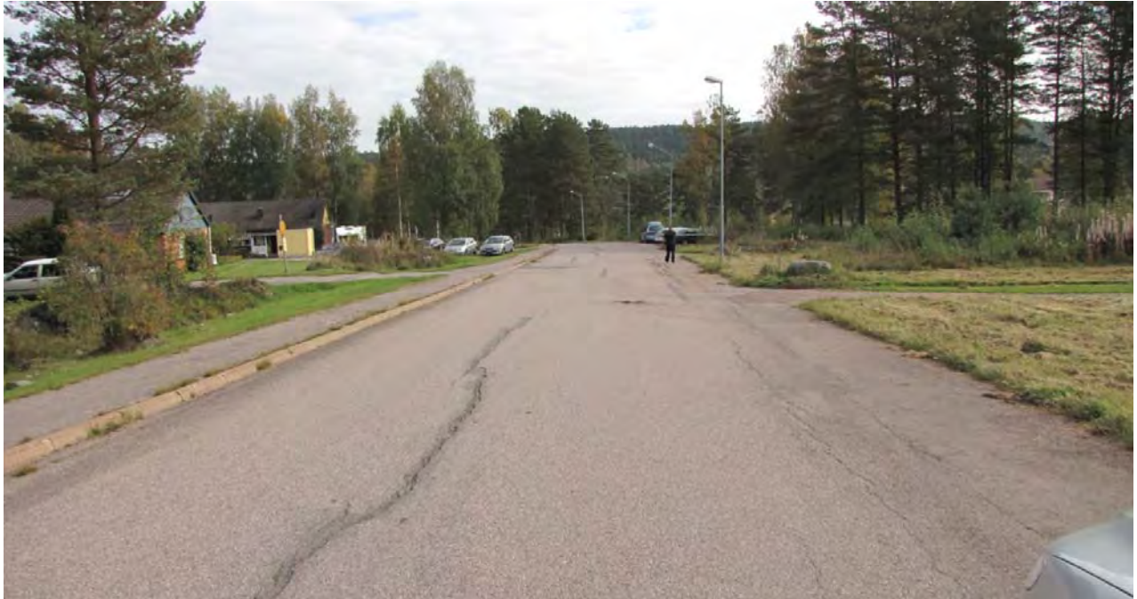
Här startar bilfärden utför Tegnervägen.

Samverkan mellan ambulans, polis och räddningstjänst fungerade mycket bra. Respektive organisation vet vad man skall göra och samarbetade på ett effektivt sätt. Efter en sådan här olycka med denna utgång så samlas all räddningspersonal för att gå igenom insatsen samt för att se hur räddningspersonalen fysiskt mår.