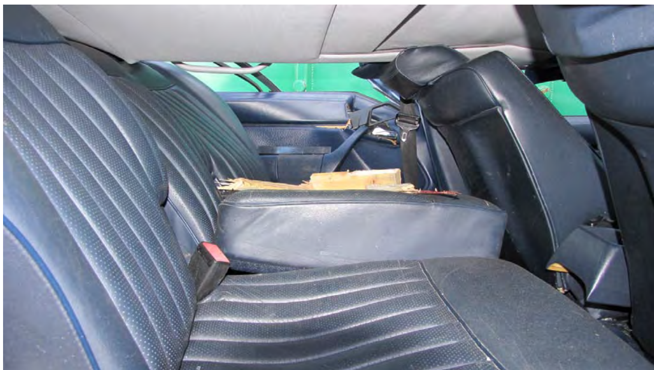
Taket är nertryckt mot nackkuddarna både vid baksätet och vid framsätena.