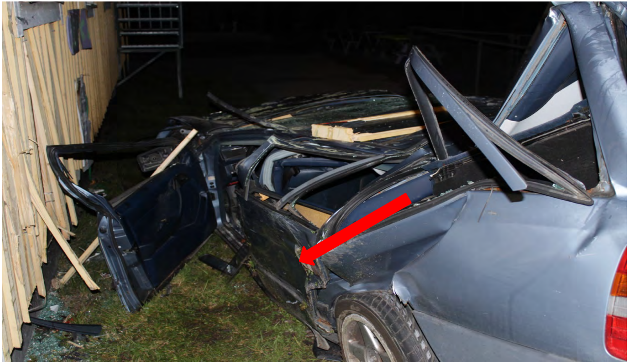
Pilen visar vart den svårt skadade personen ligger på gräsmattan när Räddningstjänsten anländer.