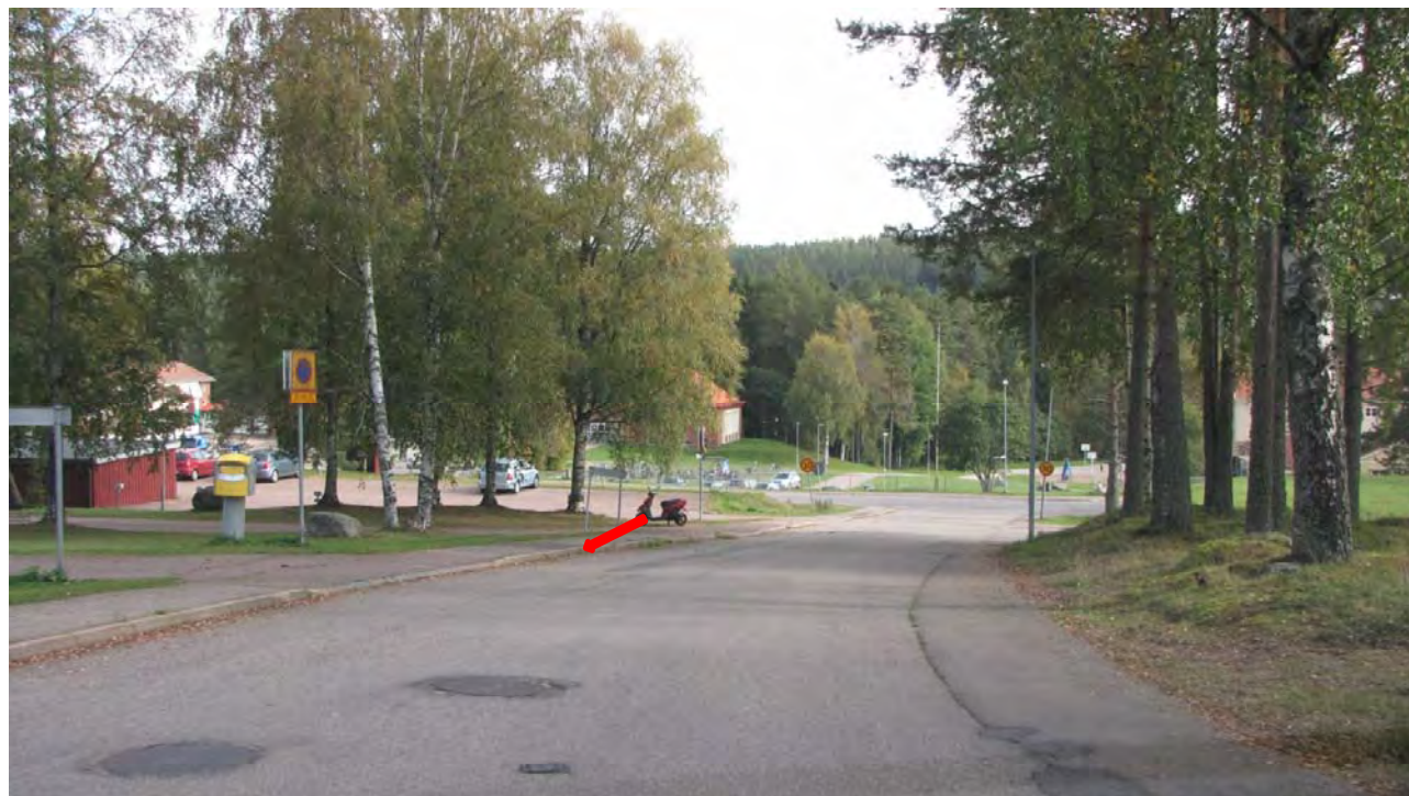
Vid pilens plats går bilen upp på trottoaren och fortsätter på den ner till Skolgatan.