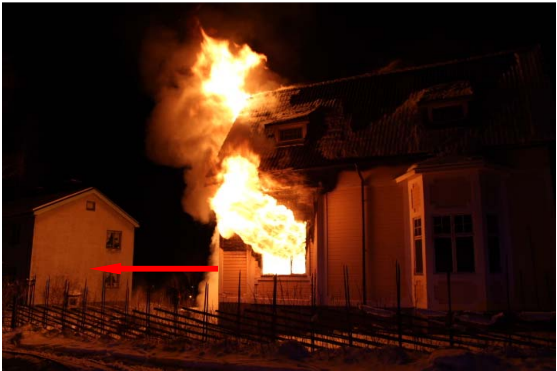
Bild 8. Avståndet till närmaste byggnad är 16 meter, väggfasaden består av (putsad betong).