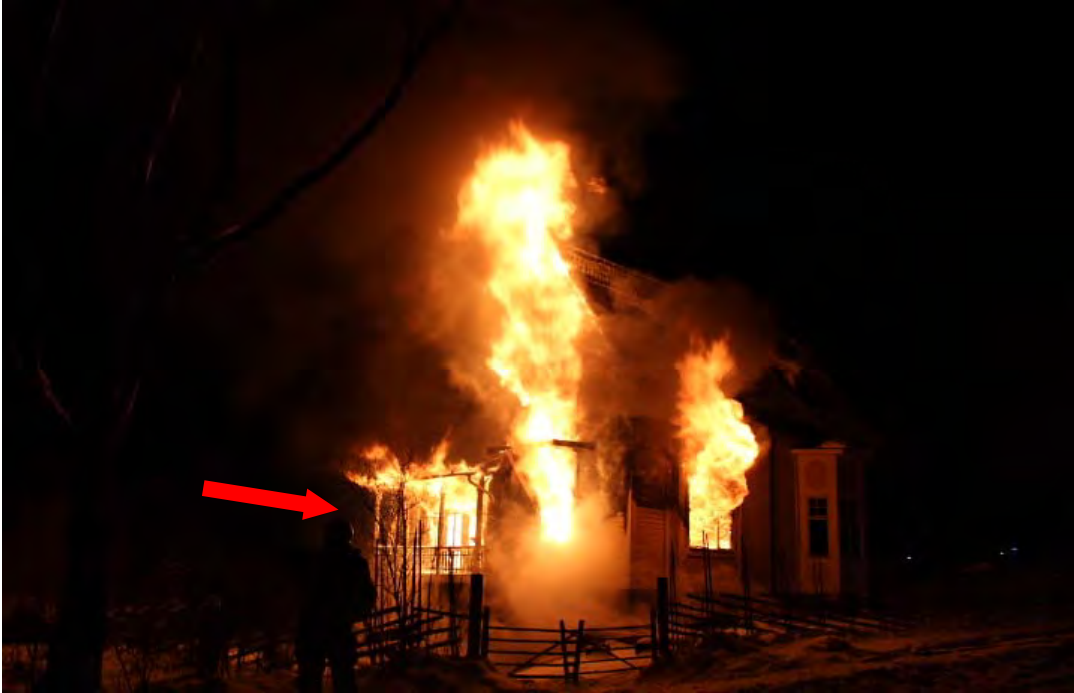
Bild 1. Denna bild är tagen på den västra sidan av byggnaden, bilden är tagen direkt när räddningstjänsten anländer till platsen. Pilen visar altanen på den västra sidan.