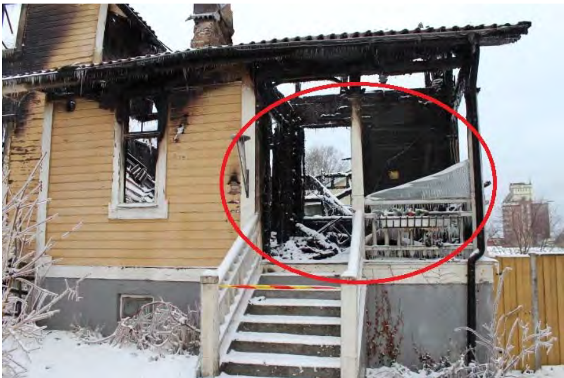
Bild 6. Villans huvudingång, låg brandbild vid hela ingången.