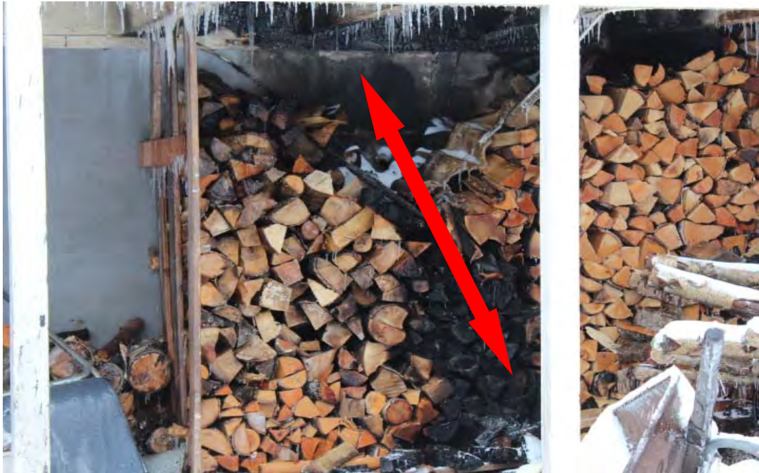
Bild 5. Vedhög som ligger under altanen, man kan se en tydlig bränning i mitten av vedhögen.