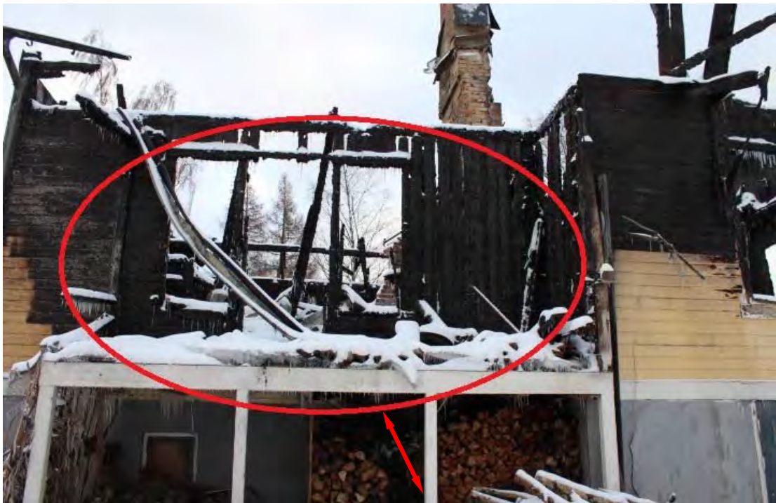
Bild 4. Altanen mot väster, vedhög under altanen. Pilen visar bränningen i vedhögen.