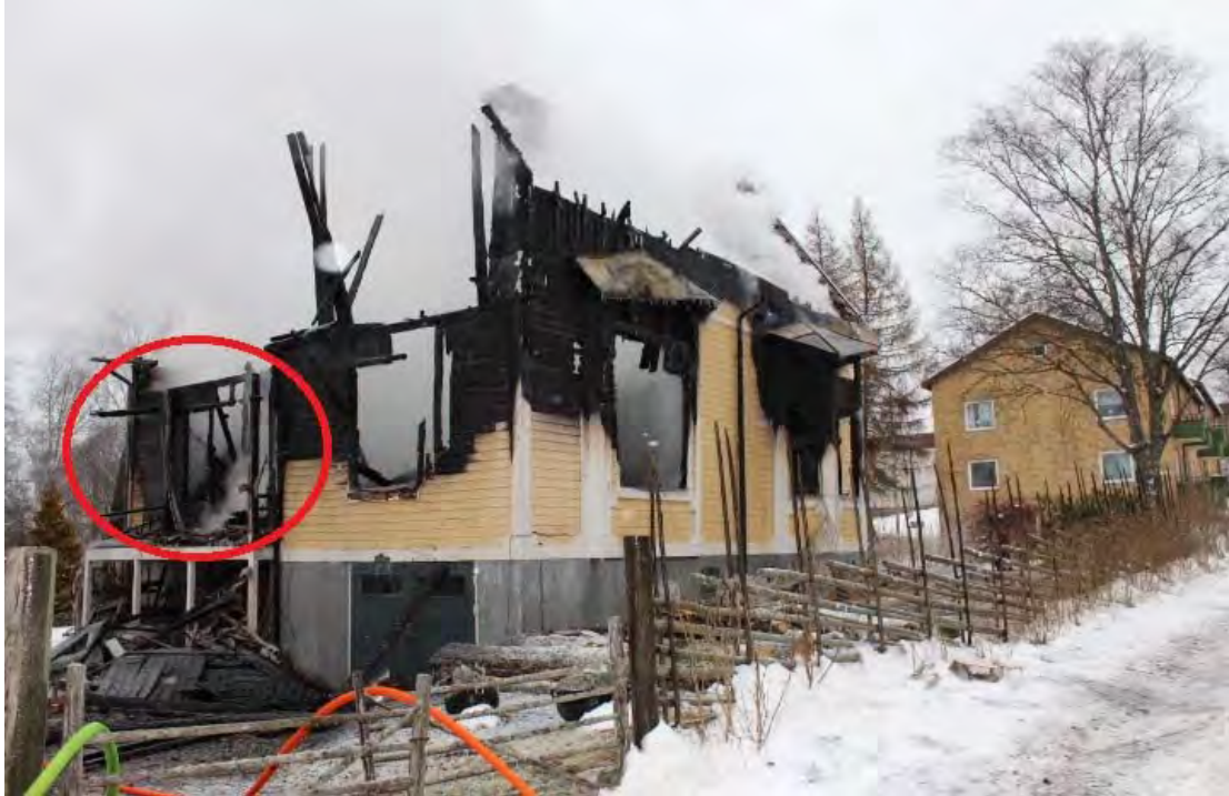
Bild 3. Tagen från samma håll som bild 1 och 2. Det man kan tyda är att brandbilden är väldigt låg vid altanen, ända ner till golvnivå.