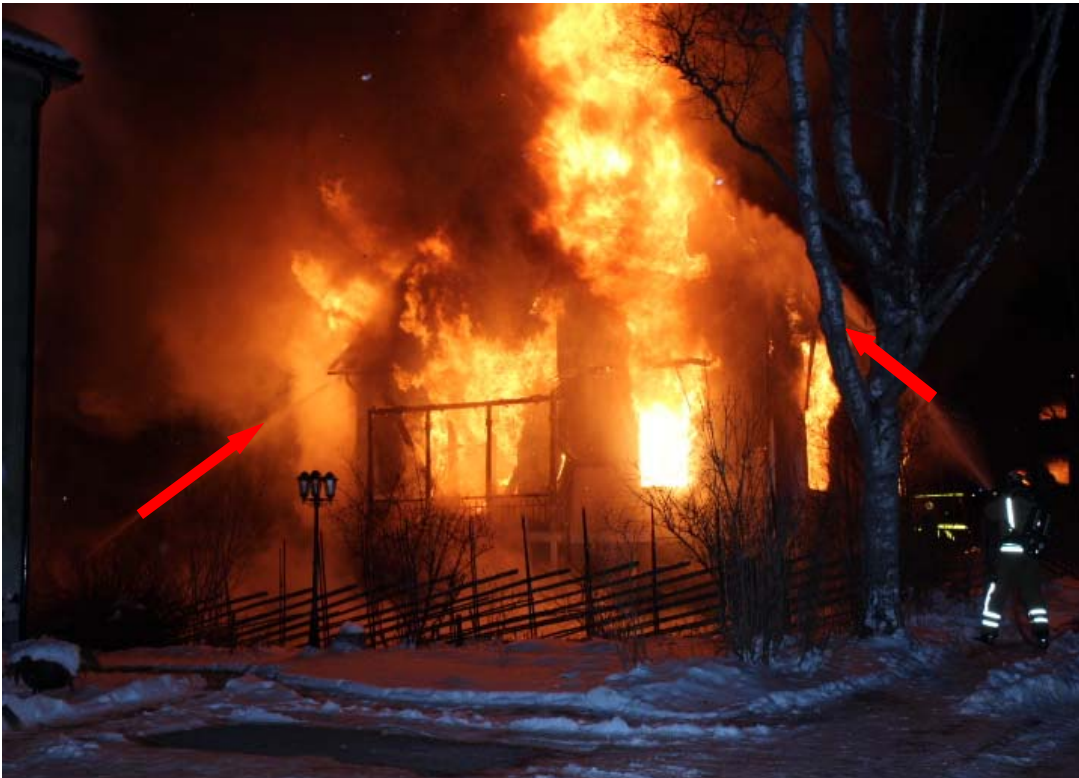
Bild 2. ( röd pil ) Två strålar skyddar mot gnistregnet som låg på mot närmast intill liggande fastighet.