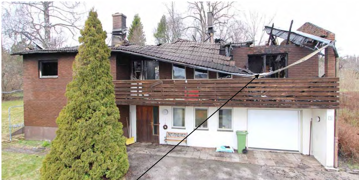
Sovrum där den omkomne påträffades

Den omkomne påträffades dagen efter av polisens tekniker i sovrummet på övervåningen liggandes i sin säng under det nedrasade taket.