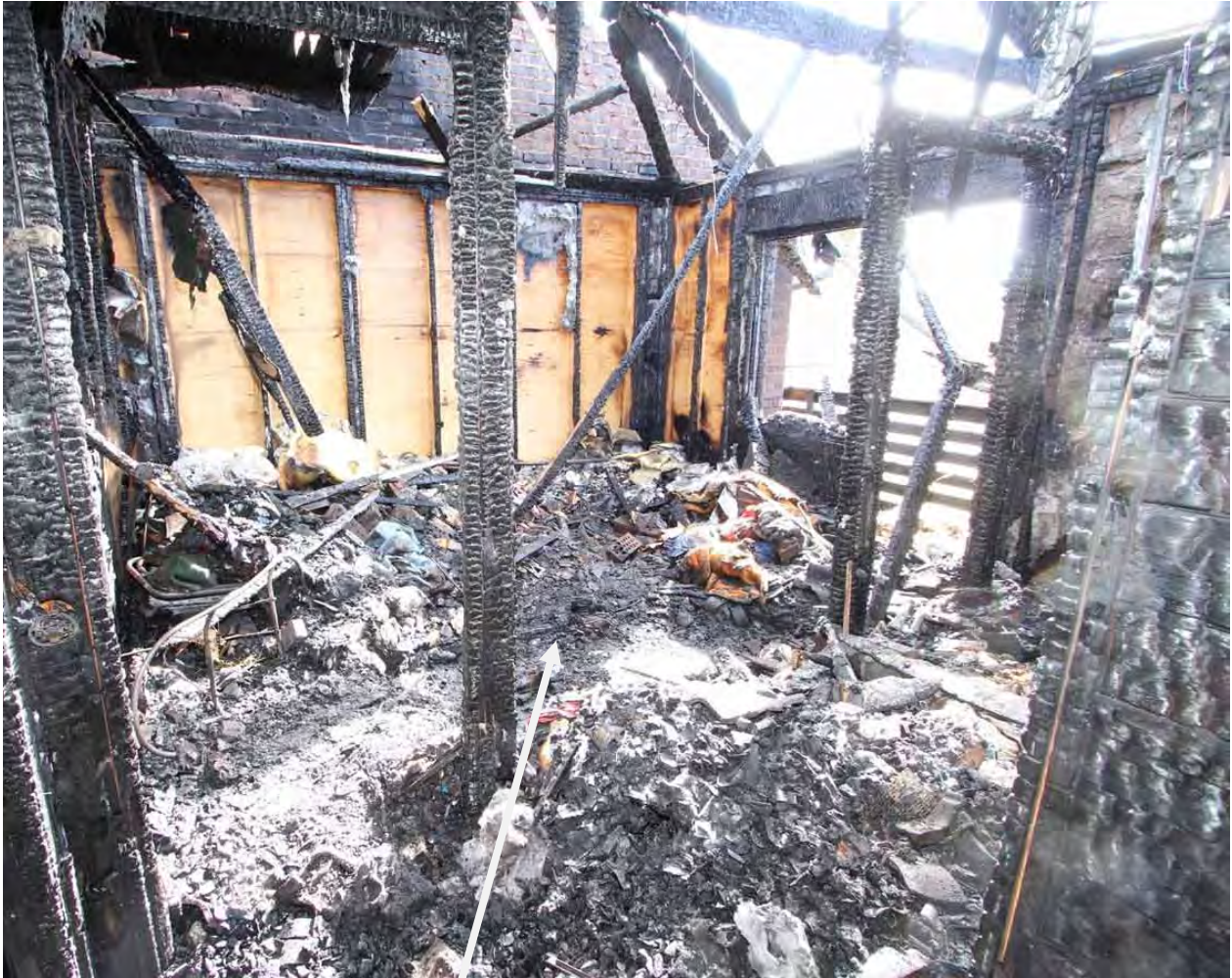
Sovrummet i villans sydöstra hörn. Det var den omkomne påträffades