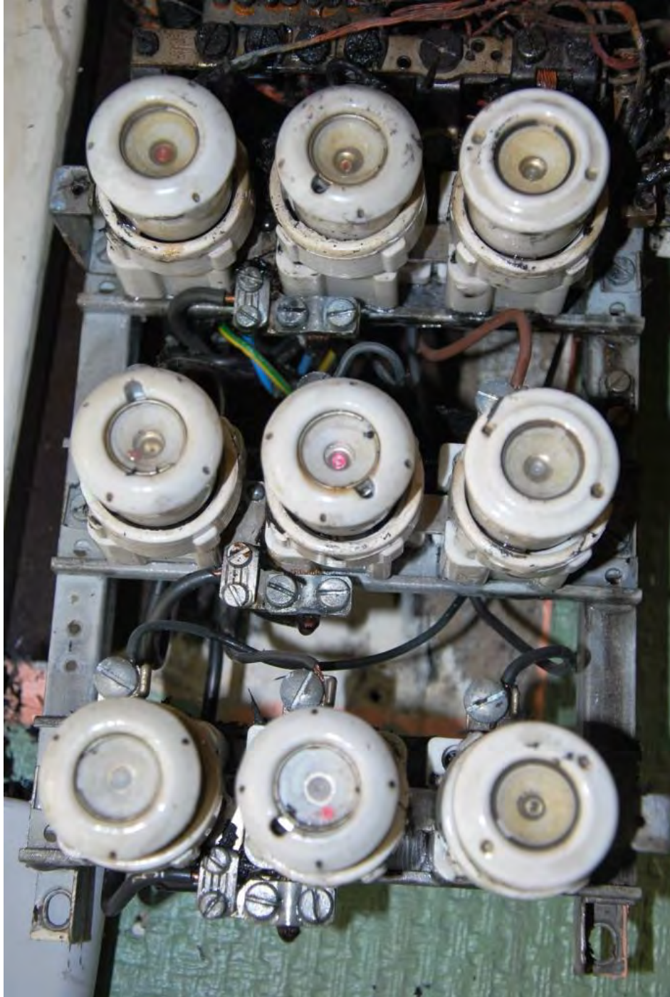
El-centralen där två säkringar hade löst ut. Dock saknades en förteckning över säkringarnas tillhörighet.

Skapat: 2013 Reviderat: 200 Dnr: 420.2013.00382