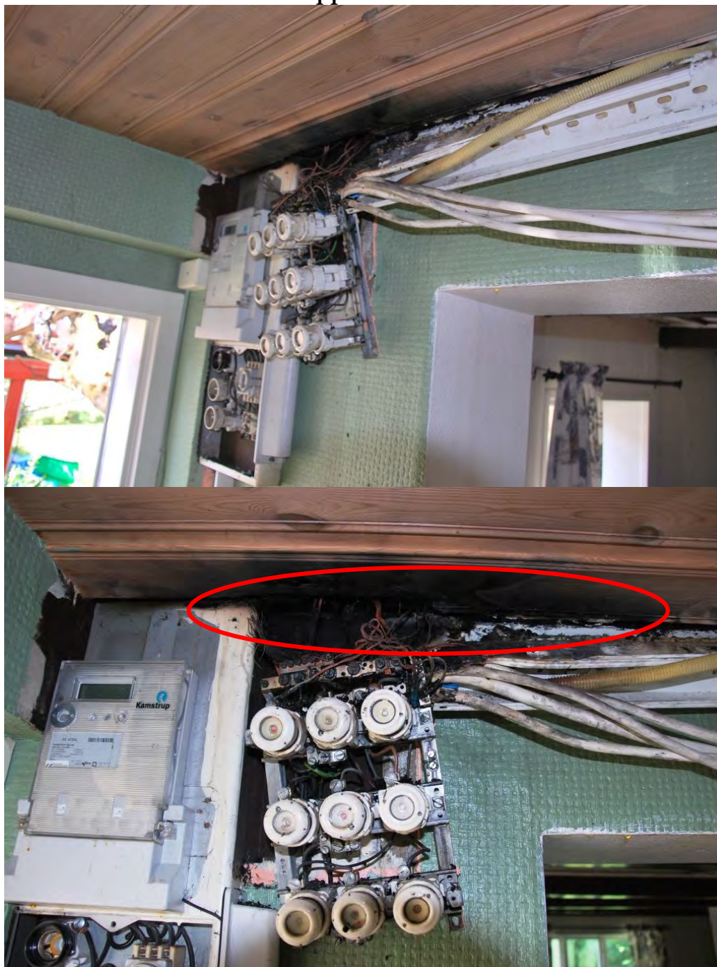
Primärområdet bakom el-centralen