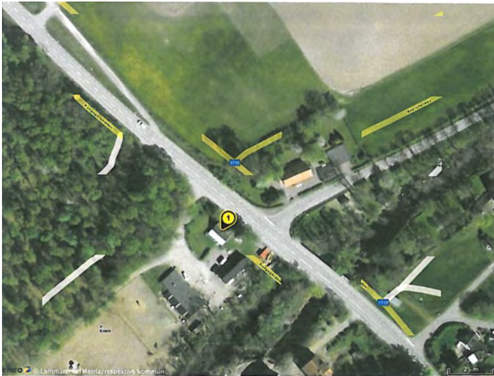
Bild 1. Inom den röda cirkeln är den aktuella byggnaden

Huset har underhand genomgått renovering där även elinstallationen ingick under- 1990 talet, jordfelsbrytare saknades. Skorstenen som är kopplad till en kamin var provtryckt, sotning genomfördes under april månad- 13.