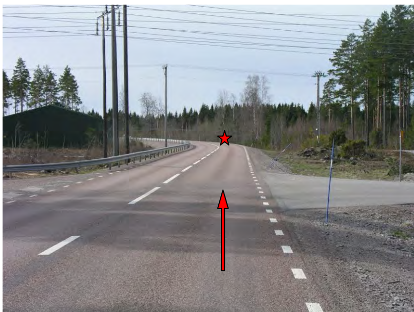
Bild 2: Röda stjärnan visar olycksplatsen. Röda pilen bilens färdriktning

Siktmöjligheterna var goda vid olyckstillfället, vägen var torr och fin men det rådde skymning. Vägens beläggning är asfalt och det fanns inga hål eller ojämnheter i vägbanan. De vitmålade vägmarkeringarna är i gott skick.