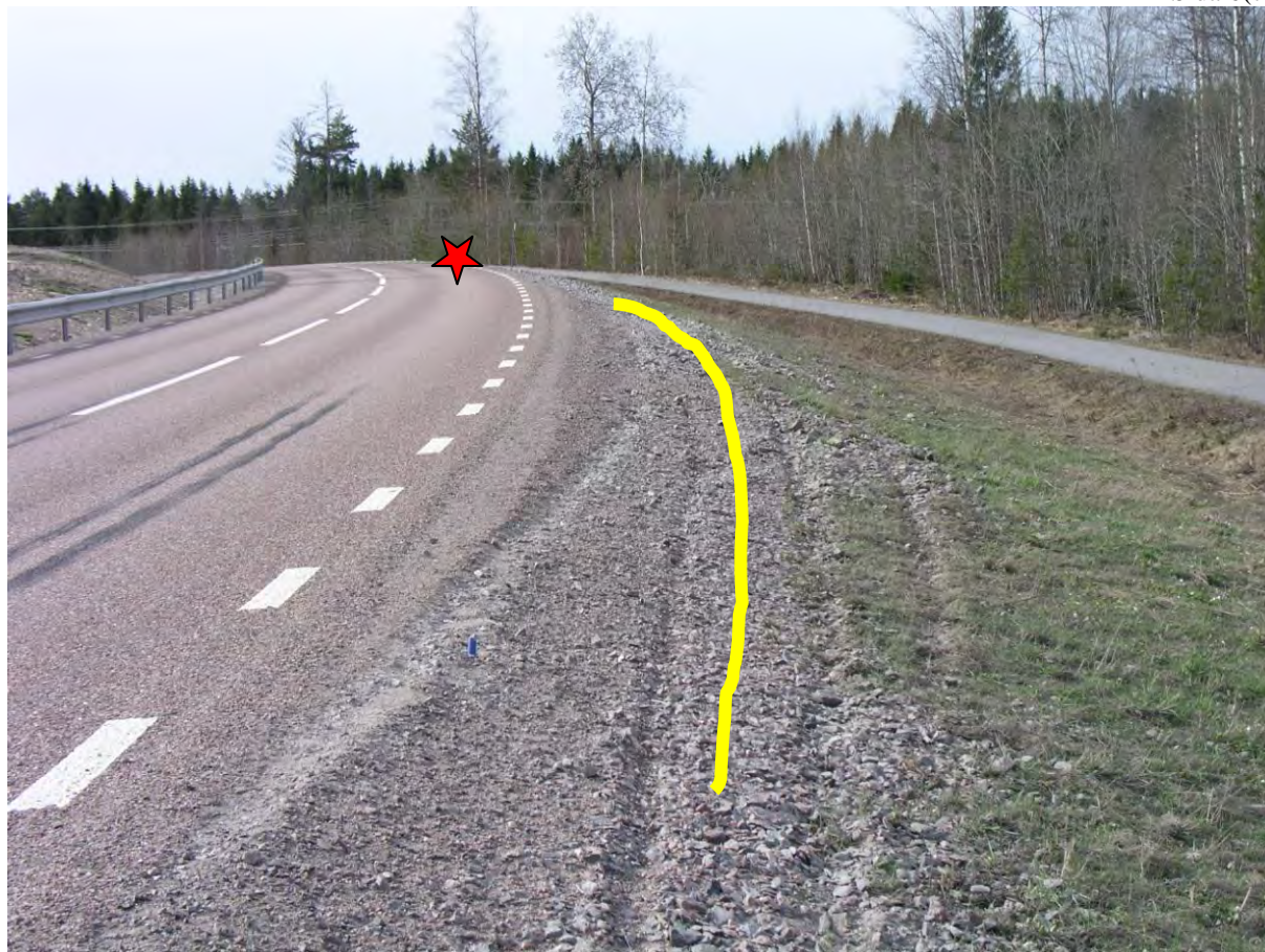
Bild 4: Gula linjen visar bilens färd och spåren visar att bilen får sladd, röda stjärnan visar fordonets slutläge.