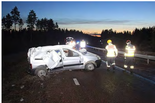
Bild: Personbil, Peugeot.