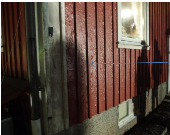
Brandskadad fasad på boningshuset