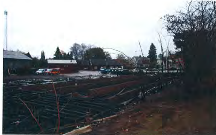
Magasinsbyggnad i Herrljunga centrum.

Anledning till undersökningen: Brand i byggnad