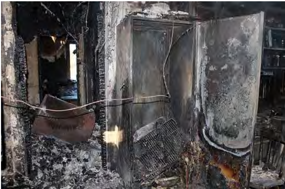
Bild 8. Från köket in i garderoben.