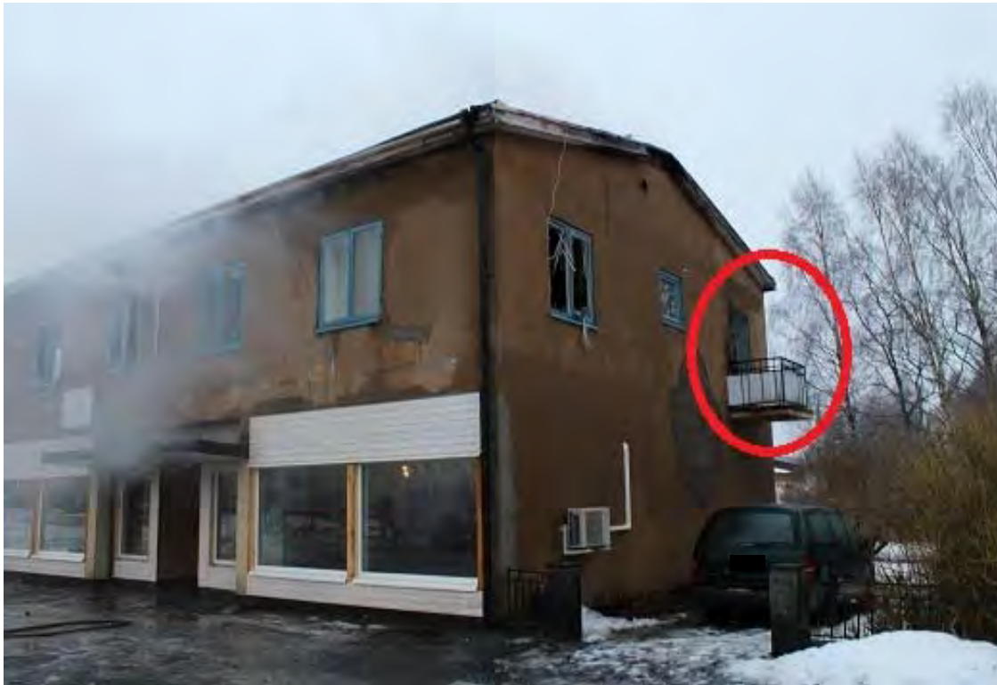
Bild 5. Här hoppar resten av familjemedlemmarna ner från balkongen.