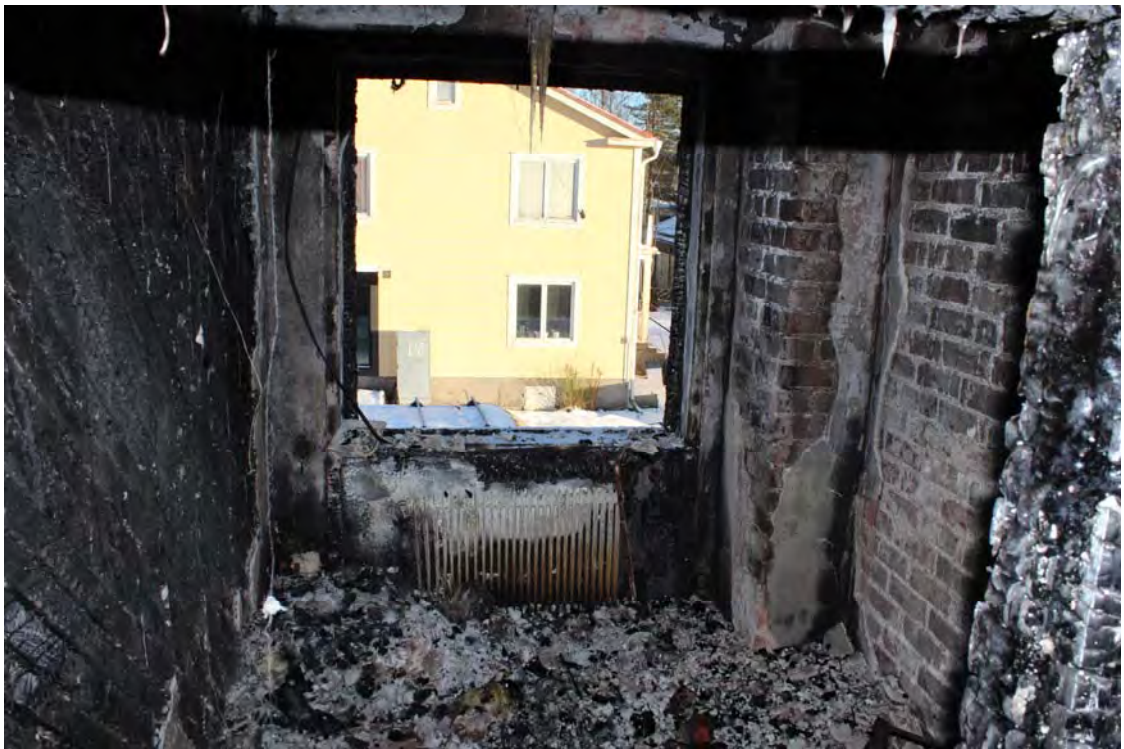
Bild 4. Rummet inifrån där den 13 åriga flickan hoppade ut.