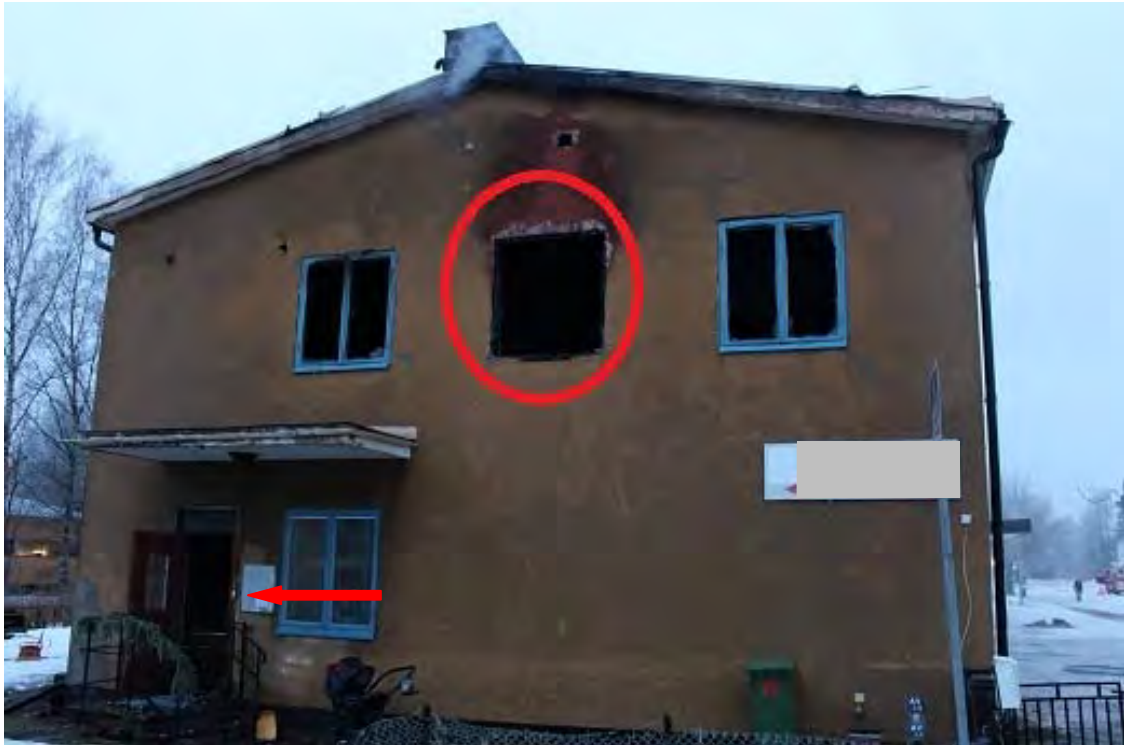
Bild 3. Det här fönstret (röda ringen) hänger en av flickorna i när ambulansen anländer till platsen. Röd pil visar vart entren till lägenheten är.