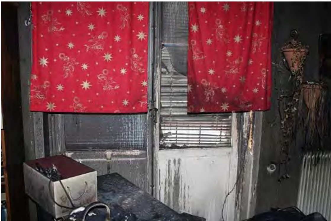
Bild 6. Balkongdörren inifrån, mamman lyckades inte att öppna den inifrån utan krossade fönstret i dörren och öppnade utifrån. Här går övriga familjemedlemmar ut och hoppar ner från balkongen.