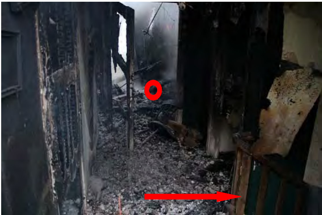
Bild 2. Innanför dörren hittades den omkomna mannen, [redacted] [redacted] Den röda ringen visar vart mannen låg, pilen visar trappen som går ut i det fria.