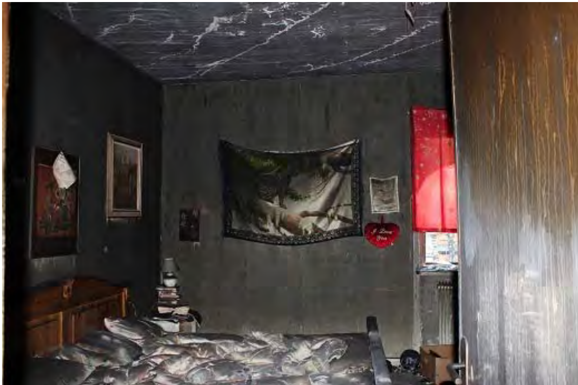
Bild 10. Föräldrarnas och ett åringens rum .