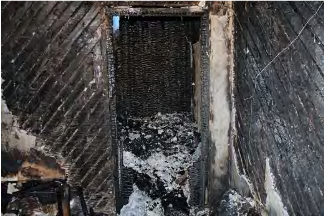
Bild 9. Från den 13 åriga flickans rum in mot garderoben.