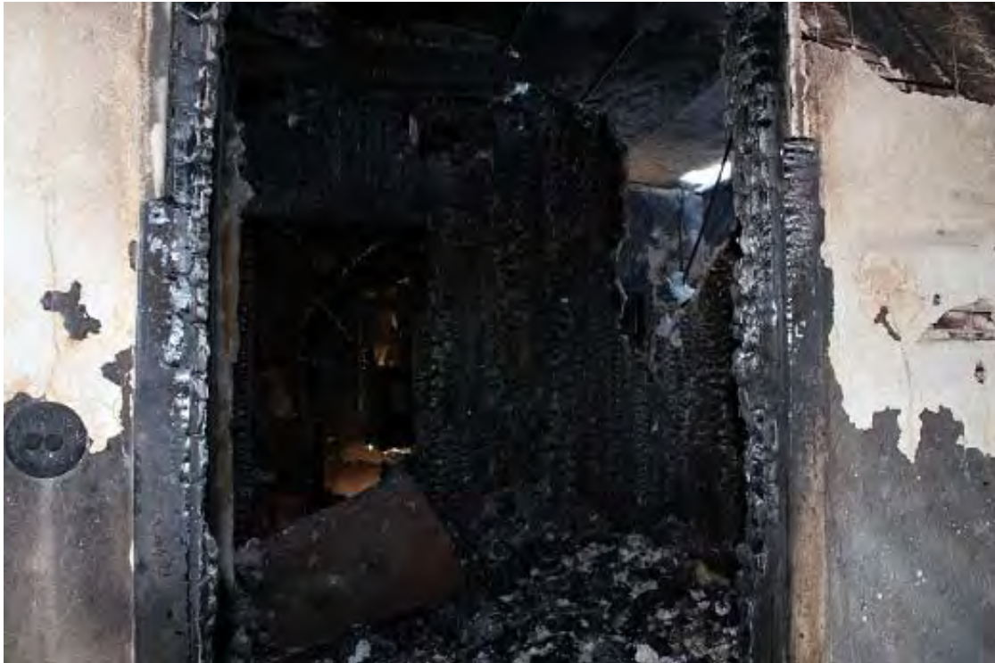
Bild 7. Från den 18 årige sonens rum in mot garderoben.