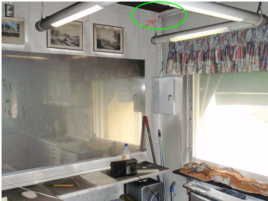
Bilden visar otätheter vid genomföring av el från den drabbade lokalen.