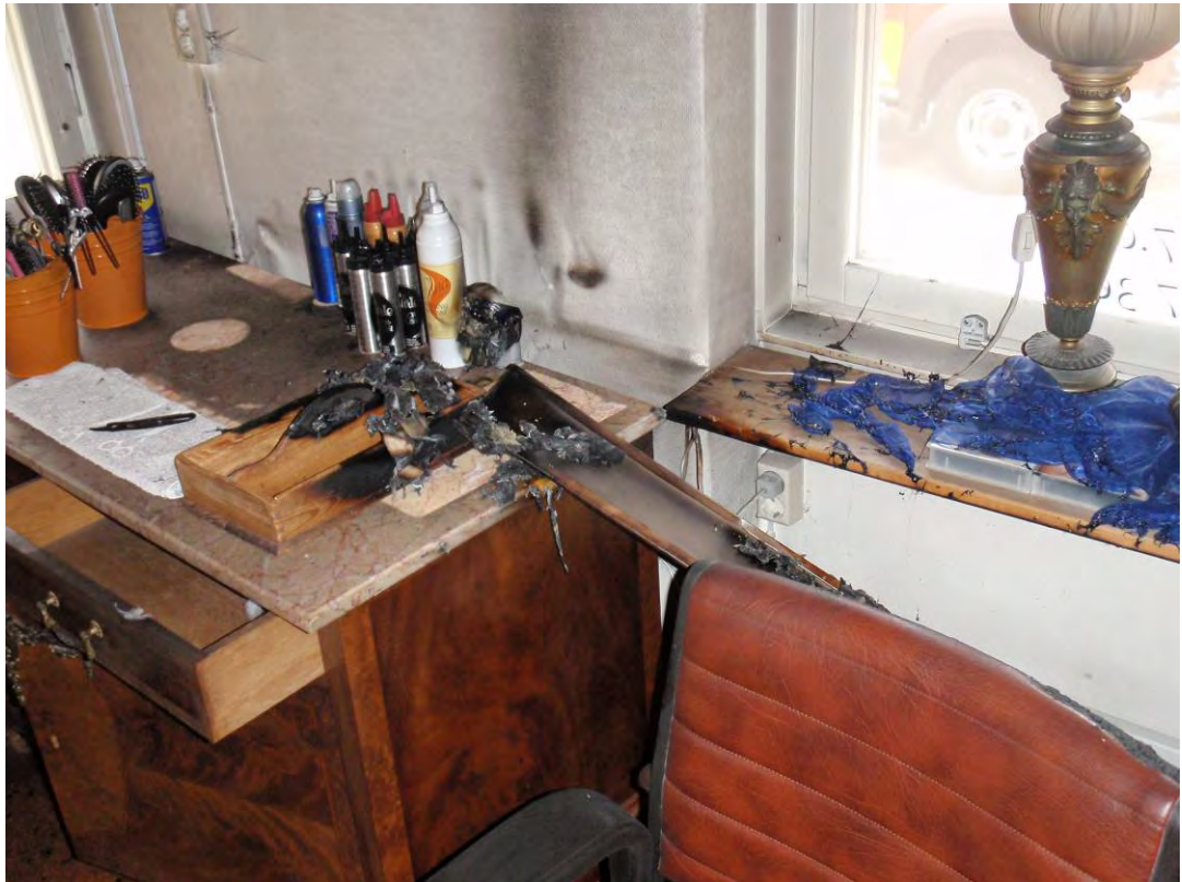
Bild på gardinstång och rester av gardin på bänken.