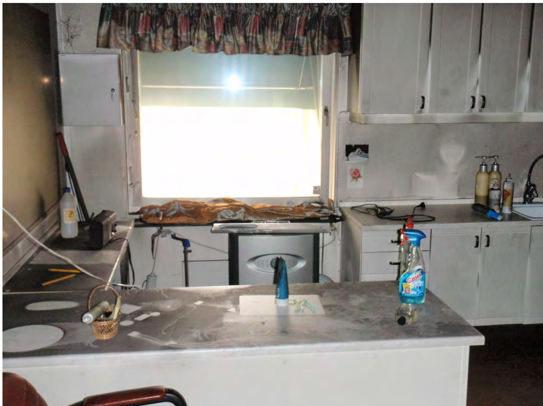
Bilden tagen direkt till vänster när man kommer in i lokalen. Fönstret som syns på bild har stått öppet under förloppet.