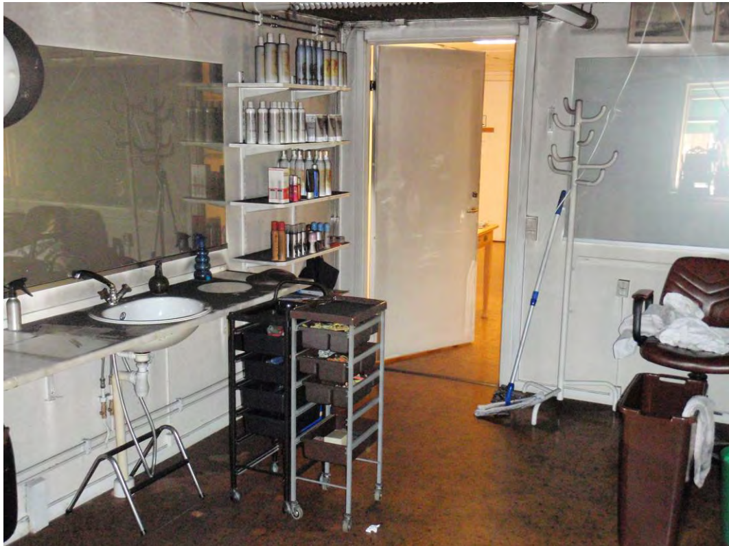
Bild tagen mot entrédörren.