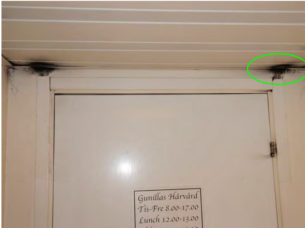
Bilden visar att det finns otätheter ovan entrédörren.