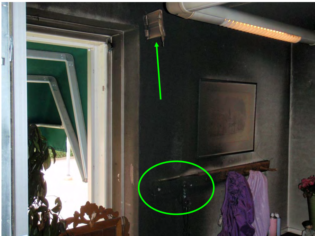
Bild tagen mot den vägg där diverse el-komponenter hängde. Krokar inringade. Pil visar fäste för gardinstång och gardin som branden spred sig till.