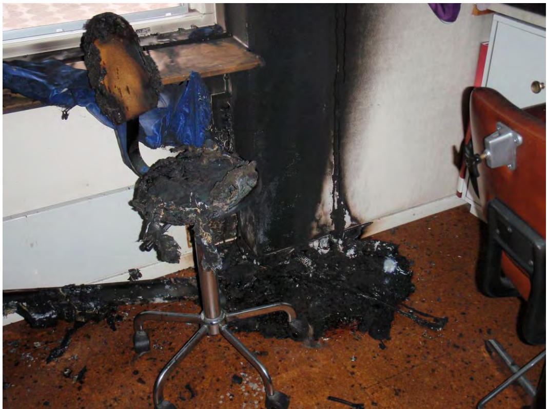
Bild på rester som rasat ner på golvet och stolen som branden spred sig till