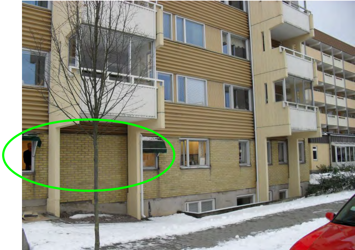
Bilden visar fönster till lokalen. (inringat)