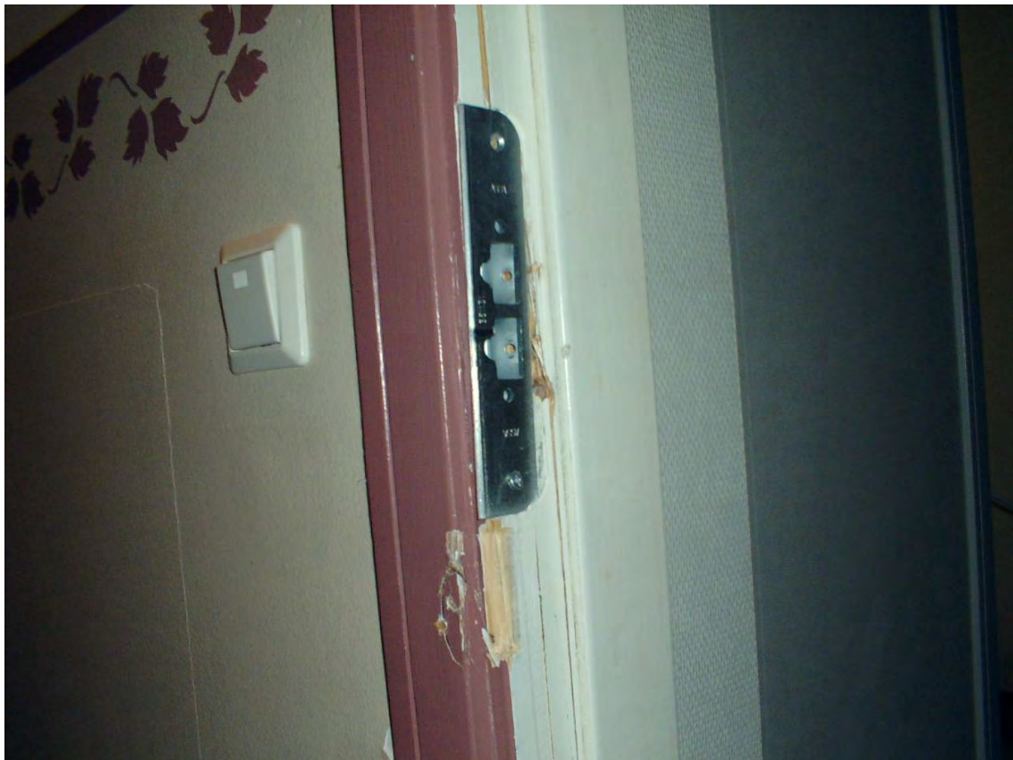
Bild 6. Dörrbrytning