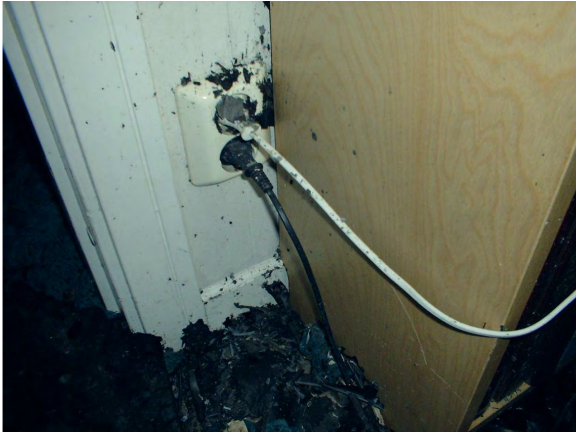
Bild 5. Hårfönen, ansluten till vägguttag