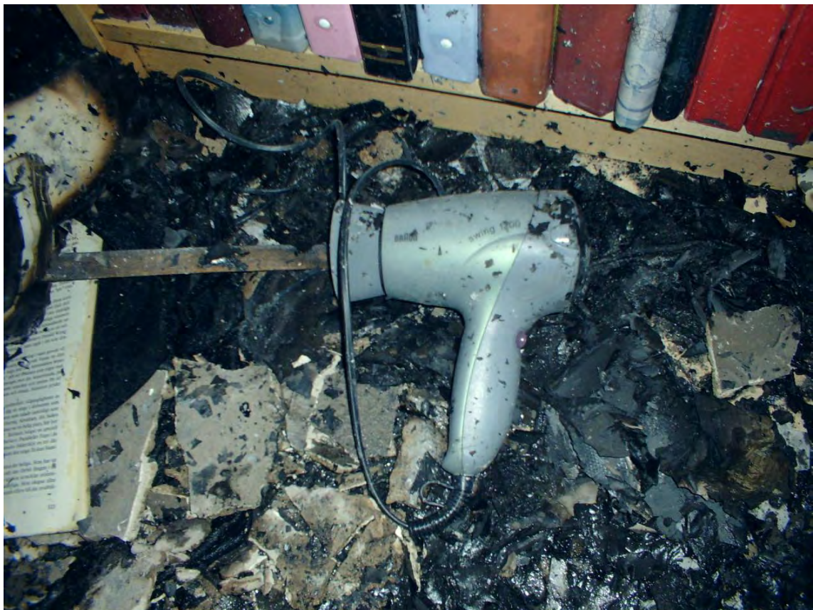
Bild 4. Hårfönen