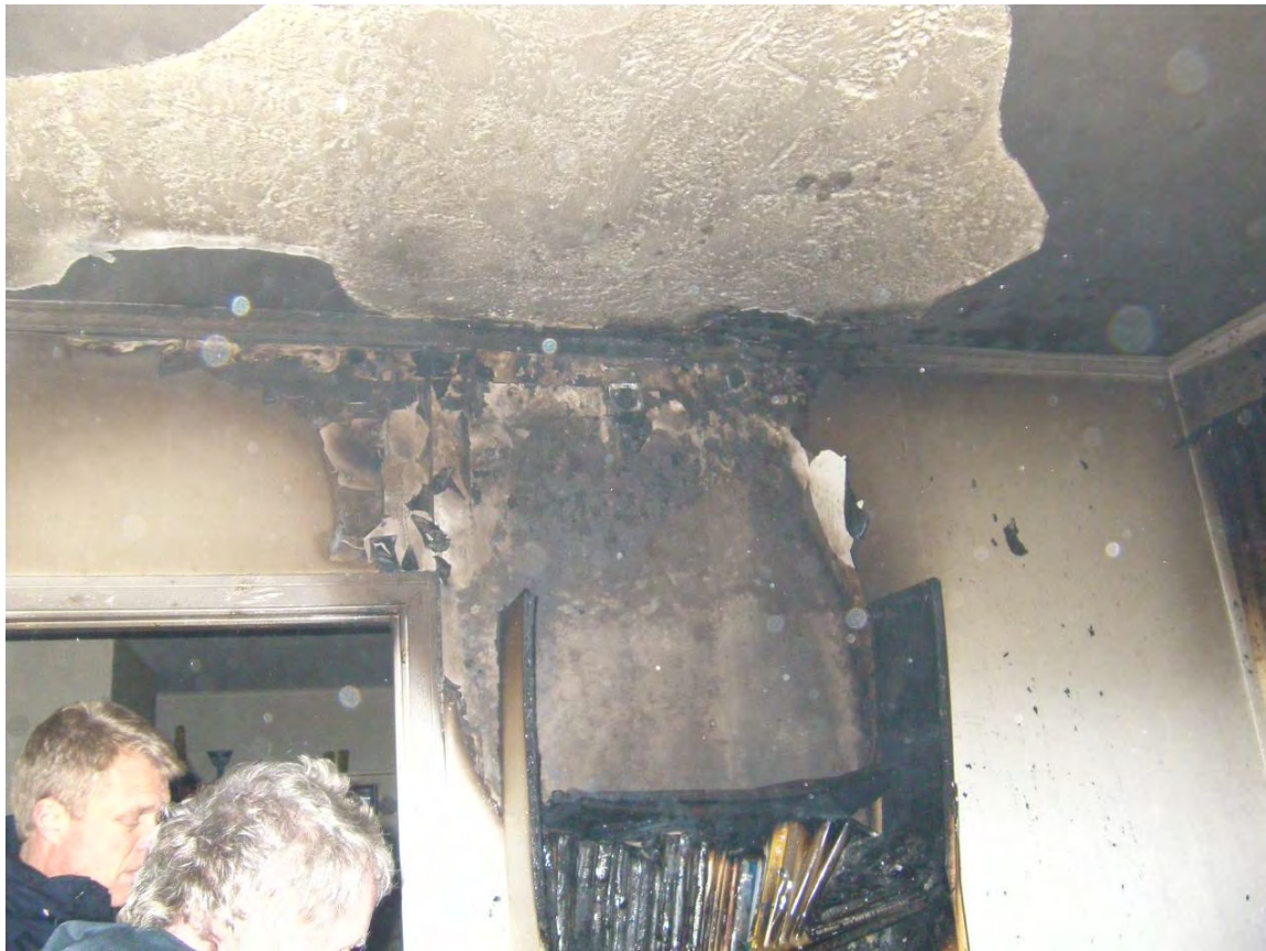
Bild 3. Bild tagen under släckningsarbetet.