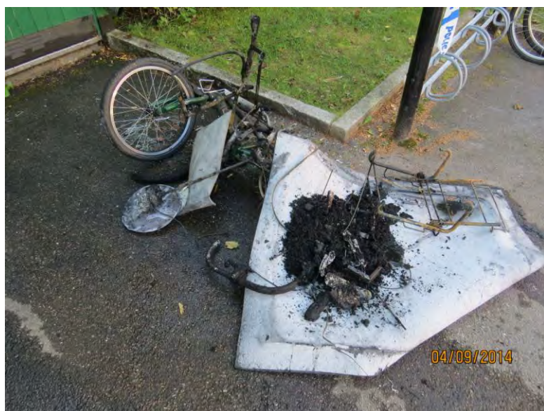
Bild 7. Bilden visar resterna efter en barnvagn och en cykel.