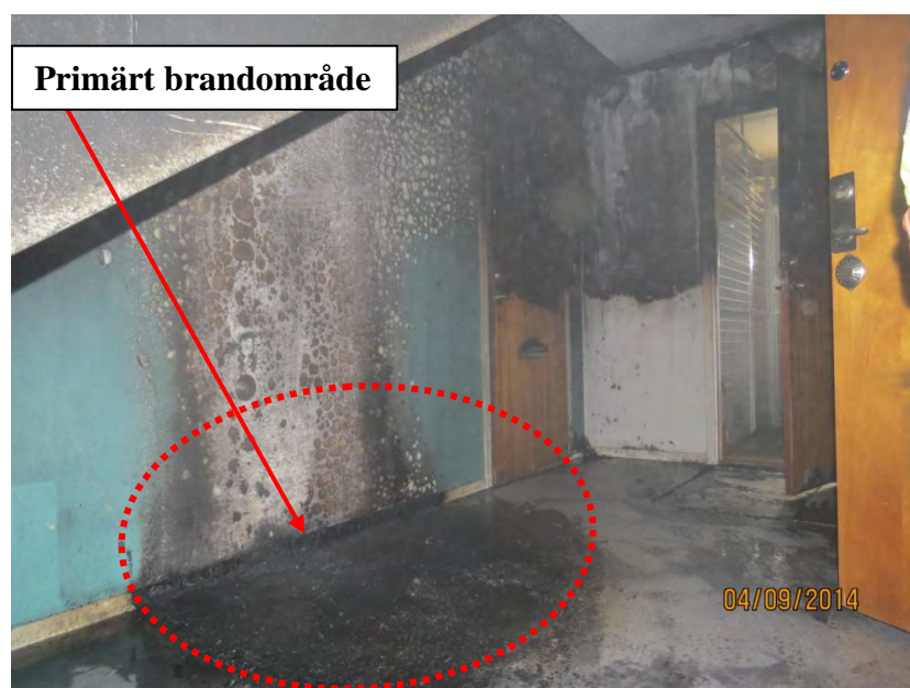
Bild 2. Bilden visar det eldhärjade trapphuset i solröksgatan 22B där det brunnit på nedre plan i en barnvagn och cykel.

Brandplatserna är belägna i trapphusen i ett flerbostadsområde med företrädevis hus i två våningsplan och en bärande konstruktion i tegel och betong (se bild 1). Vid denna händelse såg samtliga trapphus likadana ut. Bränderna har utvecklats olika beroende på vad som brunnit se bilderna 2, 3, 4 och 5.