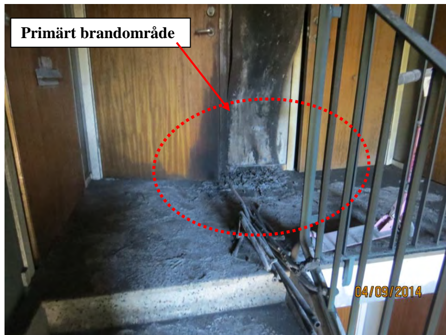
Bild 3. Bilden visar det eldhärjade trapphuset Solröksgatan 11B där det brunnit i en barnvagn på övre plan.