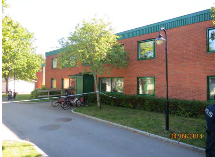
Bild 1. Bilden visar en av de eldhärjade byggnaderna som är belägen i stadsdelen Andersberg i Gävle.

Brandplatserna är belägna i trapphusen i ett flerbostadsområde med företrädevis hus i två våningsplan och en bärande konstruktion i tegel och betong (se bild 1). Vid denna händelse såg samtliga trapphus likadana ut. Bränderna har utvecklats olika beroende på vad som brunnit se bilderna 2, 3, 4 och 5.