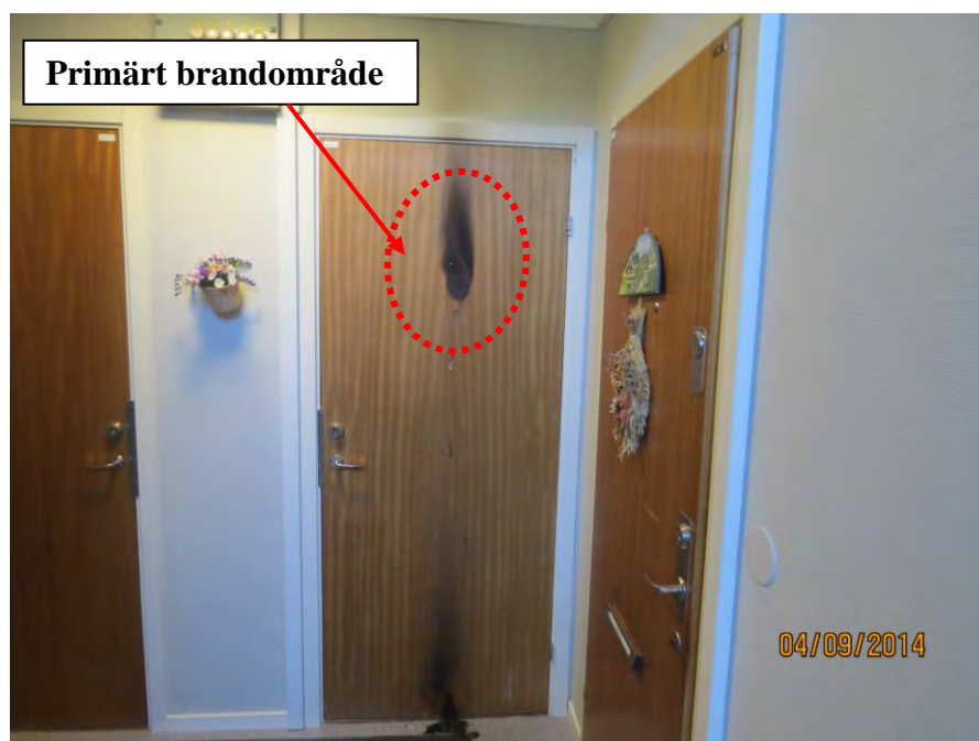
Bild 4. Bilden visar det eldhärjade trapphuset Solröksgatan 13C där det brunnit i en dörrdekor som ramlat ned på golvet och självslockna. På dörren till höger syns den dekoration som endast fick brännmärken i underkant.