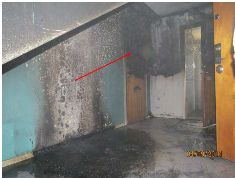
Bild 6. Bilden visar hur branden påverkat väggar och dörrar i trapphuset.

Branden i trapphuset 22B har startat i en barnvagn (se bild 7) och spridit sig vidare i väggar och dörrar i trappuppgången (se bild 6). Då barnvagnen stått under trappen så har branden tryckts mot dörrarna som syns i bild 6. Dörrarna är kraftigt förkolnade i överdelen. Branden i trapphuset 11B har en smalare brandspridning uppåt efter väggen och har en mindre brandpåverkan på dörrarna (se bild 8).