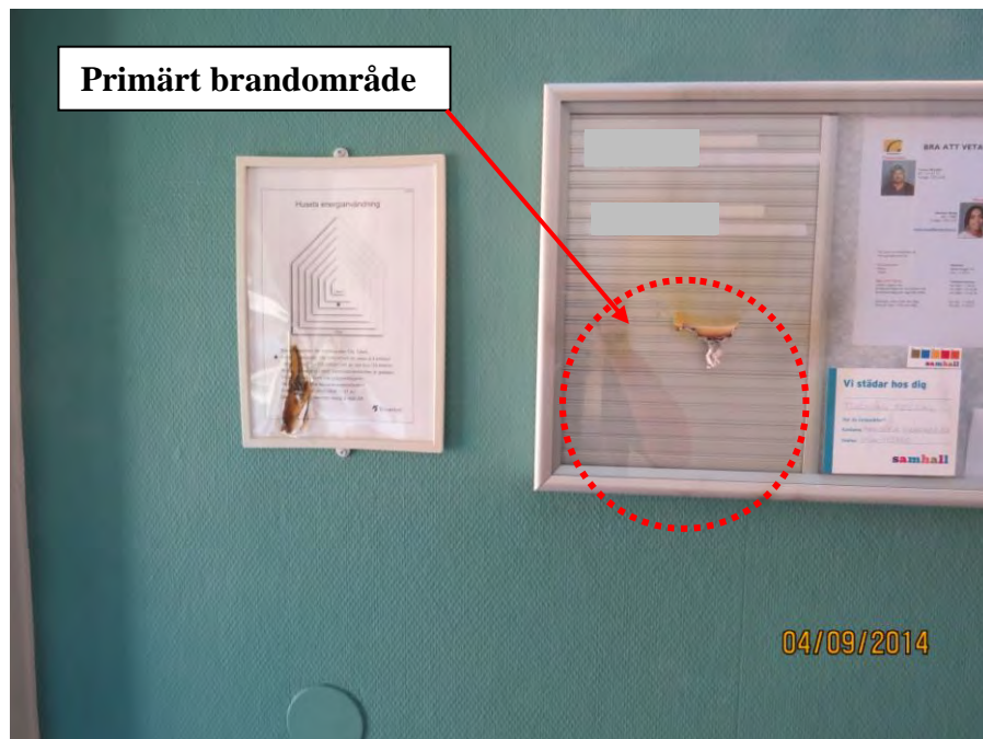
Bild 5. Bilden visar det eldhärjade trapphuset Solröksgatan 13A där det brunnit i en papperslapp som ramlat ned på golvet och självslocknat.