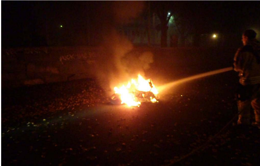
Bild 3. Mopeden (Moped B) brann på gångbanan utanför Karl Johansskolan.

Klockan 00:52 fick Gårda nytt larm om brand i mindre motorfordon på Amiralitetsgatan. Denna gång åkte två brandmän ut med VE. Troligen var det ytterligare en moped (Moped C) som brann på ungefär samma ställe som den tidigare (Moped B). Mopeden släcktes och brandmännen samtalande med Polisen, som nu redan fanns på plats på grund av att det var stökigt i området. Gårdas VE avslutade och återvände sedan till stationen. Det finns ingen registrering om att Polisen begärt bärgning/bortforsling av mopederna.