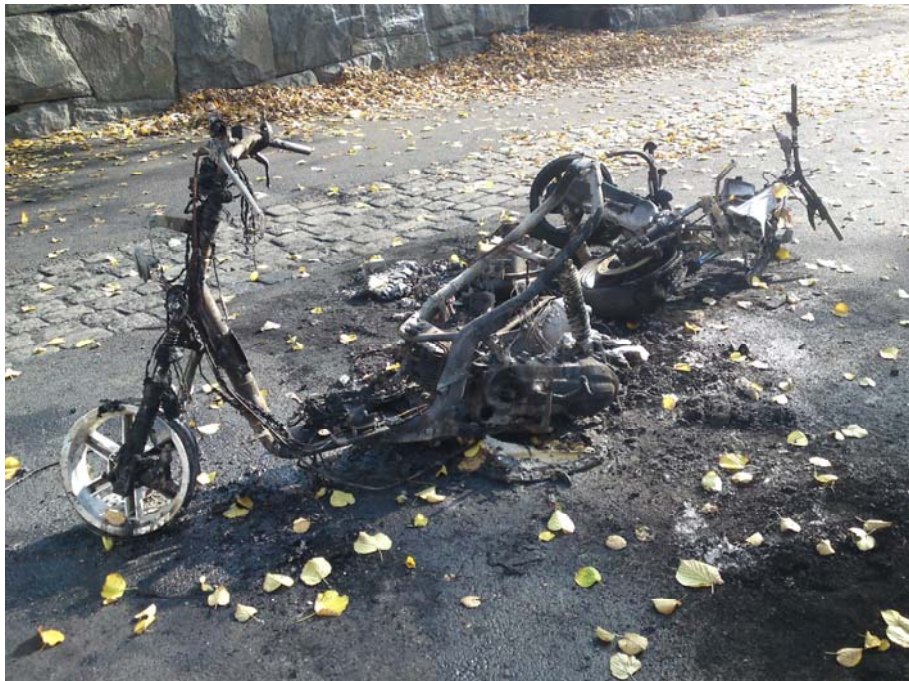
Bild 4. Fotot på de två utbrunna mopederna (troligen Moped B och C) är taget på dagen den 1 oktober av en boende i området.

På dagen den 1 oktober tog en boende i området ett antal foton på de två utbrunna mopederna. Fotona är daterade 2011-10-01 klockan 12:25 (Bild 4).