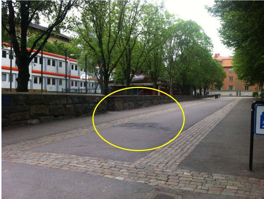
Bild 2. Inringat område markerar platsen för mopedbränderna och fallolyckan. (Karl Johansskolan till vänster i bilden)