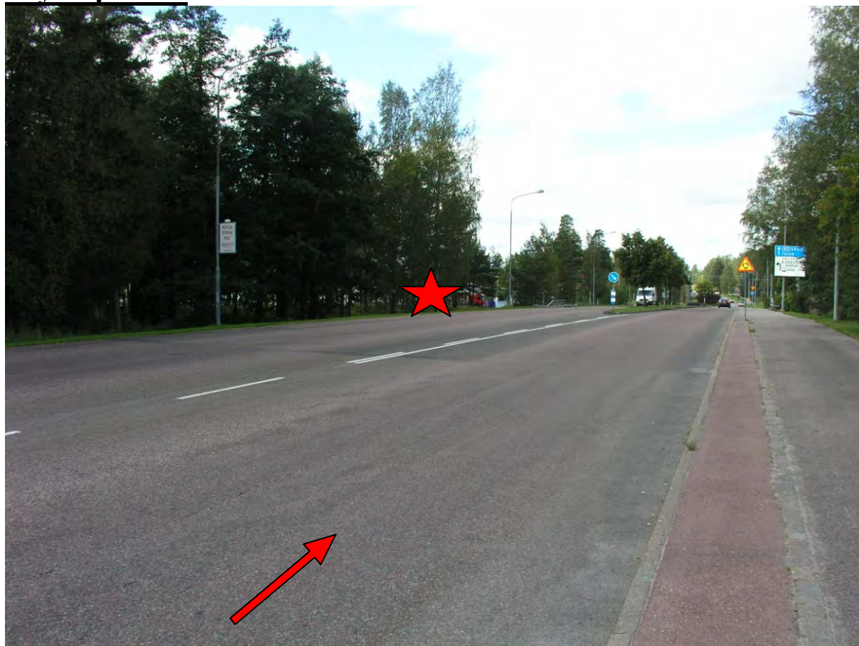
Bild 1: Den röda stjärnan anger olycksplatsen och röda pilen visar varifrån bilen kommit.

Olycksbilen har kört av vägen på vänster sida (se bild 1).