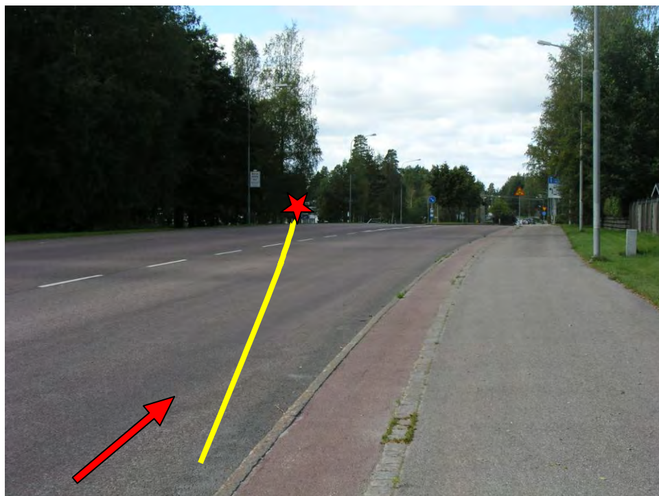
Bild 4: Röda pilen visar riktningen som personbilen kommit ifrån, gula linjen visar den väg personbilen åkt innan kollisionen. Röda stjärnan visar olycksplatsen.

Personbilen kör Gävlevägen västerut på den vägsträcka som visas i bild 4. Föraren får sladd på bilen och sladdar från höger körfält över vägen och ned för en grässlänt på vänster sida av vägen (se bild 4). Den totala sladdsträckan är ca 90 meter. Bilen sladdar så att han träffar trädet med höger sida (se bild 5). Då fordonet är högerstyrt så utsätts föraren för kraftigt våld mot huvudet vid kollisionen. Vittnesuppgifter till räddningstjänstens personal säger att bilen kört på fel sida av refuger och i mycket hög fart.