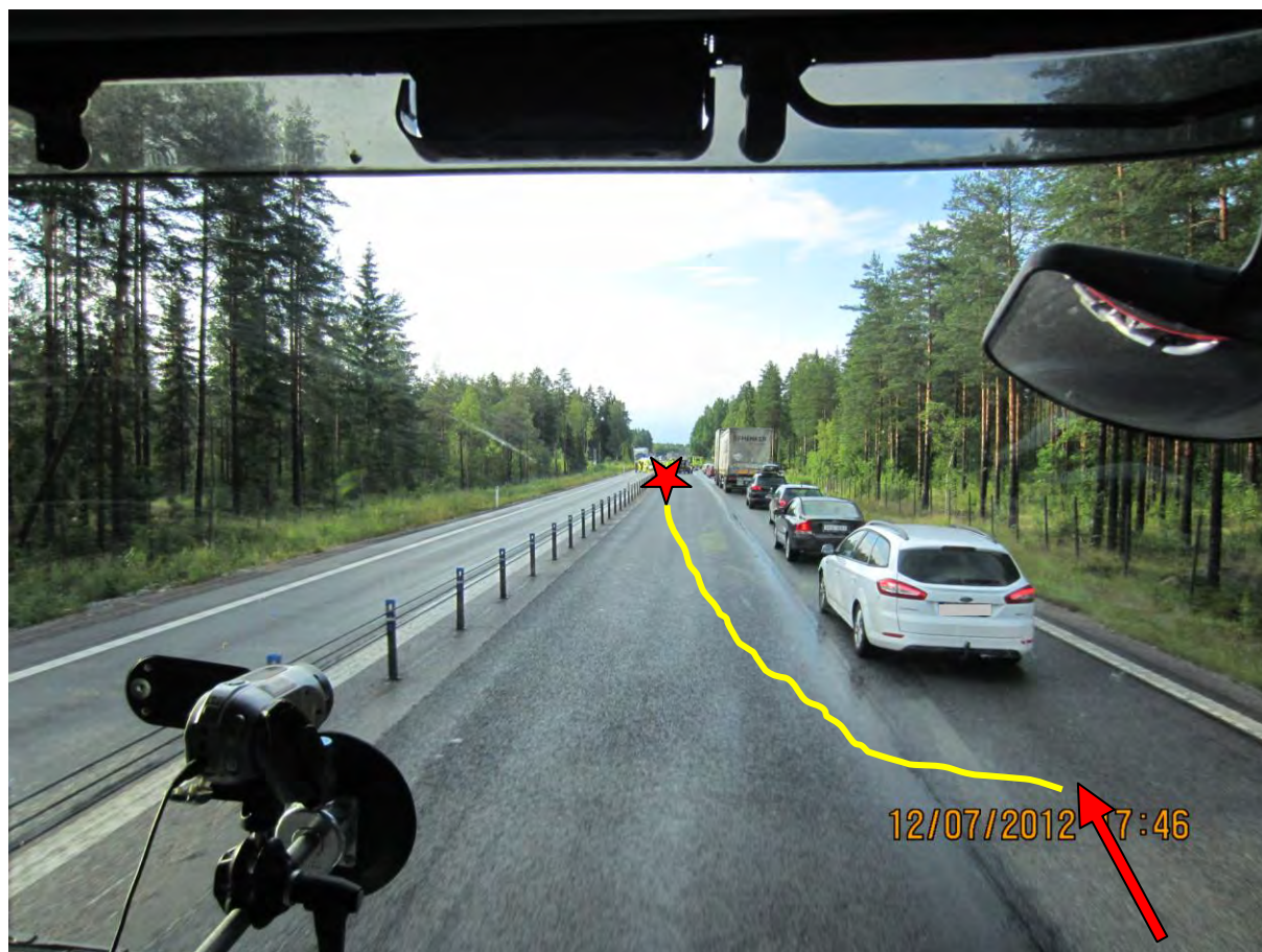
Bild 2: Röda pilen visar riktningen som motorcykeln kommit ifrån, gula linjen visar den väg mc:n åkt innan den sladdar in i vajerräcket. Röda stjärnan visar olycksplatsen.

Motorcykeln kör E4:an norrut från Gävle. I vägavsnittet som syns i bild 2 påbörjar mc-föraren en omkörning och accelererar kraftigt. När han kommer upp på den nyasfalterade vägbanan i vänster körfält får han sladd på motorcykeln och kör omkull. Vid omkullkörningen kastas föraren av motorcykeln och far in i vajerräcket (se bild 3)