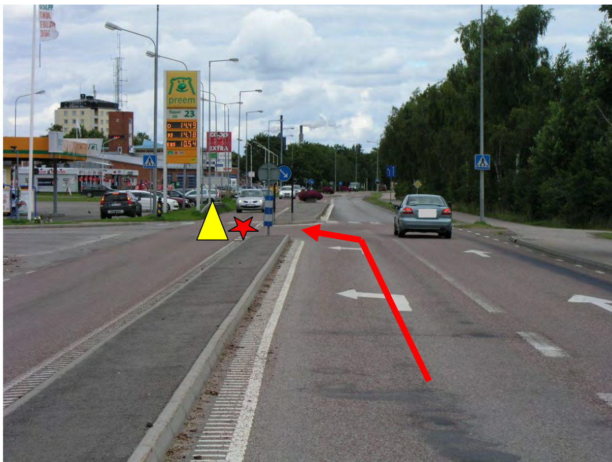
Bild 3: Röda pilen visar den väg personbilen kört, Röda stjärnan visar olycksplatsen och gula triangeln visar var mc-föraren låg efter kollisionen.

Personbilen kör Gävlevägen i riktning mot Gävle. I vägavsnittet som syns i bild 3 svänger han vänster in på Nygatan. Samtidigt kommer motorcyklisten och kör i motsatt riktning (se bild 4). Motorcyklisten kolliderar med personbilen på dess höger sida vid bakskärmen (se bild 5). Föraren blir liggandes vid kollisionen och motorcykeln hamnar ca 30 meter bortanför platsen (se bild 4).