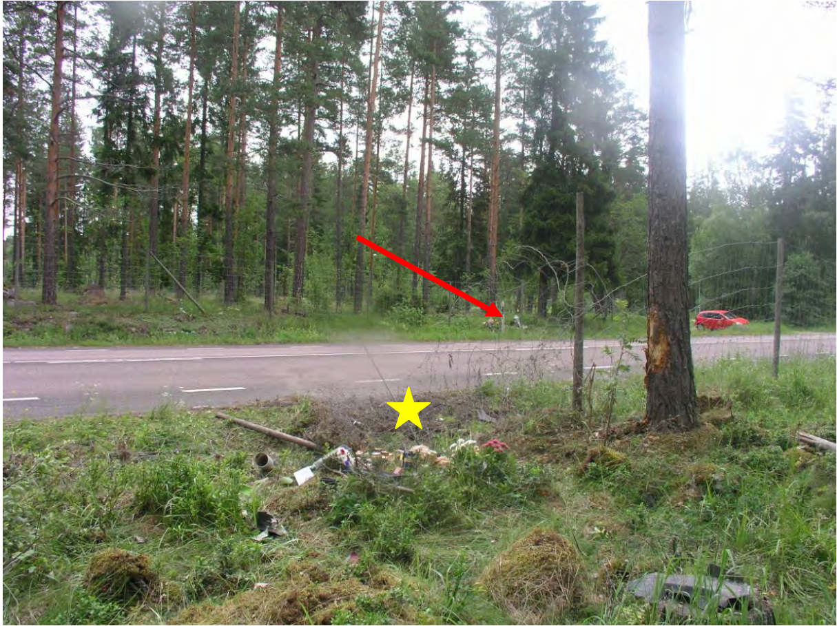
Bild 8: Gula stjärnan visar bilens läge och röda pilen visar var mannen låg.