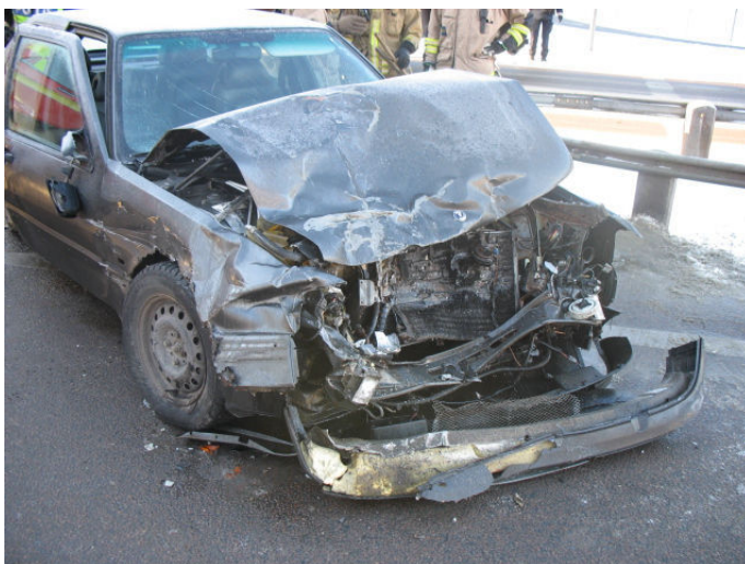
Bild 2. Personbilen som kolliderade med släck-/räddningsbilen.

Släck-/räddningsbil 111 anländer strax efter kollisionen och påbörjar skadeavhjälpanande åtgärder på den nya olycksplatsen.