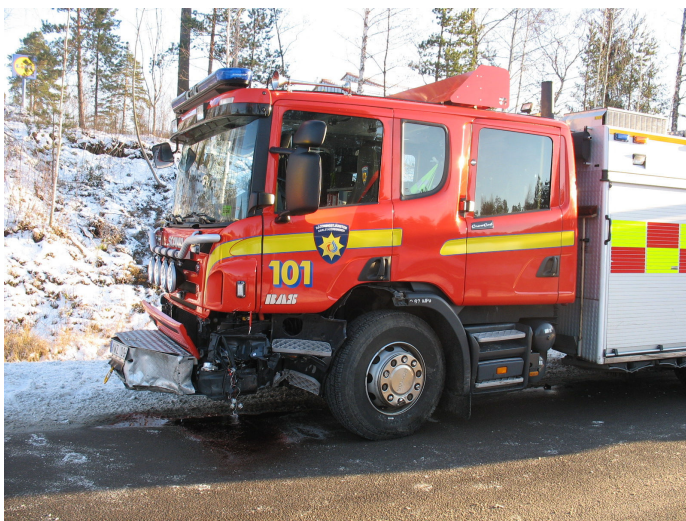
Bild 3. Släck-/räddningsbil 101.

Mot bakgrund av de uppgifter som fanns från de båda trafikolyckorna var RCB's bedömning att bil 111 skulle kunna fortsätta mot trafikolyckan vid Vallargärdet, efter att den nya olycksplatsen var säkrad. Personal från bil 101 skulle kunna stanna kvar på den nya olycksplatsen och utrustning från bil 101 skulle kunna användas vid behov.