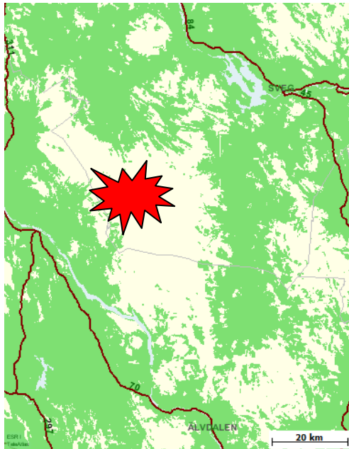
Telias täckning i området och olycksplatsen.