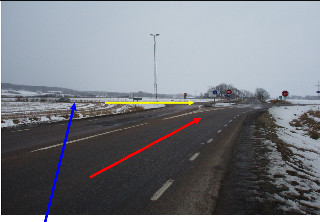
Bild tagen norrifrån (det hållet som olycksbil 1 kom ifrån. Obs svackan som börjar vid blå pil.

Datum Dnr: 2006-07-23 Eget larm nr: 2006A00094.