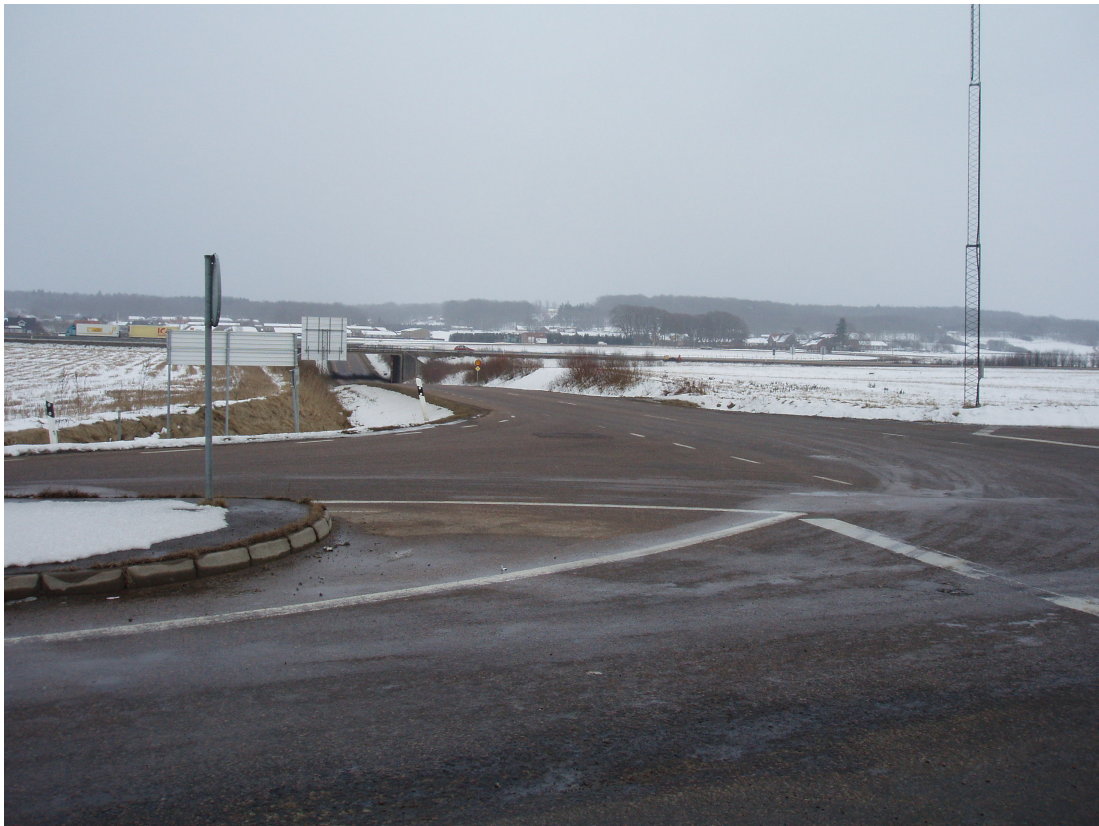
Bild tagen framme vid stoppmarkeringen. Bilden tagen mot öster.

Datum Dnr: 2006-07-23 Eget larm nr: 2006A00094.