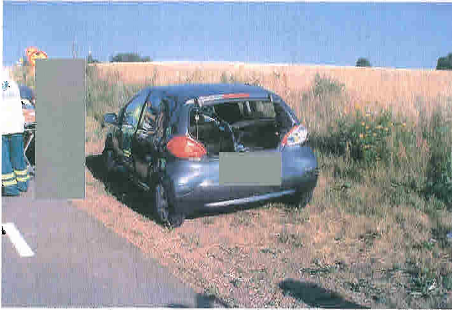
Påkörd bil i vägkant på Tingvägen.