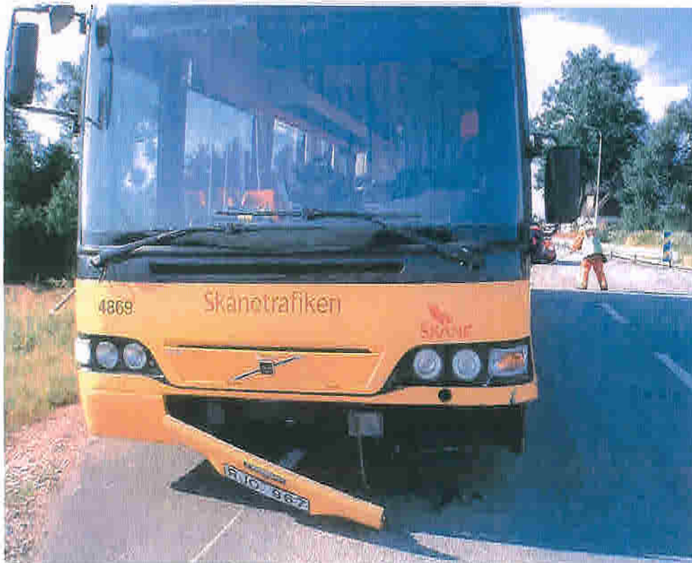
Buss som kört i bakändan på personbil. Står med fronten mot Landskrona.