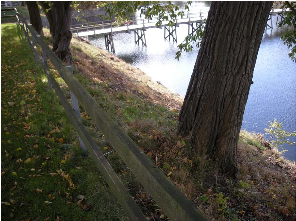
Bild 2, Brant sluttning på andra sidan staketet

Vid platsbesök längs Systratrömmen 2012-10-09 visade det sig att det är staket hela vägen som borde hindra från fall ner i vattnet. Om man tar sig över staketet är det dock en mycket brant sluttning ner till en mur vidare ner i vattnet. En tänkbar orsak till att personer hamnar i vattnet är att de tar sig över staketet då de inte vill stå i toalettö. På andra sidan skyddsstaketet kan de stå undanskynt utan att riskera att bli upptäckta av ordningsvakter eller förbipasserande. I mörkret kan det vara lätt att halka och om man ramlar i slänten är det stor risk att man hamnar i vattnet.