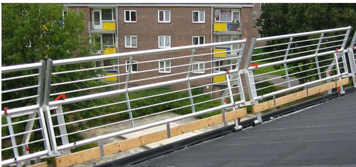
Bild 5, Exempel på hur ett fallskydd kan se ut