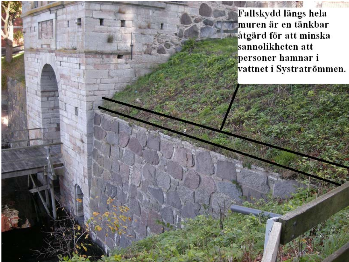
Bild 4, Ett åtgärdsförslag är att montera fallskydd längs muren som kan stoppa upp personer som har ramlat innan de hamnar i vattnet.