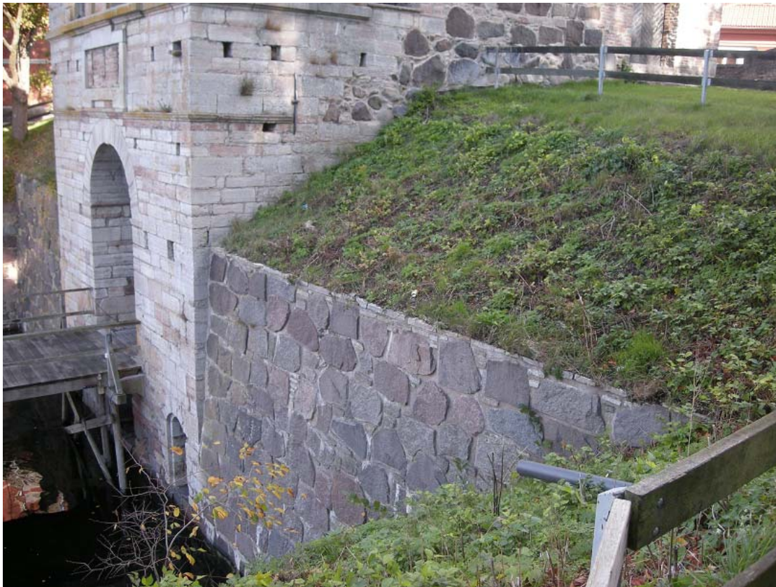
Bild 3, Muren gör det svårt att ta sig upp ur vattnet och leder till ett fritt fall på några meter vilket innebär stor skaderisk.

På flera platser längs Systraströmmen är det mycket svårt att ta sig upp från vattnet. Detta då de sista metrarna ner i vattnet utgörs av en mur, se bild nedan.