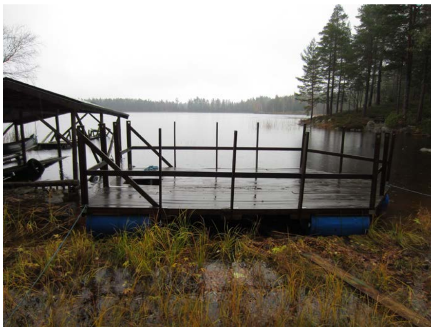
Bild 1.Badflotten som användes i olyckan.