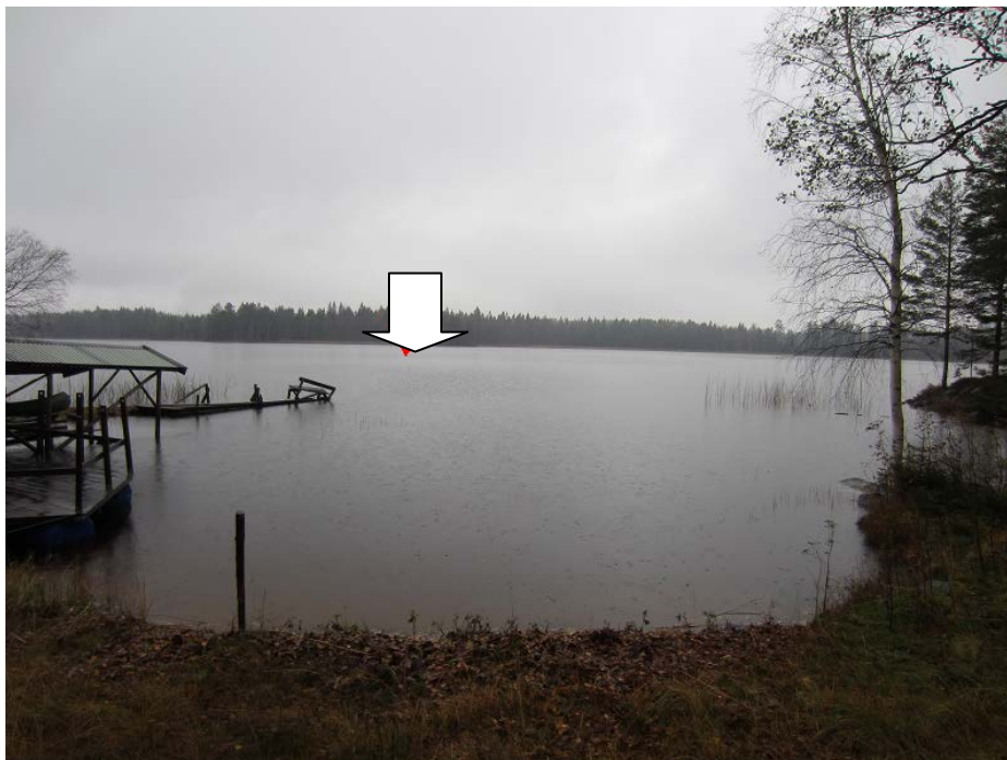
Bild 3. Pilen markerar ungefärlig olycksplats.

Mannen och hans fru är ute med sin badflotte , motorn stannar och de börjar driva ut från land. Då bestämmer sig mannen för att hoppa i vattnet och dra in flotten mot land, han trasslar då in sig i ett rep som sitter fast i flotten. Hans fru hoppar i och försöker hjälpa honom men lyckas inte, hon larmar då SOS.