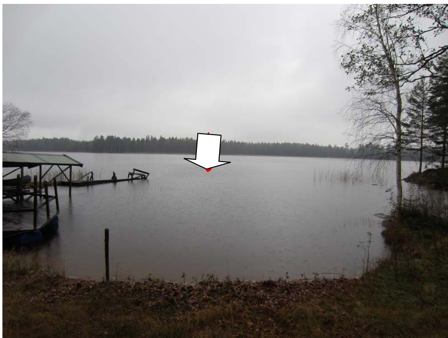
Bild 4. Pilen markerar var den drunknade mannen hittades.