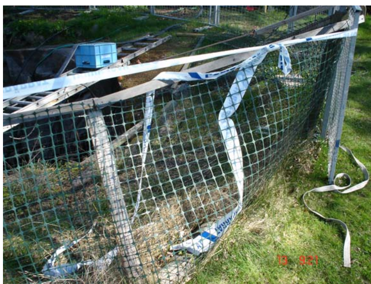
Bild 3: Staketet var inte helt intakt, utan hade små glipor och lagningar.

Hur pojken hamnat i vattnet är osäkert. Troligt är att han krupit igenom en liten öppning i staketet eller att han försökt klättra över staketet och tappat greppet och fallit ner i dammen.