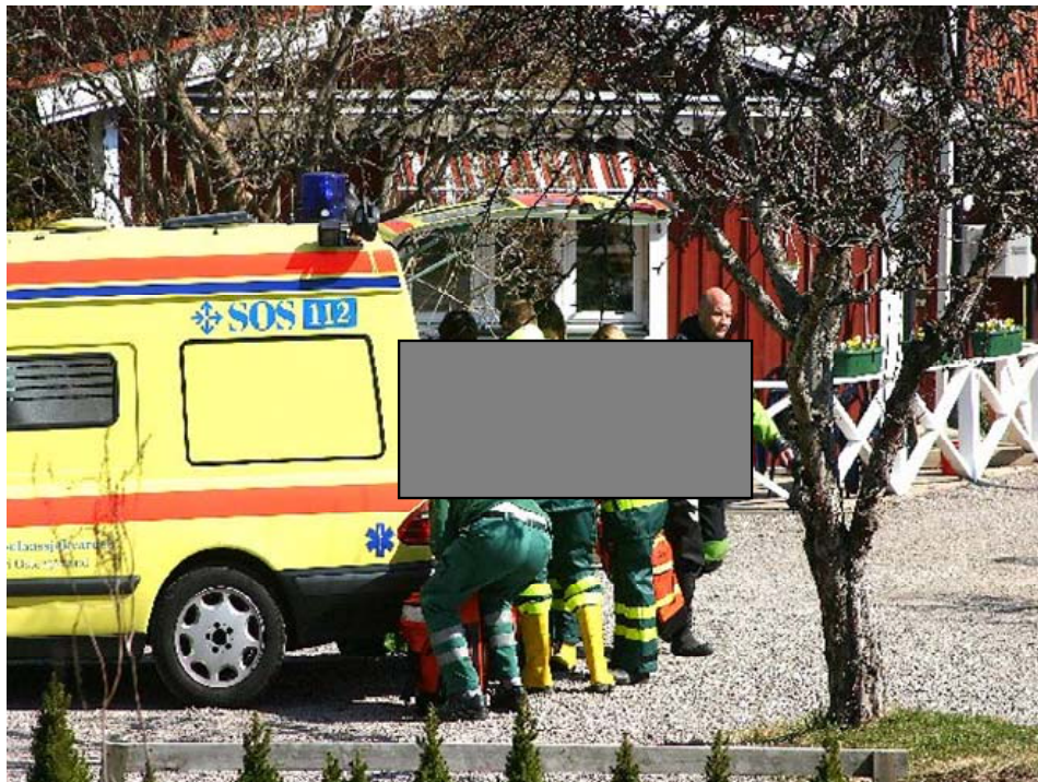
Bild 6: Sjukvårdsgruppen vårdar pojken på plats innan de för honom till ViN.

Pojken överlämnas till dyk S som lämnar över till föraren av bil 105 och ambulanspersonal som direkt påbörjar återupplivning. Pojken förs till ambulans 912 där en sjukvårdsgrupp ansluter.