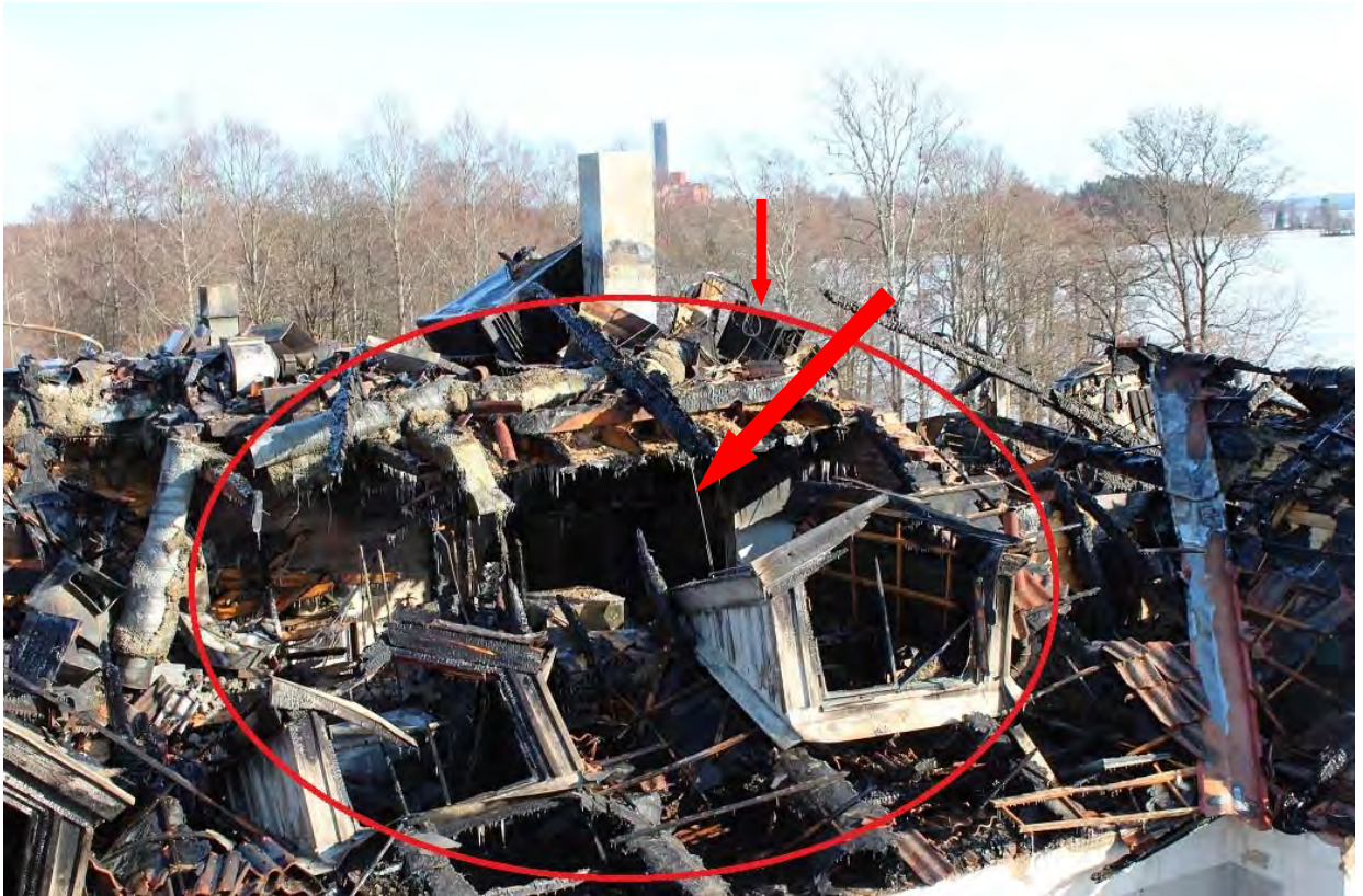
Stora pilen visar kökets placering, lilla pilen visar värmefläktens placering.