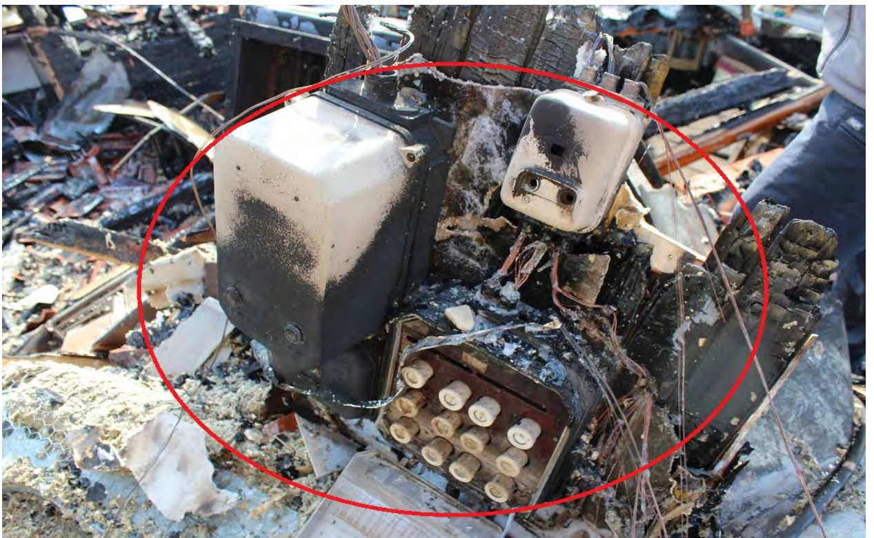
Elcentralen på vinden, samtliga säkringar har utlöst i centralen.