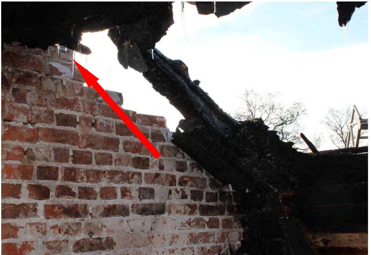
Bilden är tagen inifrån köket, mot väster. Här kom röken ner från taklisten.