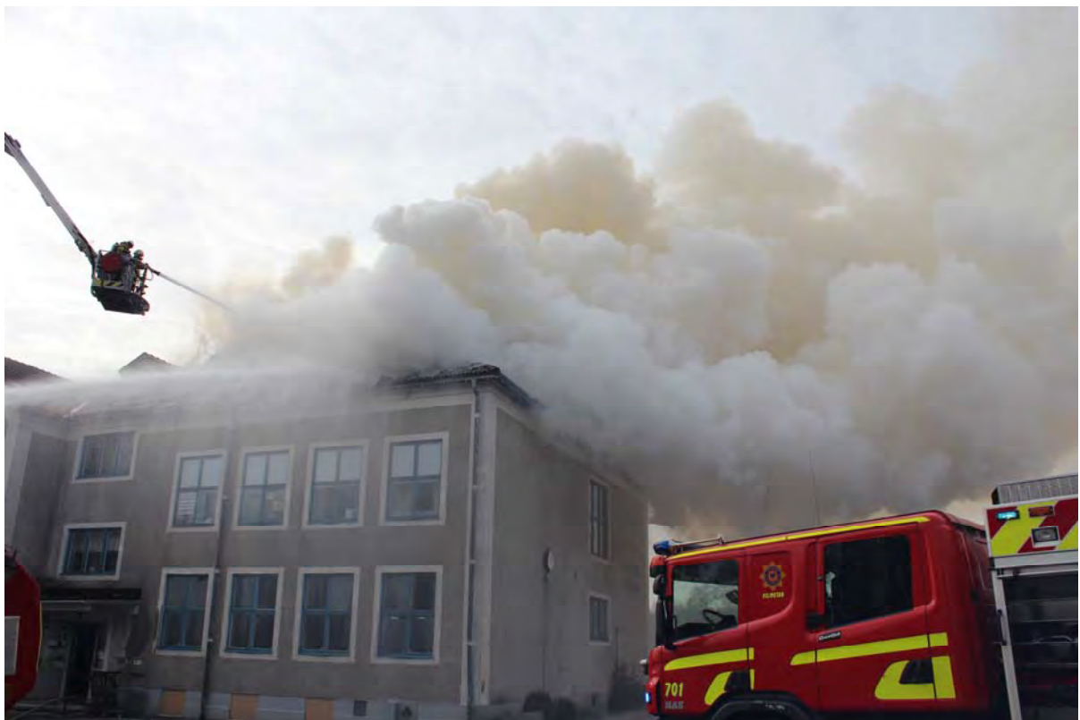
Mycket av släckningsarbetet pågick via höjdfordon när branden gick igenom takkonstruktionen.