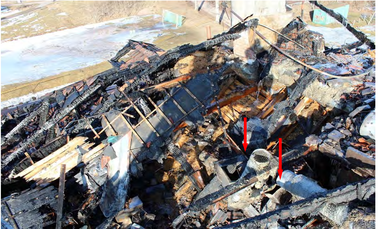
Ventilationsröret som kommer från värmeflärkten, en ner vidare till lektionsalarna.