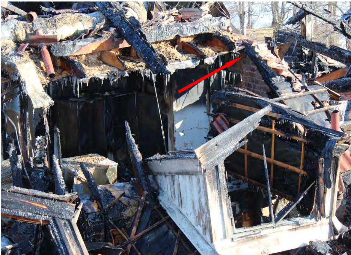
Bild från köket, pilen visar vart röken kom fram under taklisten.