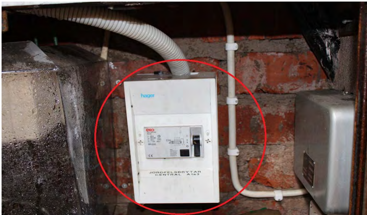
Jordfelsbrytare till matningen på vinden har utlöst.