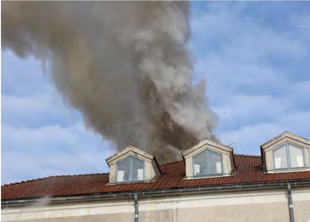
Bild från västra sidan av byggnaden.