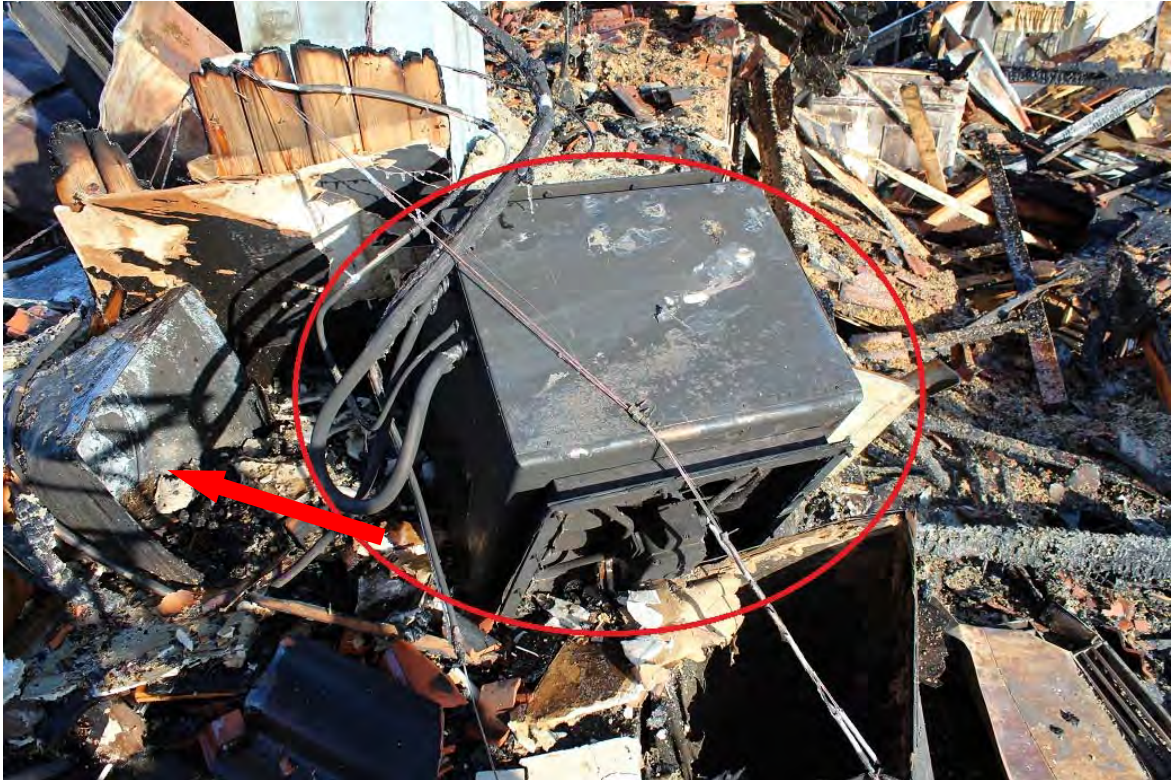
Värmefläkten inringad samt ventilationsröret (pil) som var monterat på värmefläkten.