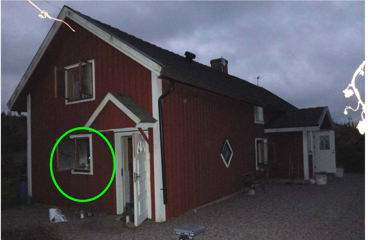
Tvättmaskinen var placerad till vänster innanför dörren (inringat) innan den lyftes ut. Hela villan rökfylld.