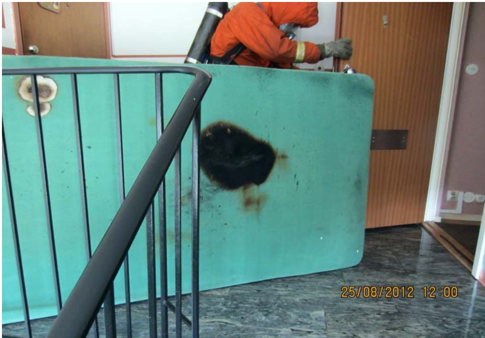
Sängmadrass som lämpades ut från lägenheten. Gamla brännmärken upp i vänstra hörnet.