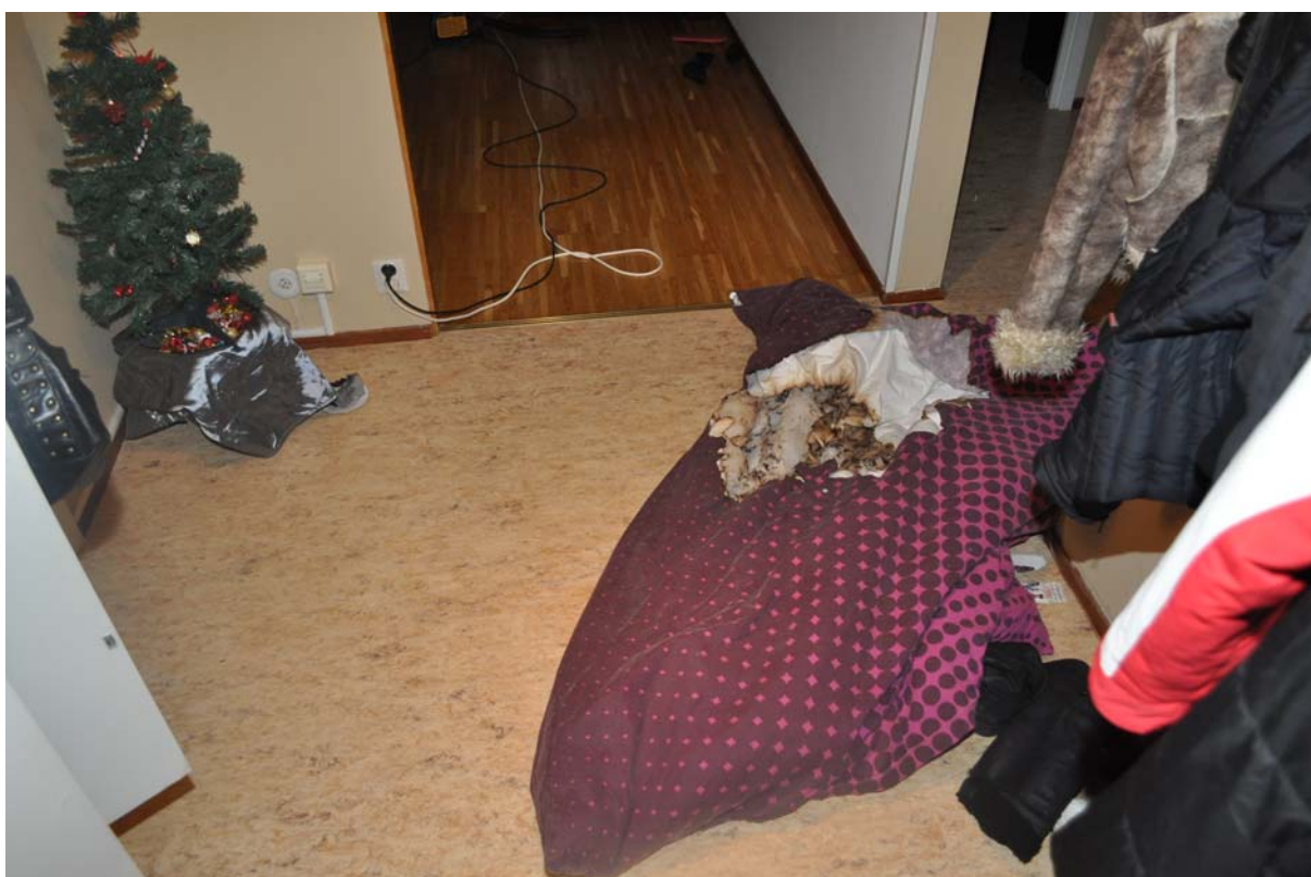
Täcket som brunnit där rökdykaren hittar det