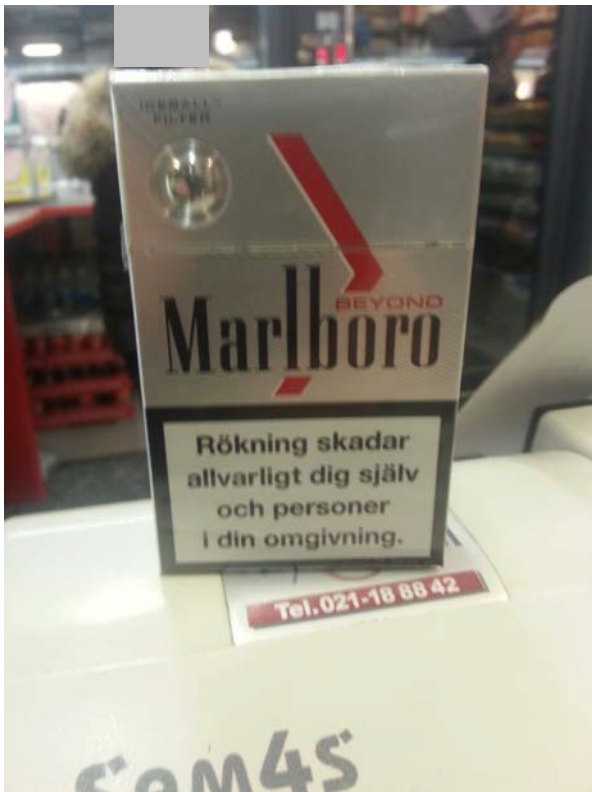
De aktuella cigaretterna