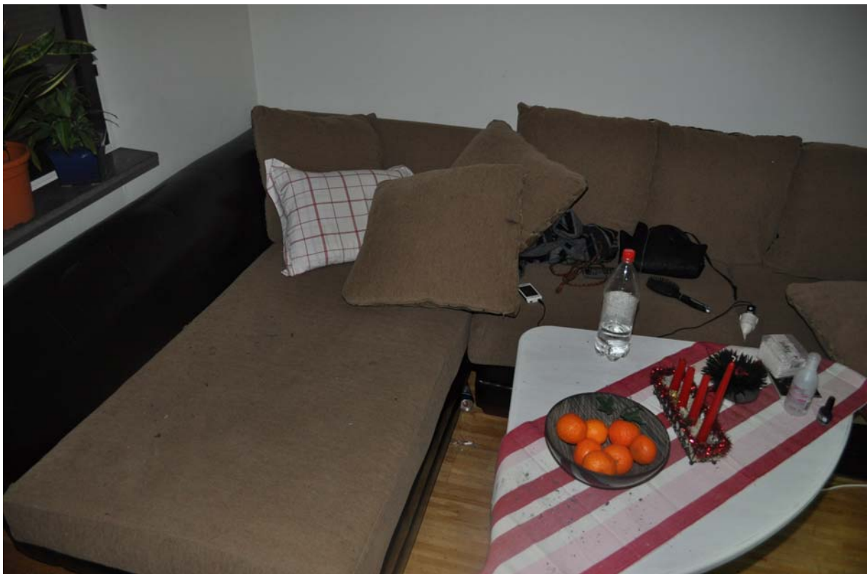
Soffan där kvinnan sov med rester av fimpen på golvet framför