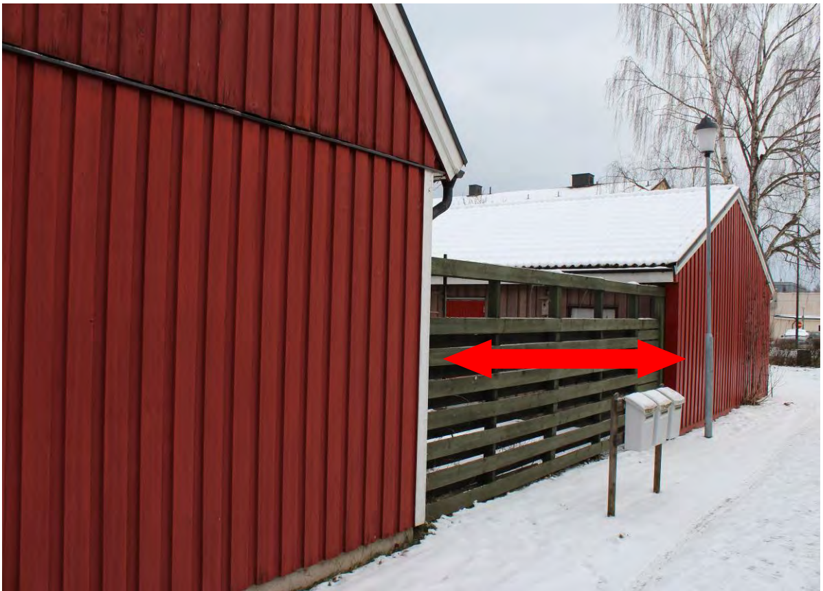
Bild 14 6,50 m. mellan Radhuslängan och garagelängan.