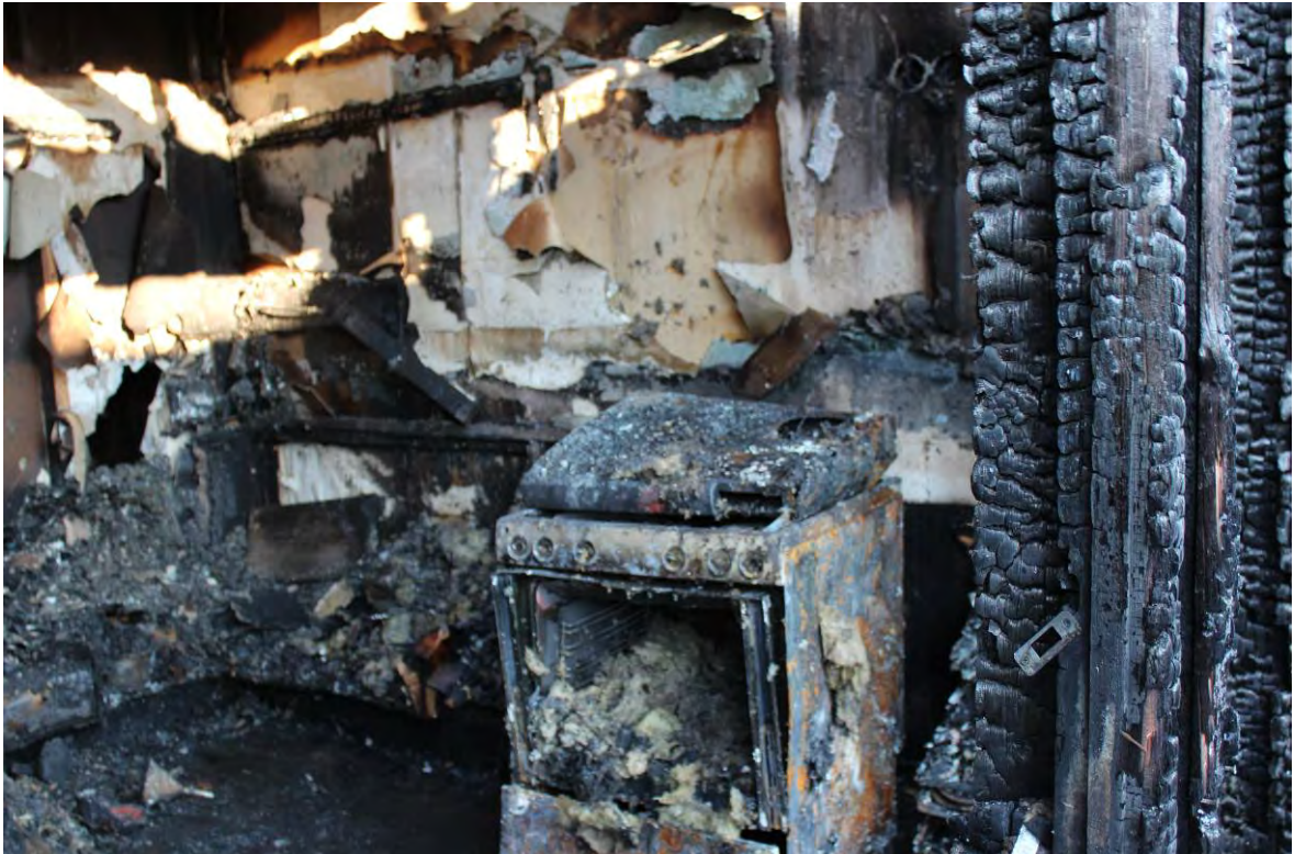
Bild 9. Brandens startföremål Spisen.