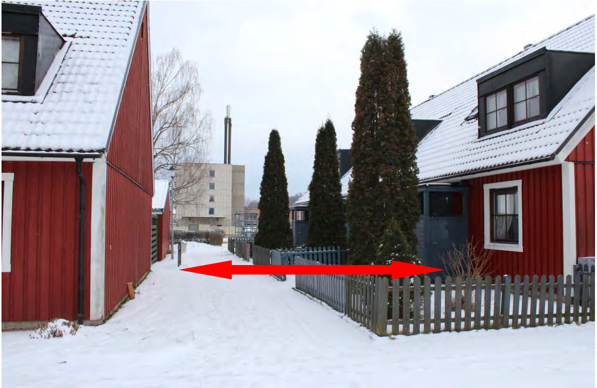
Bild 13. 6,50 m. mellan radhuslängorna.