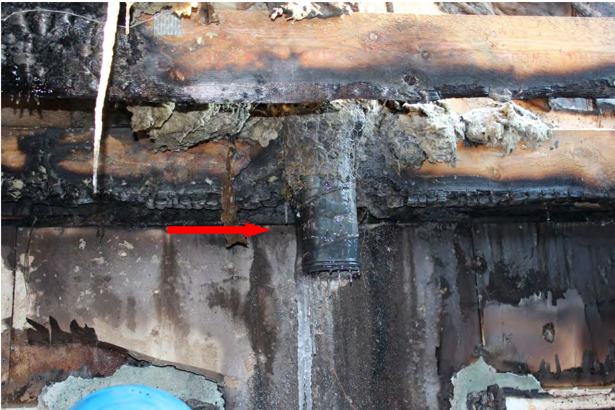
Bild 12. Utsugsrör till köksfläkten.