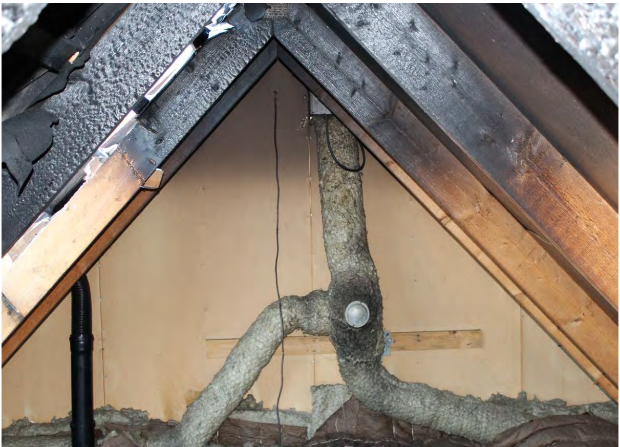
Bild 8. Här är brandsektioneringen intakt efter att vinden har fyllts med mellanskum.