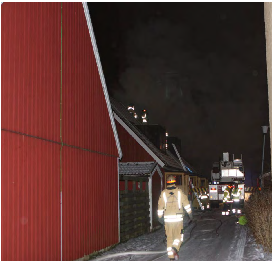
Bild 2. Håltagning pågår för att få ut de heta brandgaserna på vinden.