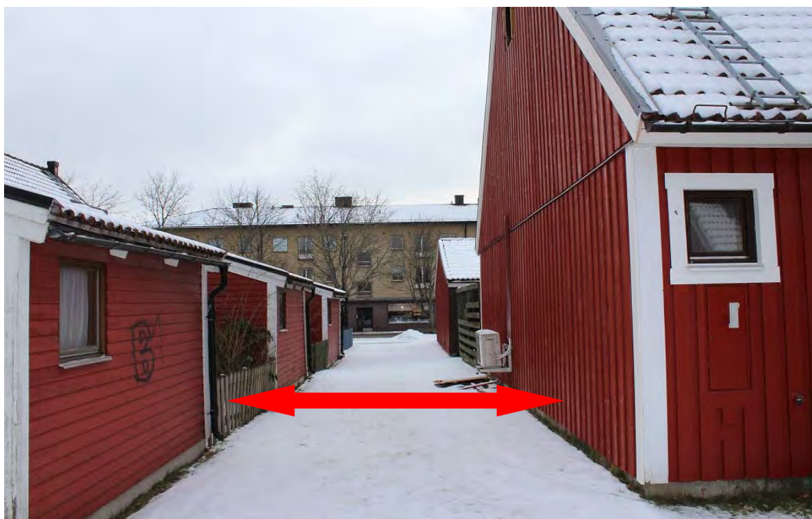
Bild 15. 4,0 m. mellan förråd och garagelänga.