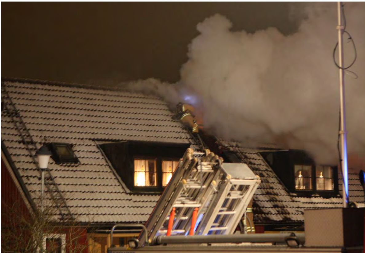
Bild 4. Man kan tydligt se på röken att skumfyllningen börjar ge resultat.