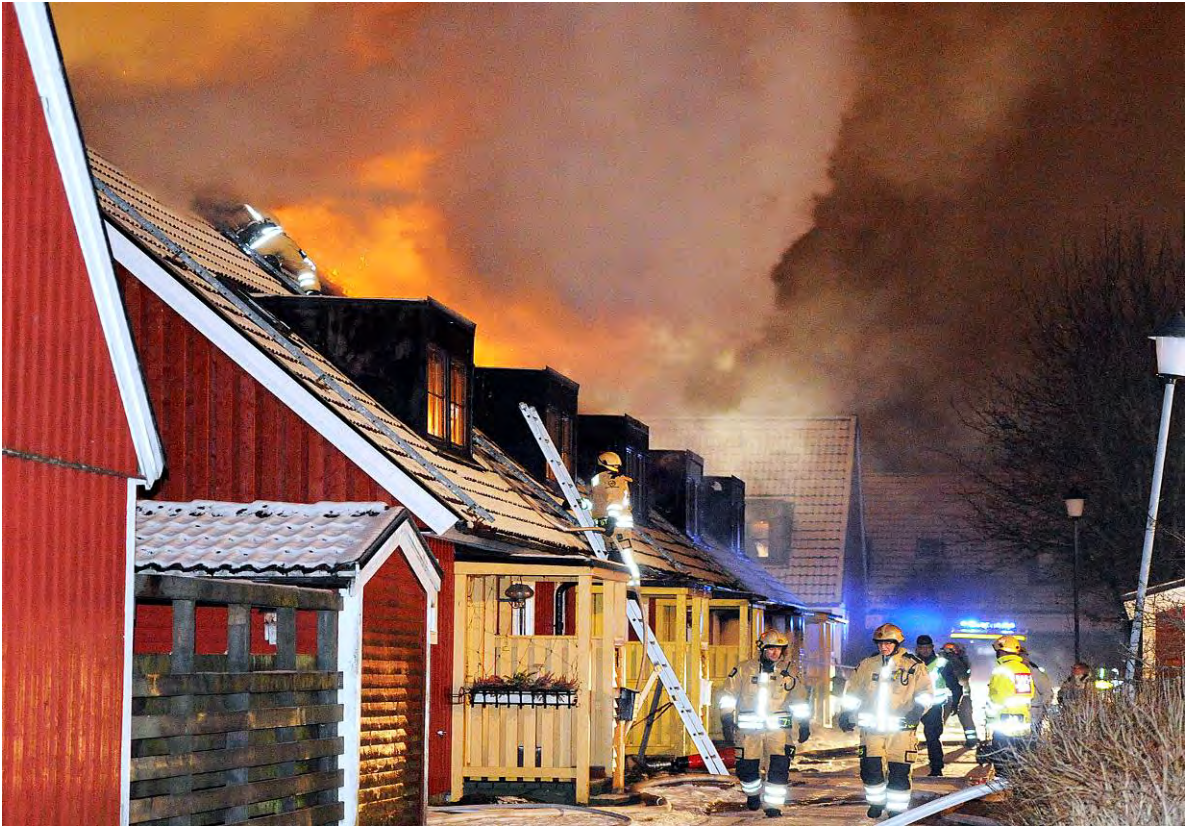
Bild 3. Skumfyllning av vindsvåningen pågår från båda ändarna av radhuslängan.