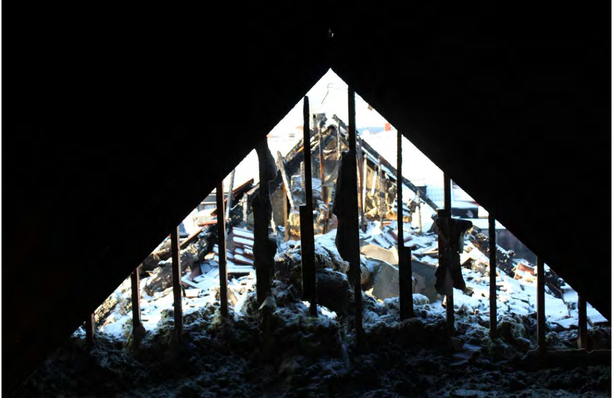
Bild 7. Här ses tydliga tecken på hur brandsektioneringen ej har stått emot branden.