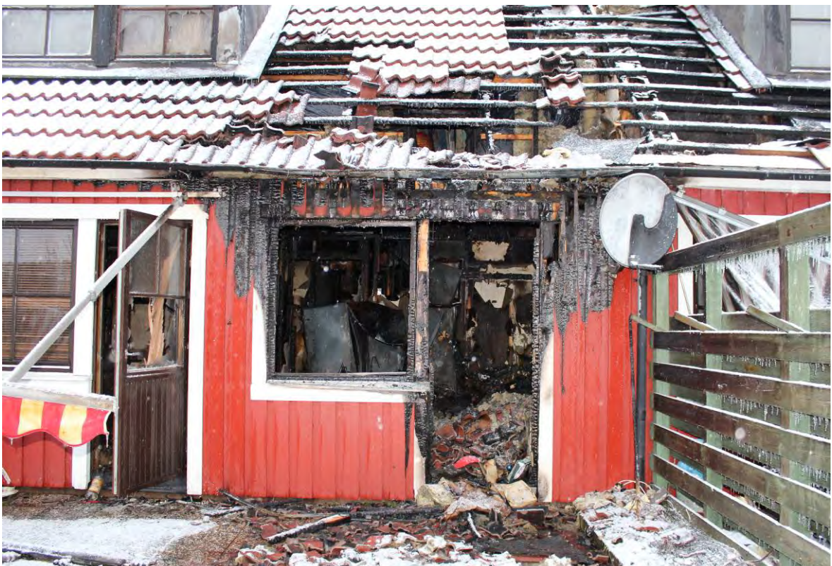
Bild 6. Brandens startutrymme är köket på innergården.