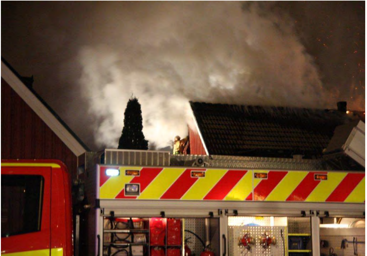
Bild 5. Skumfyllning (mellanskum) från den västra gaveln på radhuslängan.