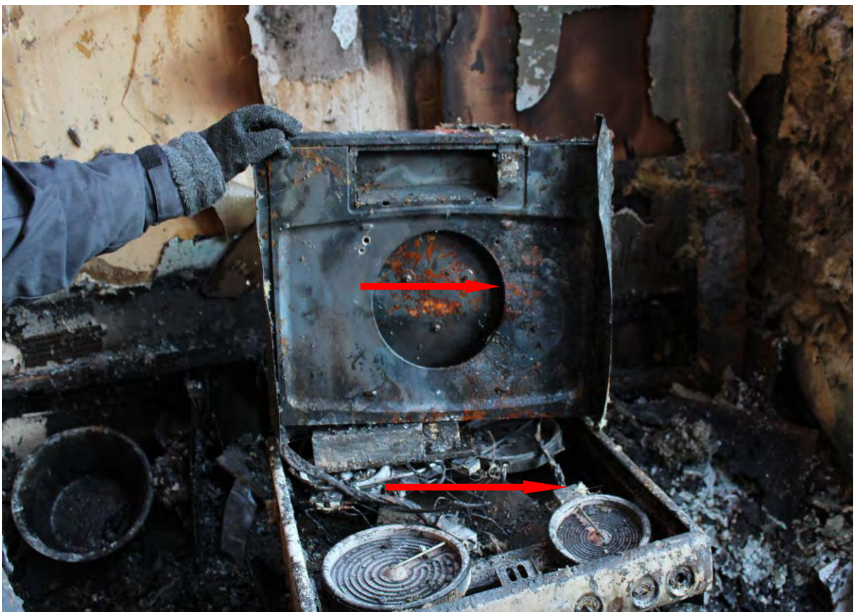
Bild 10. Här kan man se tydliga tecken på hur spisplattan är värmeskadad samt att spisfläkten har värmeskador på samma sida.