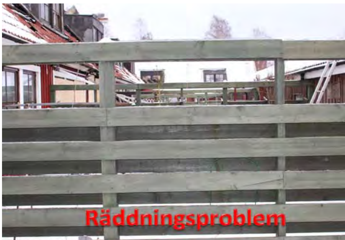
Bild 16. Inngårdar som måste sågas upp för att komma åt släckning.