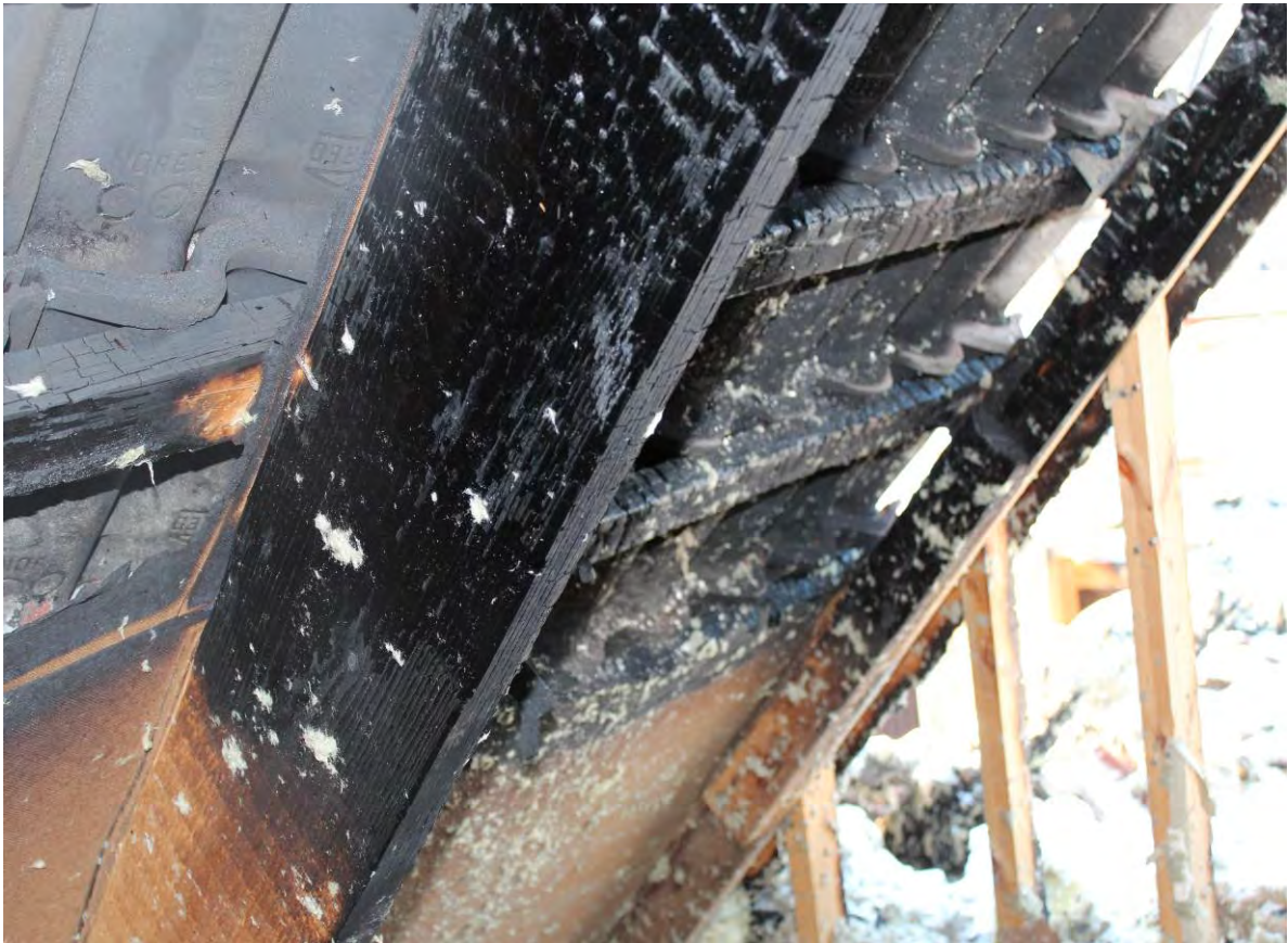
Bild 17. Brandspridning via takfot, läckt samt masonitskivor upp på vindsvåningen.