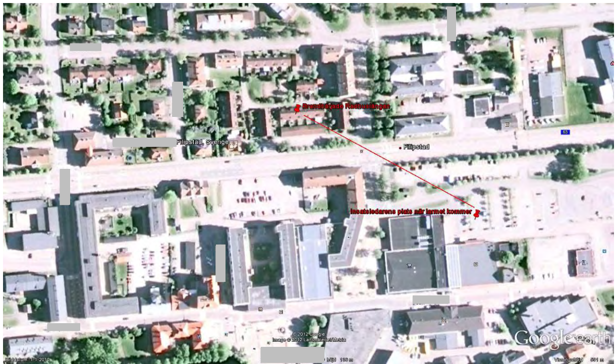
Bild 1. Insatsledarens plats när han får medhörning på larmet, är endast 175 meter från brandplatsen. När han är vid bilen ser han lågor slår ut mellan radhuslängan och garagelängan.