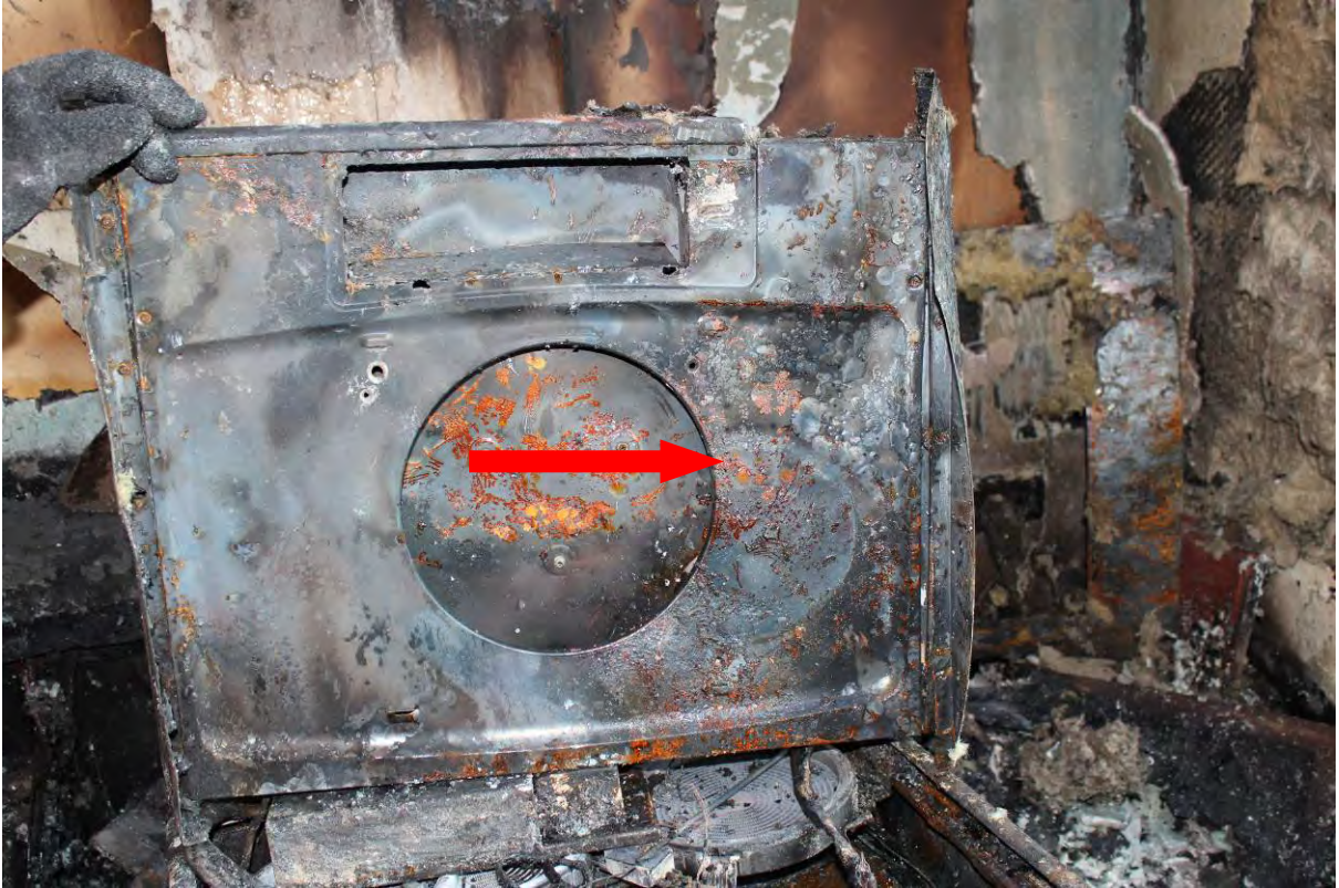
Bild 11. Spiskåpan är hårt bränd på höger sida.