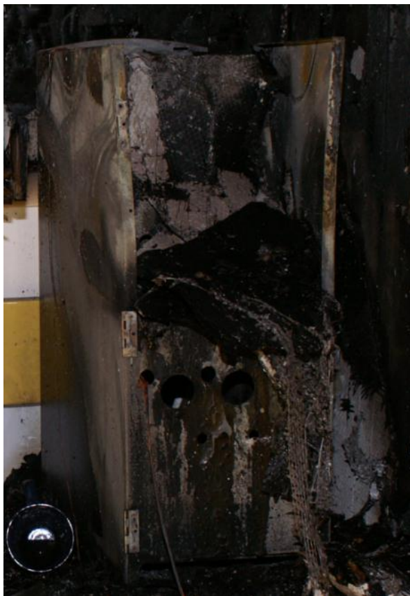
Kaffemaskinen vid pentryt.