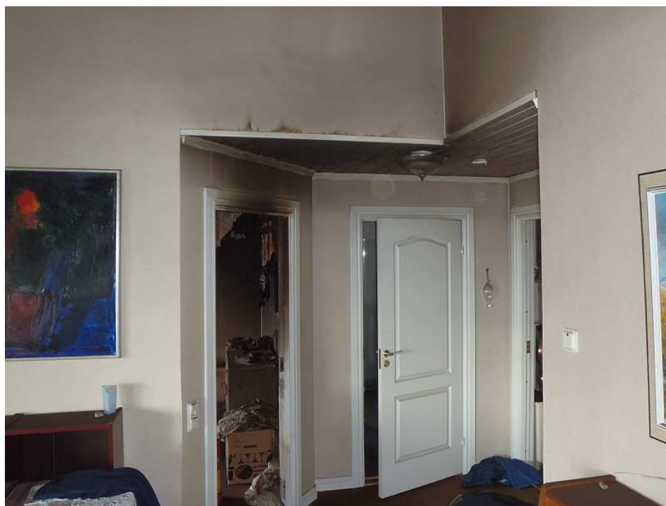
Bild 2. Sovrumsdörr till vänster, toalett rakt fram