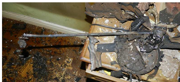
Bild 8. sänglampan

← Bild 9. Klädhängaren som varit varm när kvinnan har stängt dörren till brandrummet.