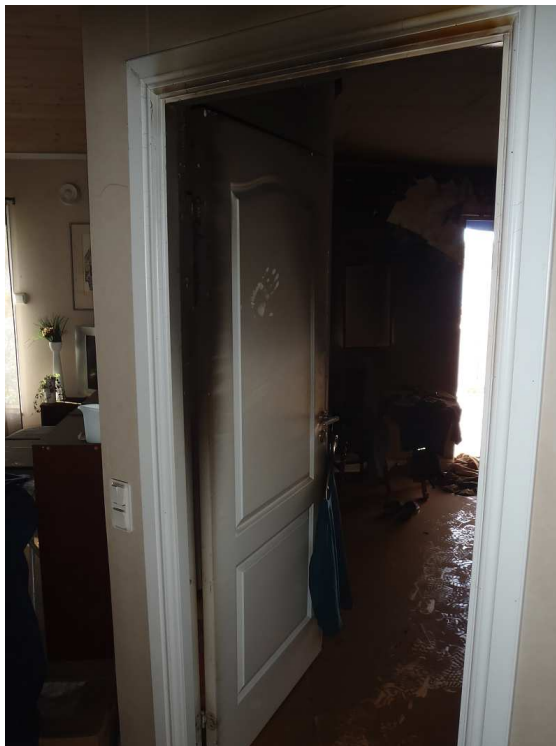
Bild 3. Sovrumsdörren.