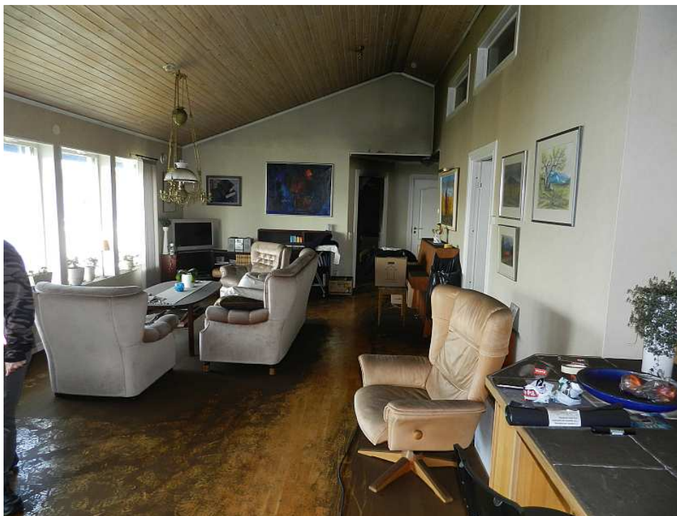
Bild 1. Vardagsrum, vy mot sovrum och toalett