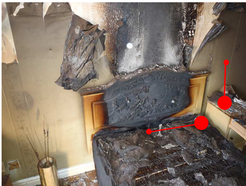
Bild 7. Tidigare placering på lampan, och placeringen sedan den ramlat i sängen.

Avdelning, handläggare, tfn, e-post Räddningstjänsten Håkan Wikman 0660-787 50 hakan.wikman@ornskoldsvik.se