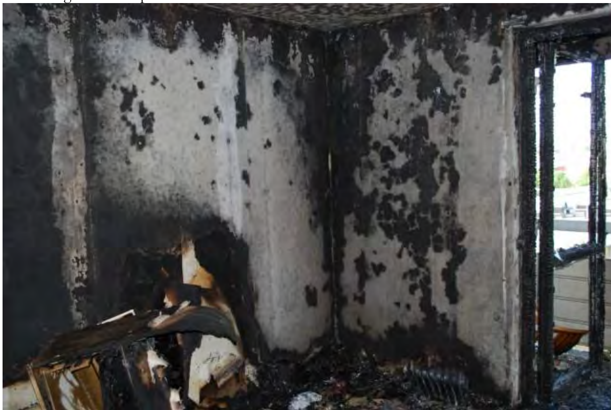
Bild 4. Lägenhet nr 1 på 5 vån. Balkongen.