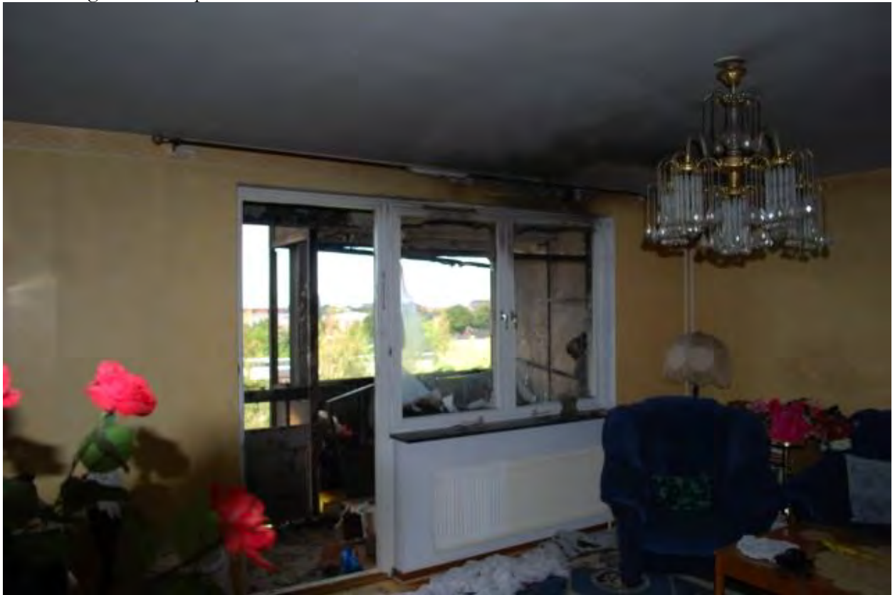
Bild 6. Lägenhet nr 2 på 6 vån, balkongen