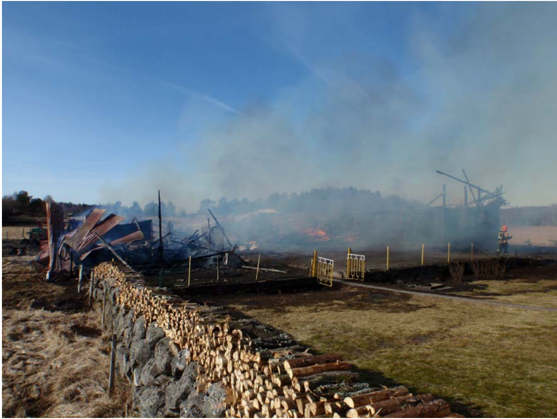
Vy från huset mot resterna av ladugården.