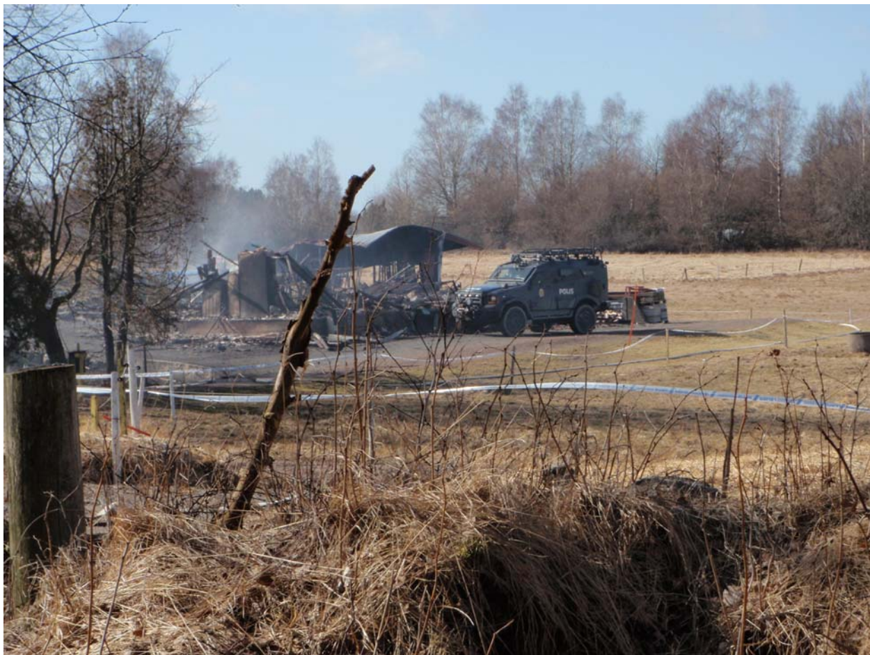
Polisens insatsfordon lokaliserar gasflaskorna.