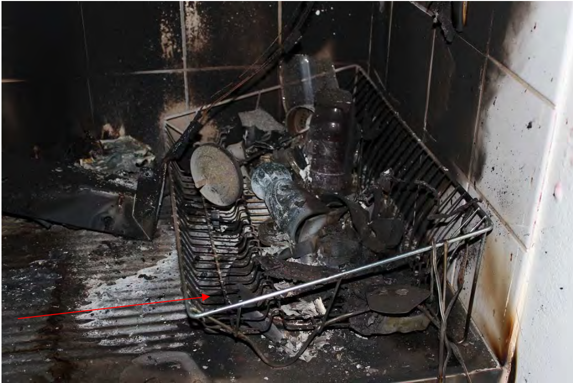
Bild 5. Diskställ på spisplattor