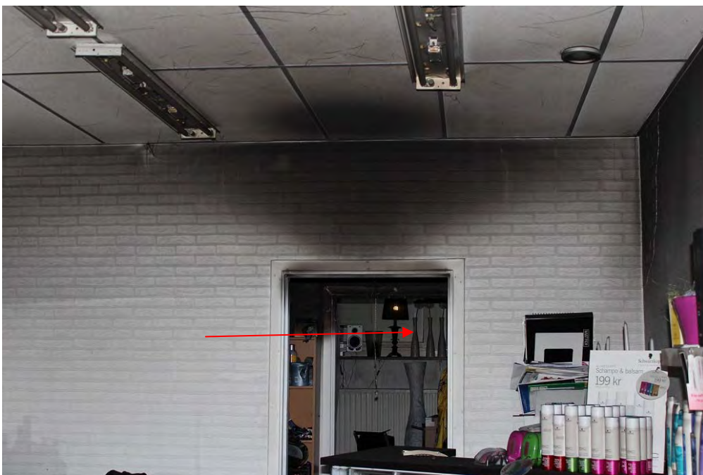
Bild 2. Salongen