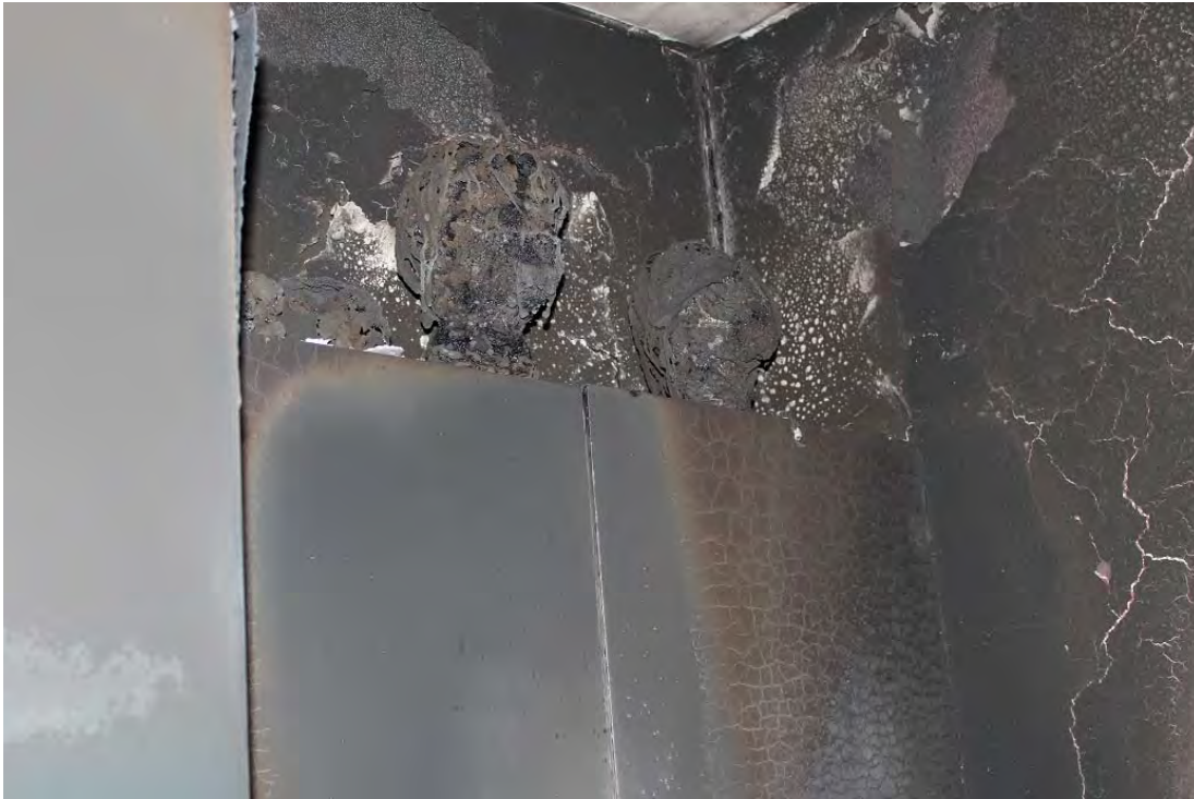
Bild 7. Ovanför spisplattorna, kraftigt krokodilmönster på skåpdörr