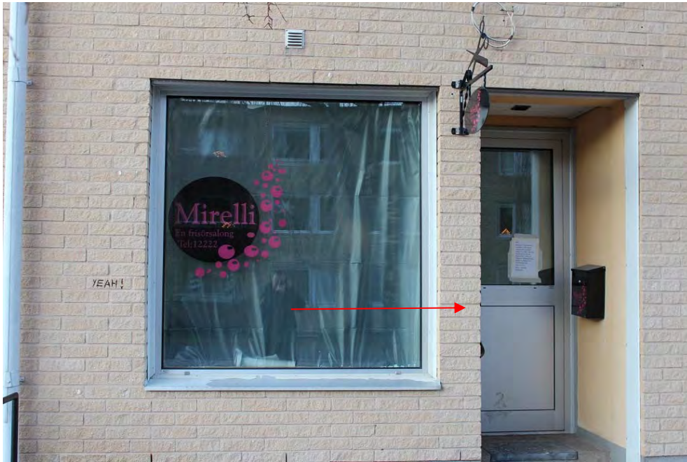
Bild 1. Entren