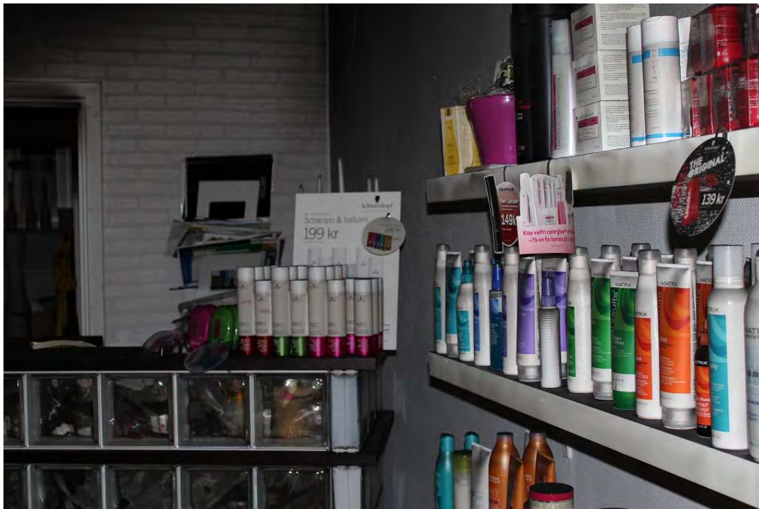
Bild 3. Salongen