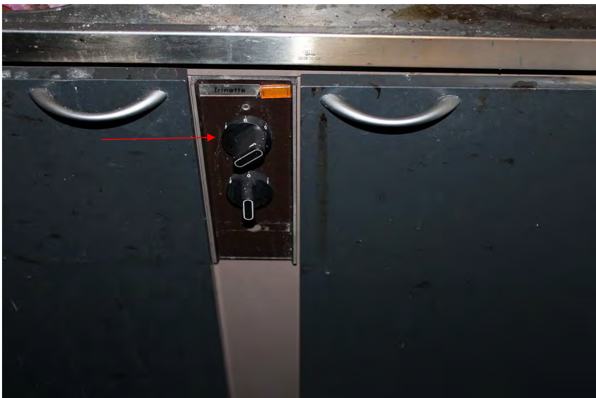
Bild 6. Trinettköket, vredet står på sexans läge