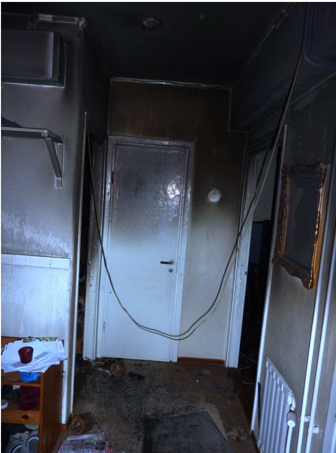
Bild 3. Hallen i lägenheten där den avlidne påträffades. Dörren till sovrummet ligger längst bort i bilden till höger. Rakt fram kan man se toalettdörren. Ingången till vänster längst bort i bild går till vardagsrummet.