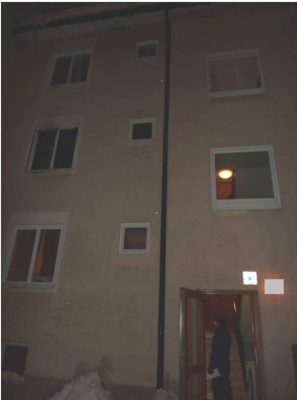
Bild 1. Flerfamiljshuset. Den branddrabbade lägenheten ligger på våning 2, till vänster i bild