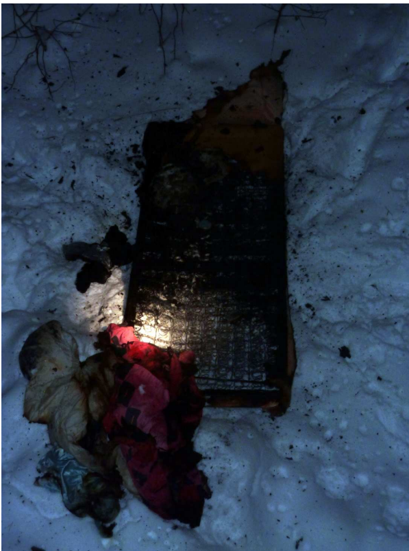
Bild 2. Del av branddrabbad säng som kastades ut på baksidan av huset, via balkongen.