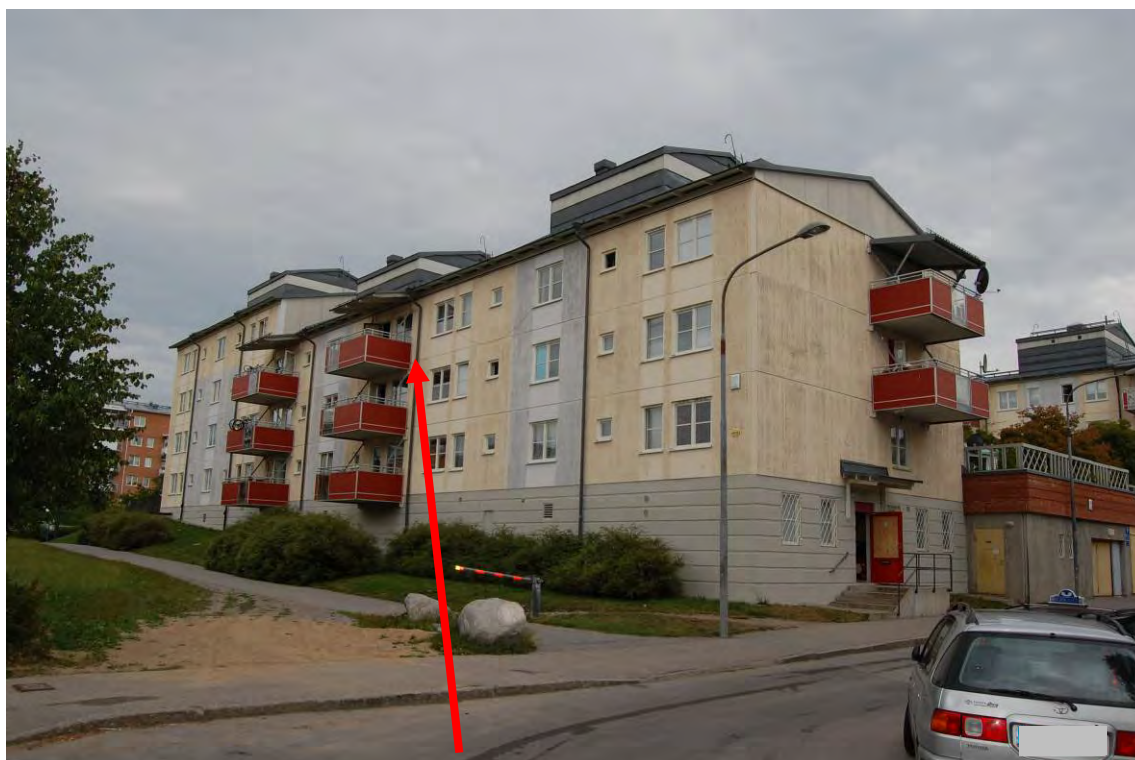
Huset från baksidan, brandlägenheten ligger på det översta våningsplanet