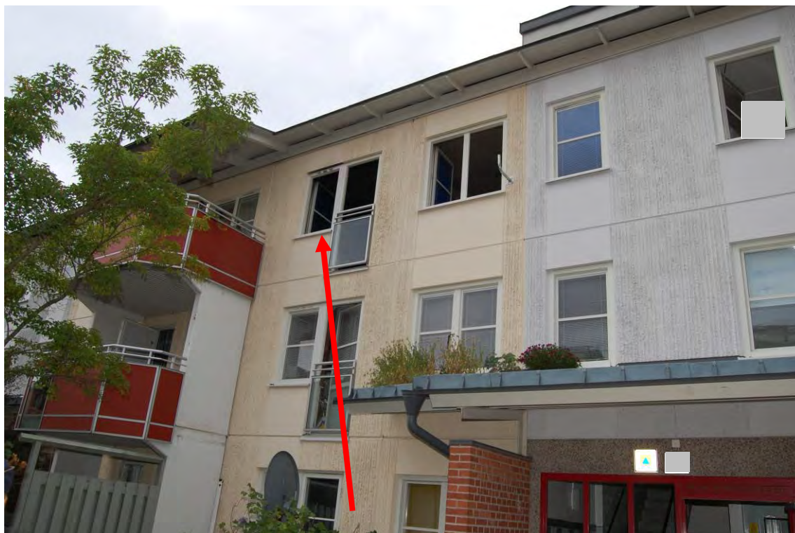
Brandlägenhetens sovrumsfönster och den utskjutande takfoten