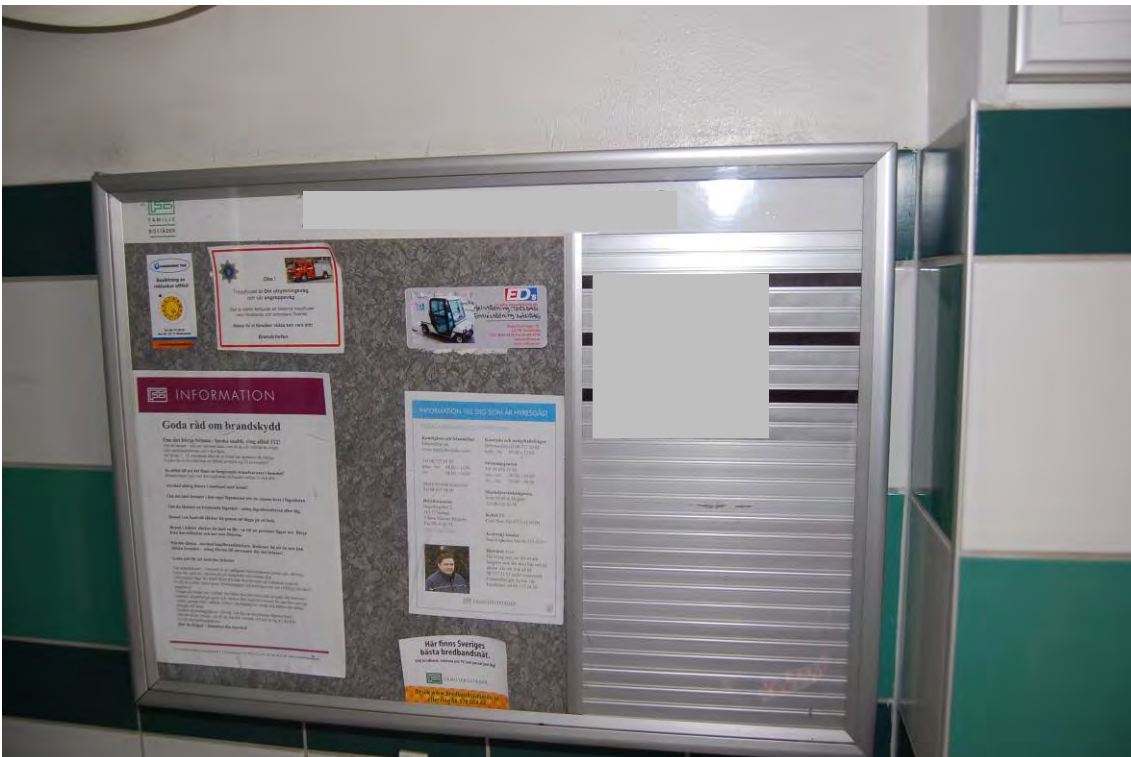
Informationstavlan i porten