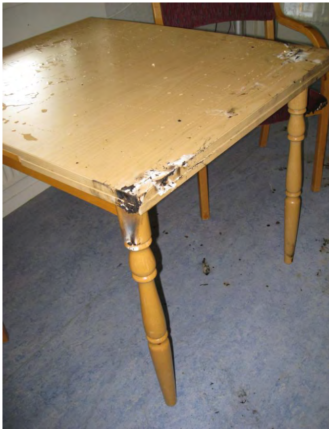
Bild 5 Brännmärken på bord i TV-rum.

Pipan som mannen tappade när han reste sig i TV-rummet