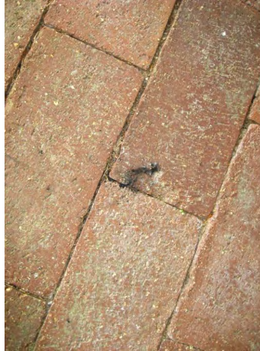
Bild 2 Plattor på altan

Brandskador på höger sida av stolen som mannen satt i när personalen frågade honom om han skulle lägga sig