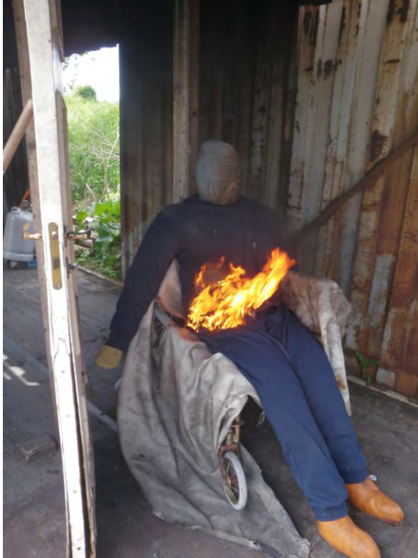
Bild 9 Brand efter 130 sekunder