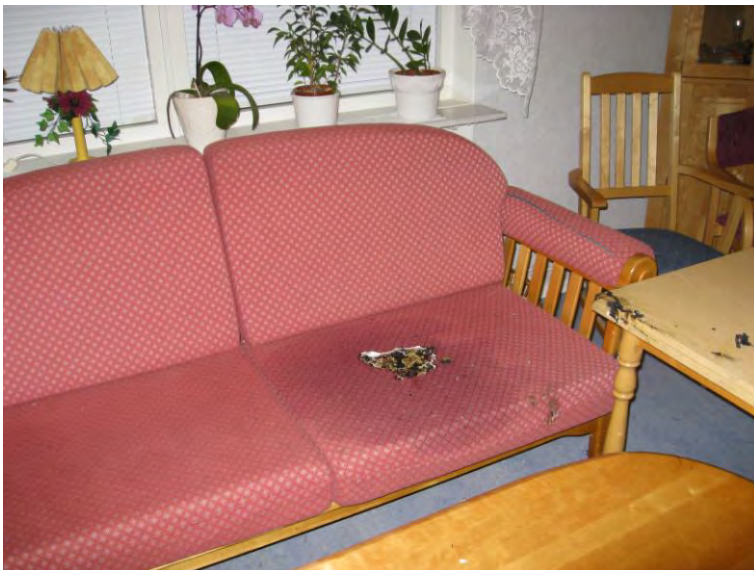
Bild 3 Brandskada i soffa Soffan där mannen satt när branden tilltog.

Rester av bränt fleecetyg. Tyget är ”fastsmält” i cementplatta