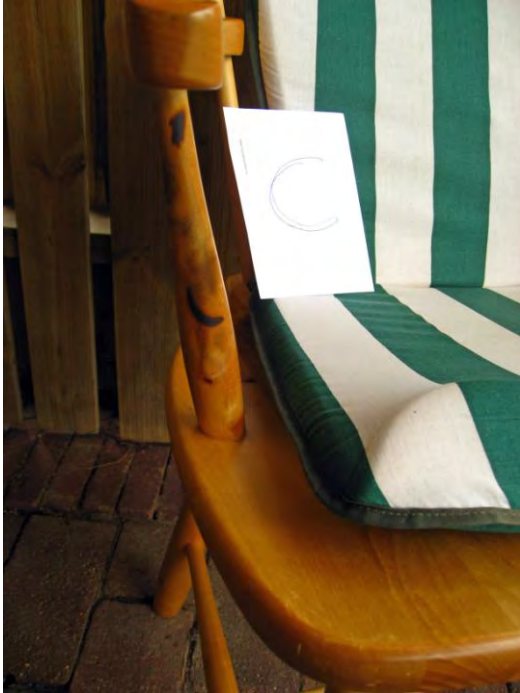
Bild 1 Stol på altan

Brandskador på höger sida av stolen som mannen satt i när personalen frågade honom om han skulle lägga sig