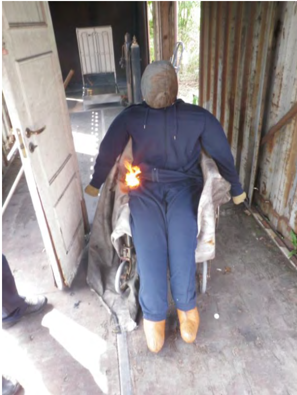
Bild 7 Brand efter 60 sekunder