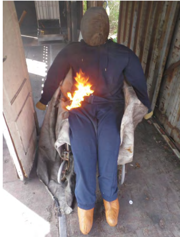
Bild 8 Brand efter 100 sekunder