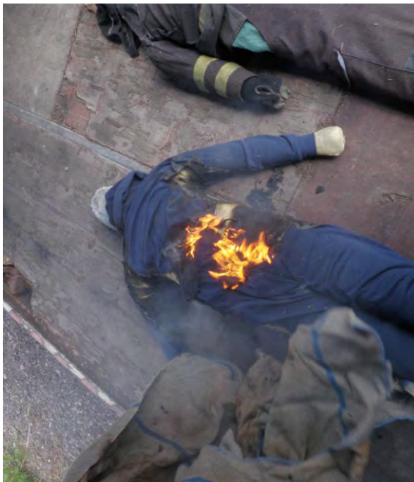
Bild 11 Branden i fleecekläderna var svårsläckt