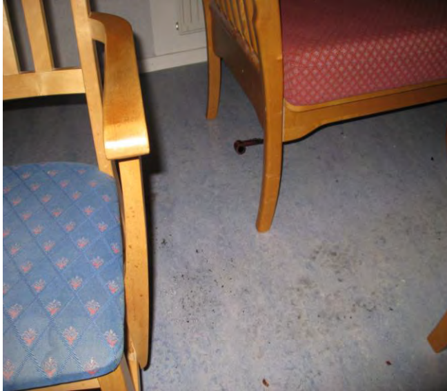
Bild 4 på pipan under soffan där mannen satt.

Pipan som mannen tappade när han reste sig i TV-rummet