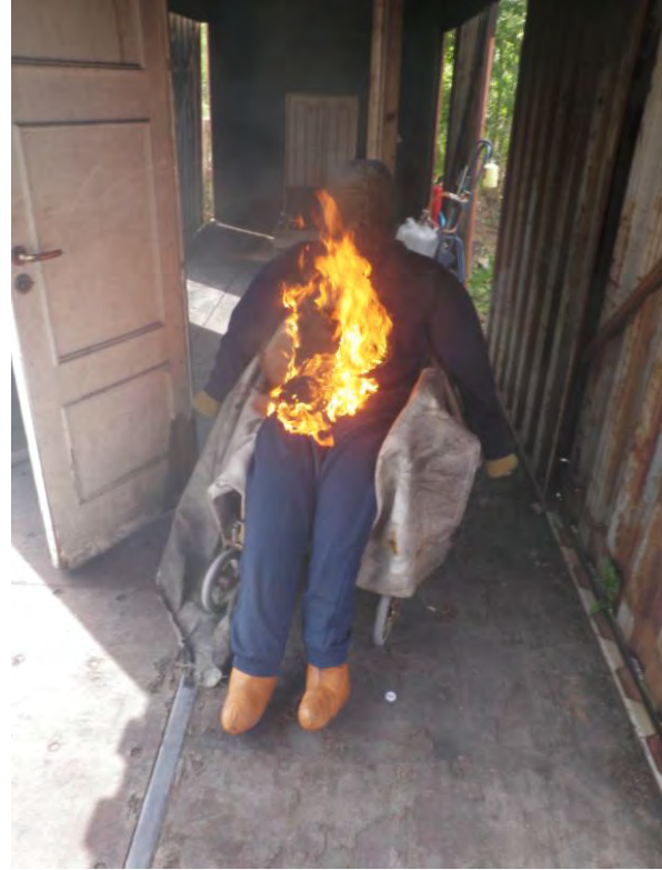
Bild 10 Brand efter 150 sekunder