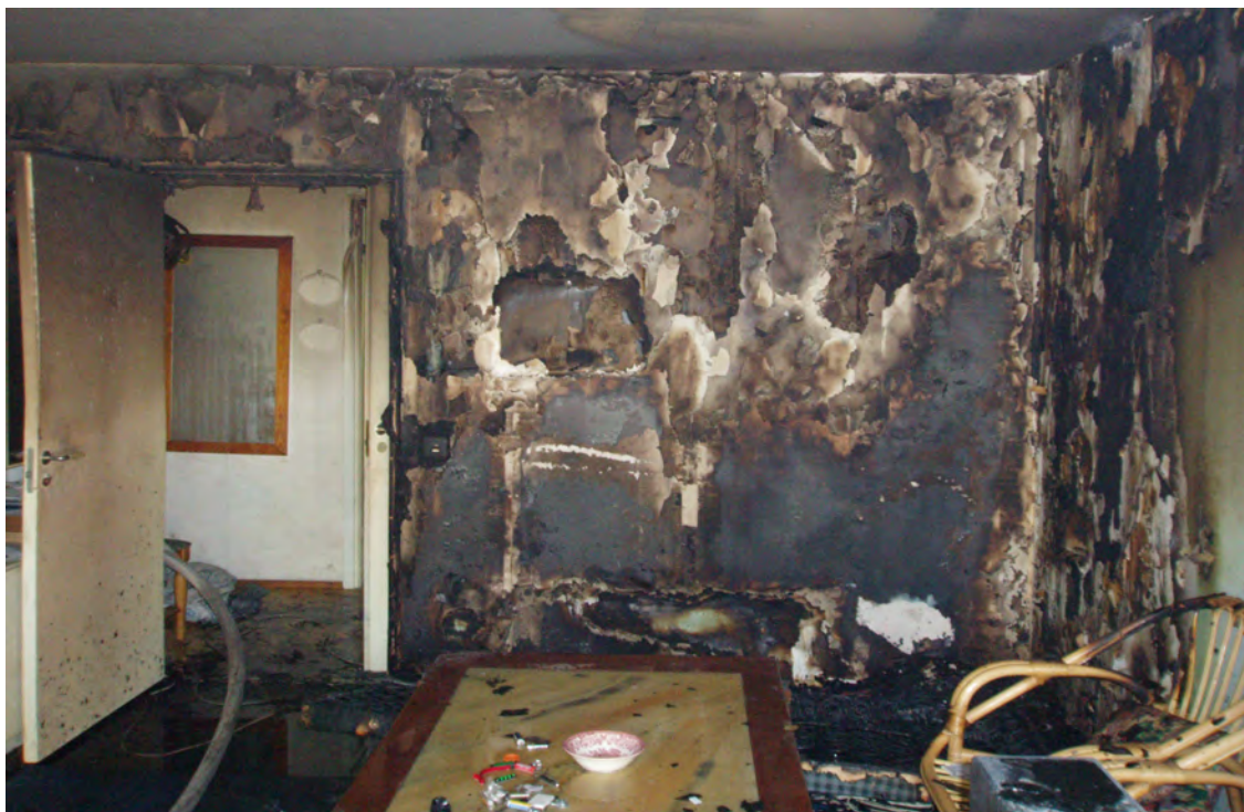
Vardagsrum där sängen stått