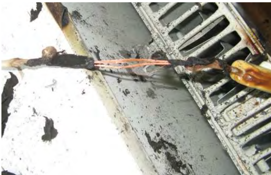
Bild 7. Felfria kopparledningar på lampsladden.