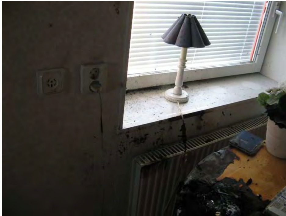
Bild 4. Placering av lampan.