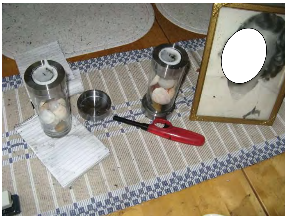
Bild 8. Braständare, värmeljus och foto