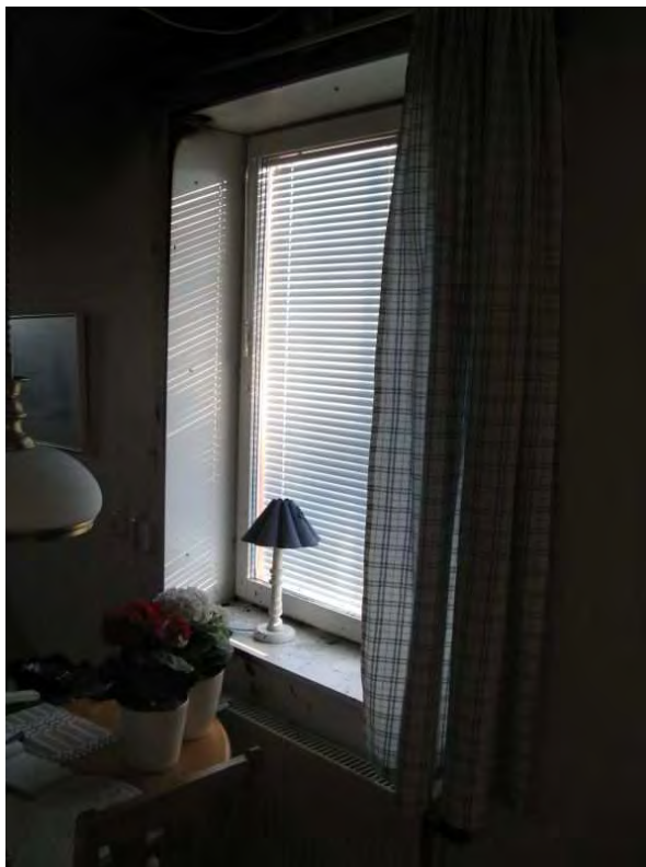
Bild 2. Gardin