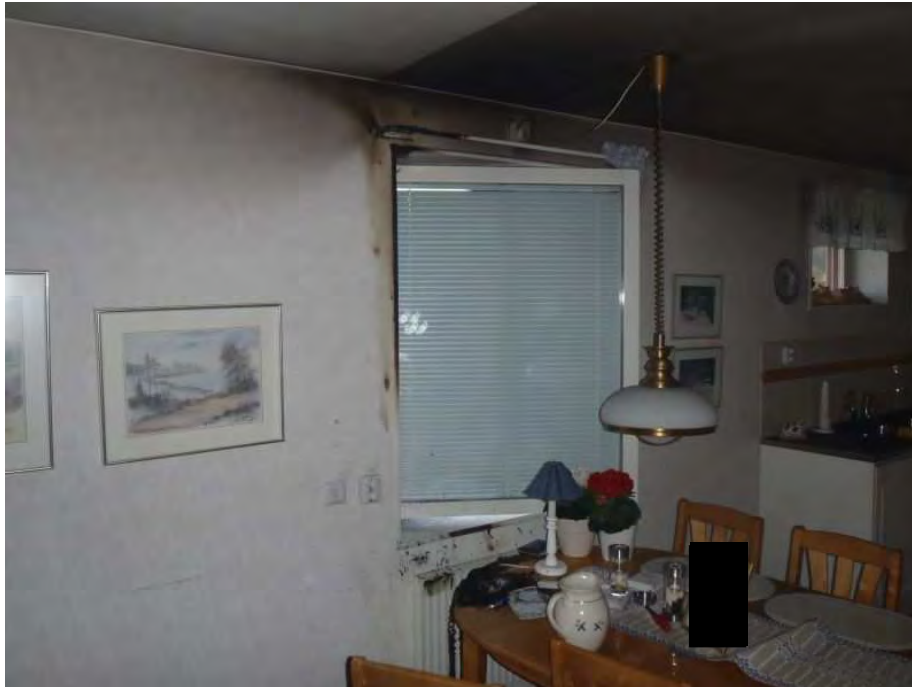
Bild 1. Primärbrandplatsen