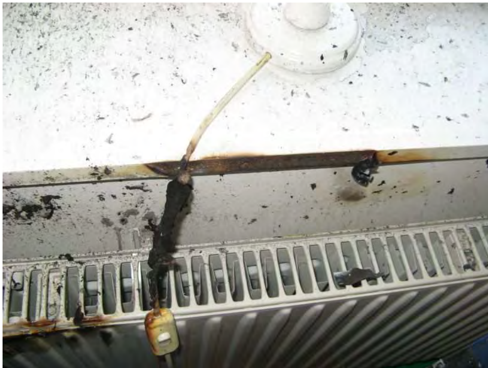
Bild 6. Yttre brandskada.