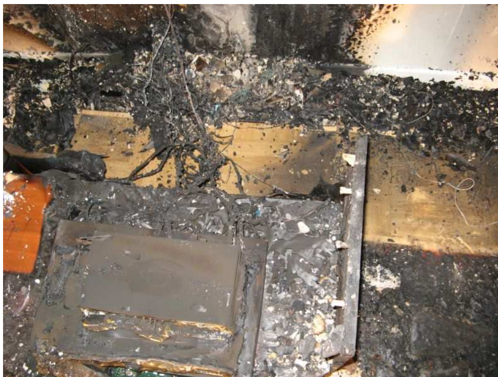
Bild 7. Framdragen tv-bänk