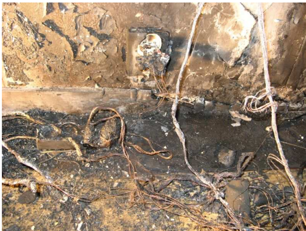
Bild 9. Trolig brandstiftare är grenuttaget