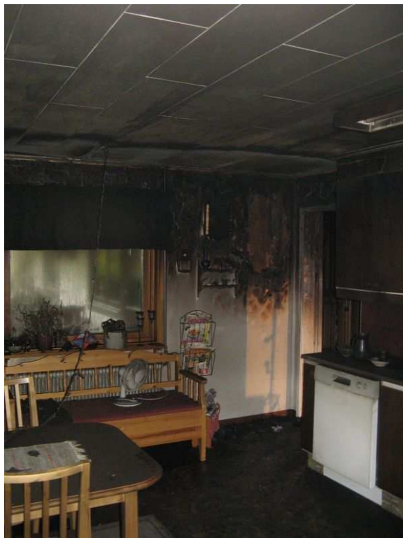
Bild 2. Kök