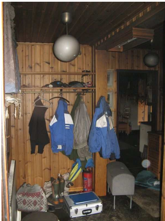
Bild 1. Farstu