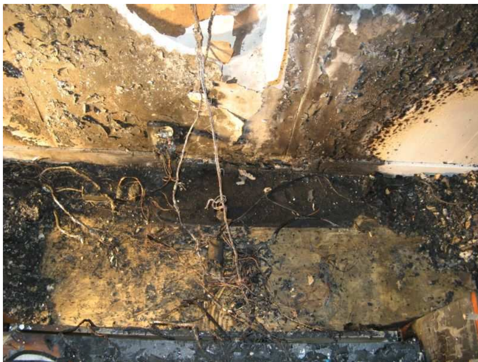
Bild 8. Brand-V bakom tv-bänk