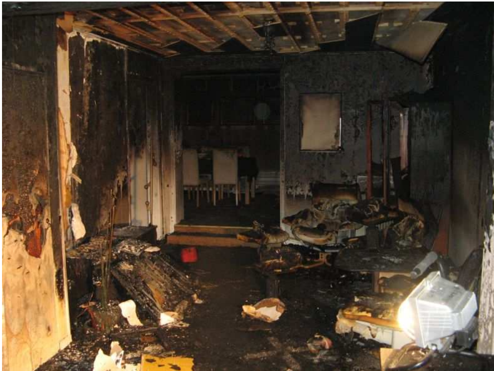
Bild 5. Tv-rum som är primärbrandområde