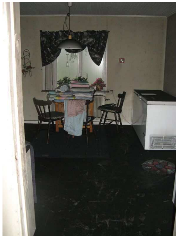
Bild 4. Gammalt kök på övervåning