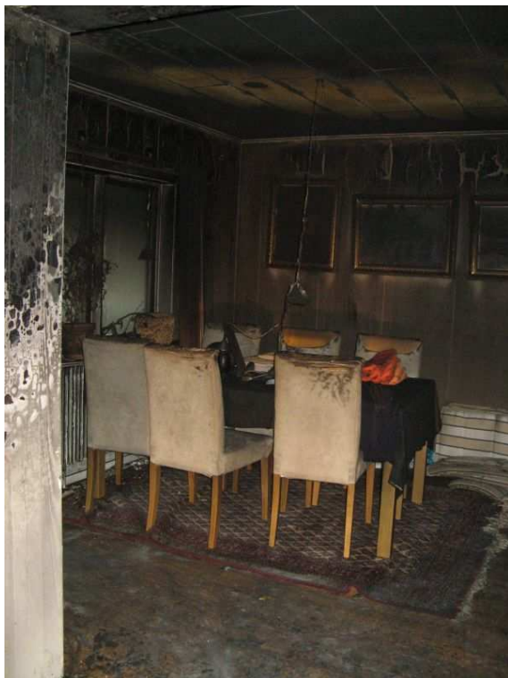
Bild 3. Matplats