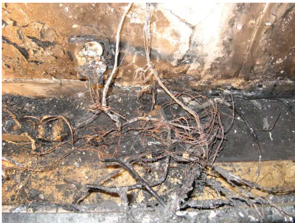
Bild 10. Kabelhärvan bakom tv-bänken