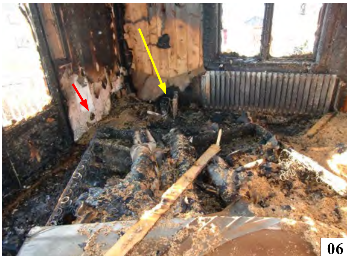
Sängkammarens sydvästra hörnet våning en trappa. Branden har kommit från vinden. Röd pil visar på kontakten som damsugaren är ansluten. Gul pil visat på klimatanläggningen som inte var ansluten.