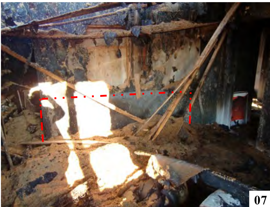
Väggen är skyddad av sänggaveln.