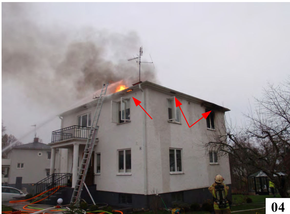
Entrén är åt norr. Branden har brutit genom yttertaket. De röda pilarna visar på ventilationen från vinden.