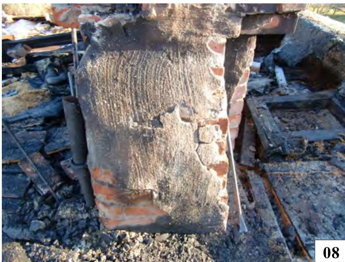
Södra sidan av skorstenen. Vart sprickan på skorstenen finns vet ingen. En del skador är efter brandens värme.