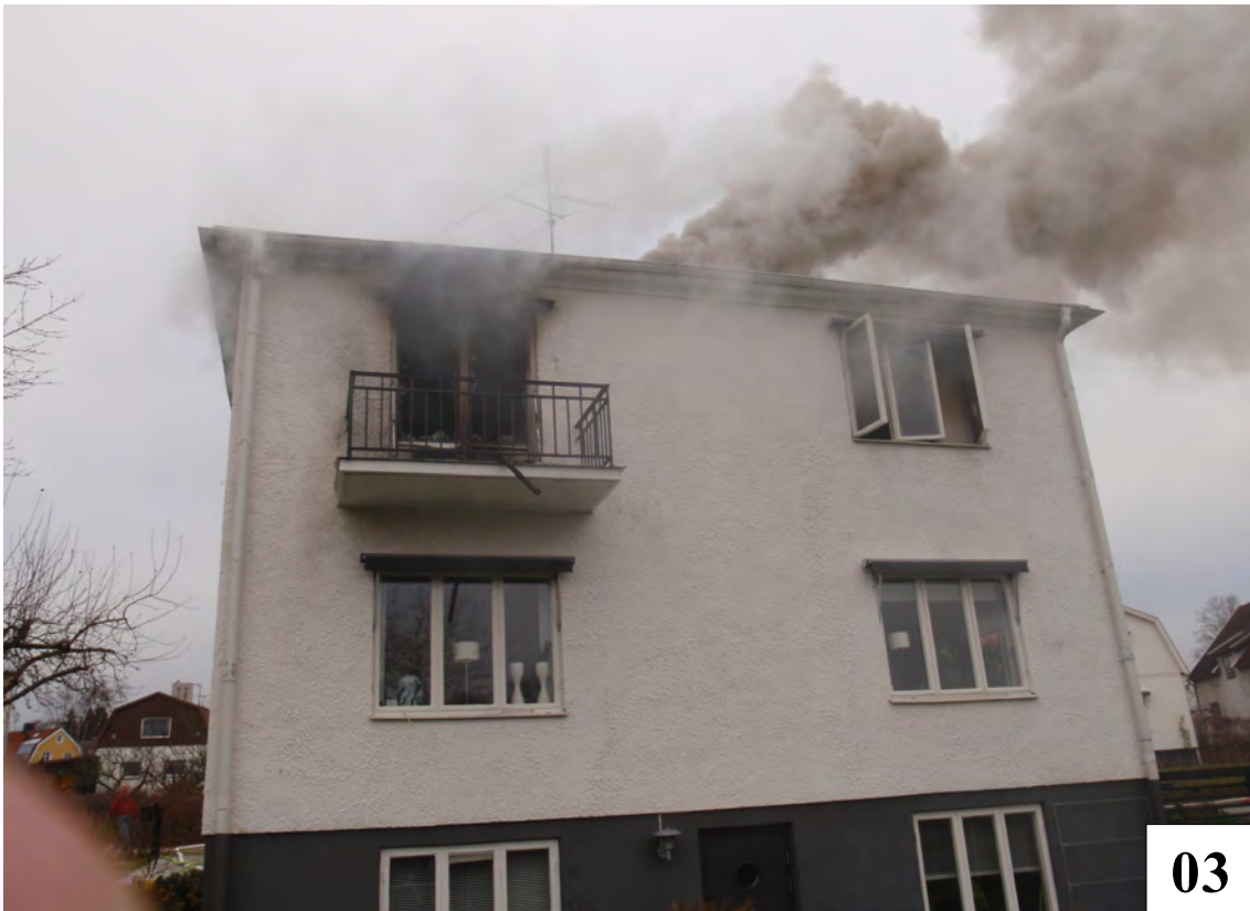
Södra gavel. Sängkammaren är där balkongen sitter. Sängkammaren är släckt.