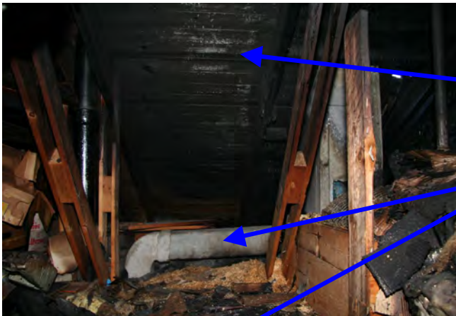
Brandskador på undertak på vind