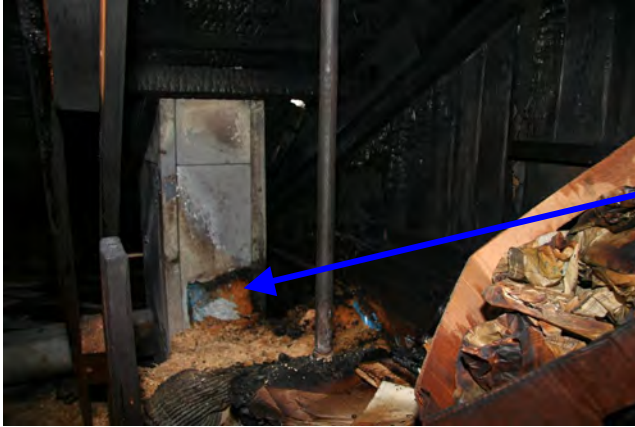
Brandskadat schakt på vinden.

Anledning till undersökningen: Brand i byggnad