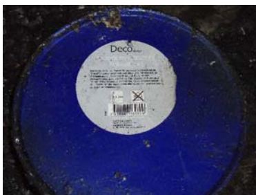
Varningstexten på marschallen.

Postadress Ängelholms Räddningstjänst Östra vägen 11 262 51 ÄNGELHOLM