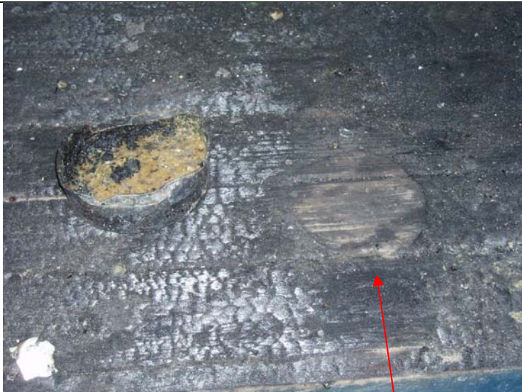
Marschallens placering kan ses till vänster.