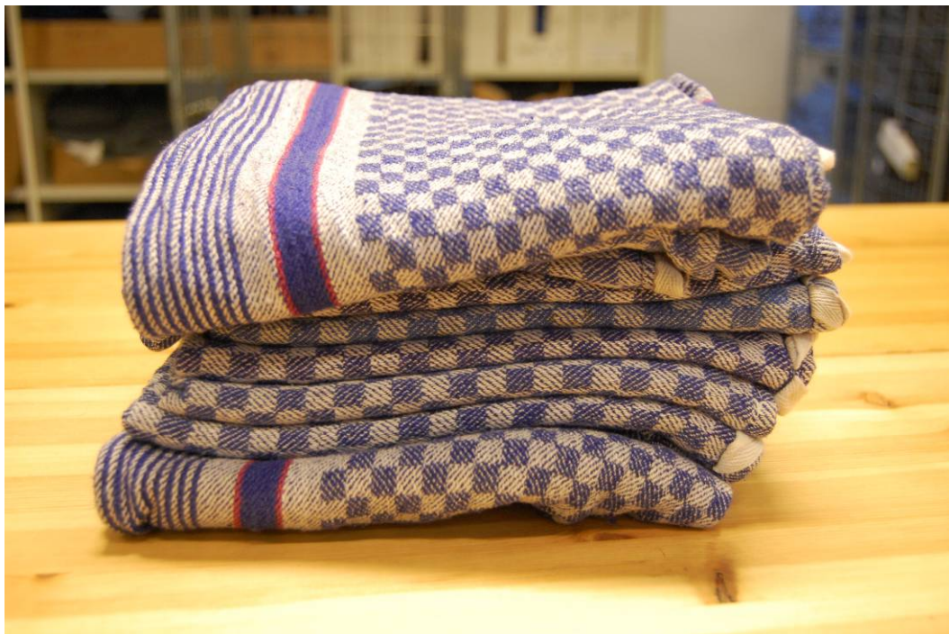
i högar med 10 st. i varje.