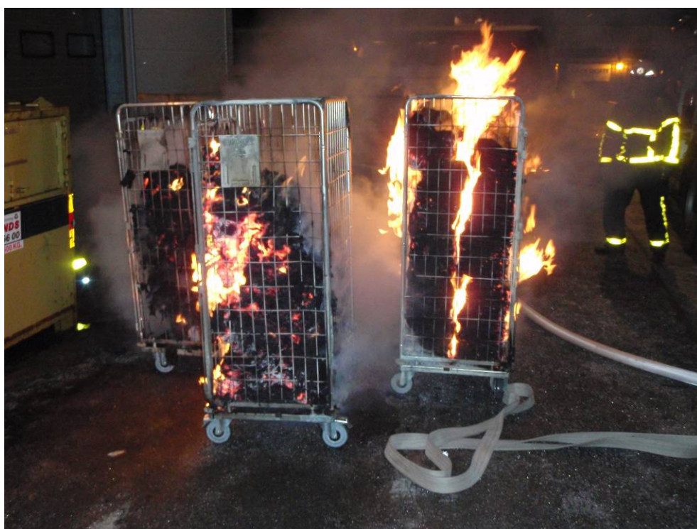
Här förs vagnarna utomhus där handdukarna sedan släcktes.