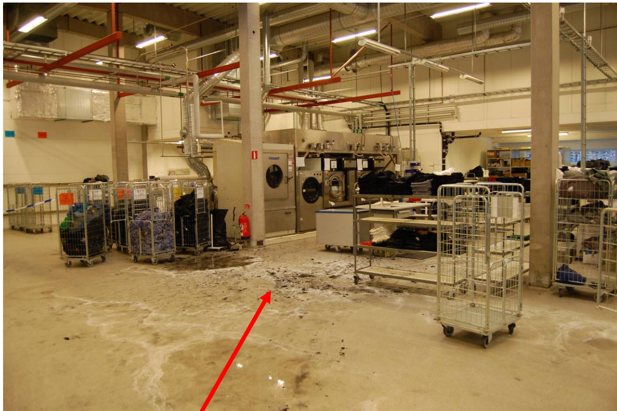
Här stod vagnarna med de brinnande handdukarna.