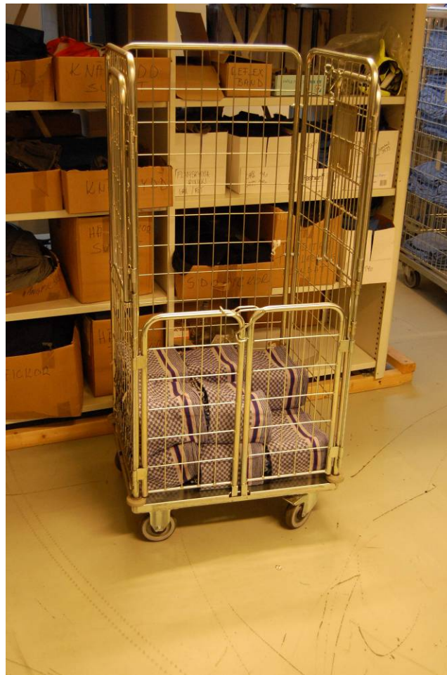
Så här packades handdukarna...