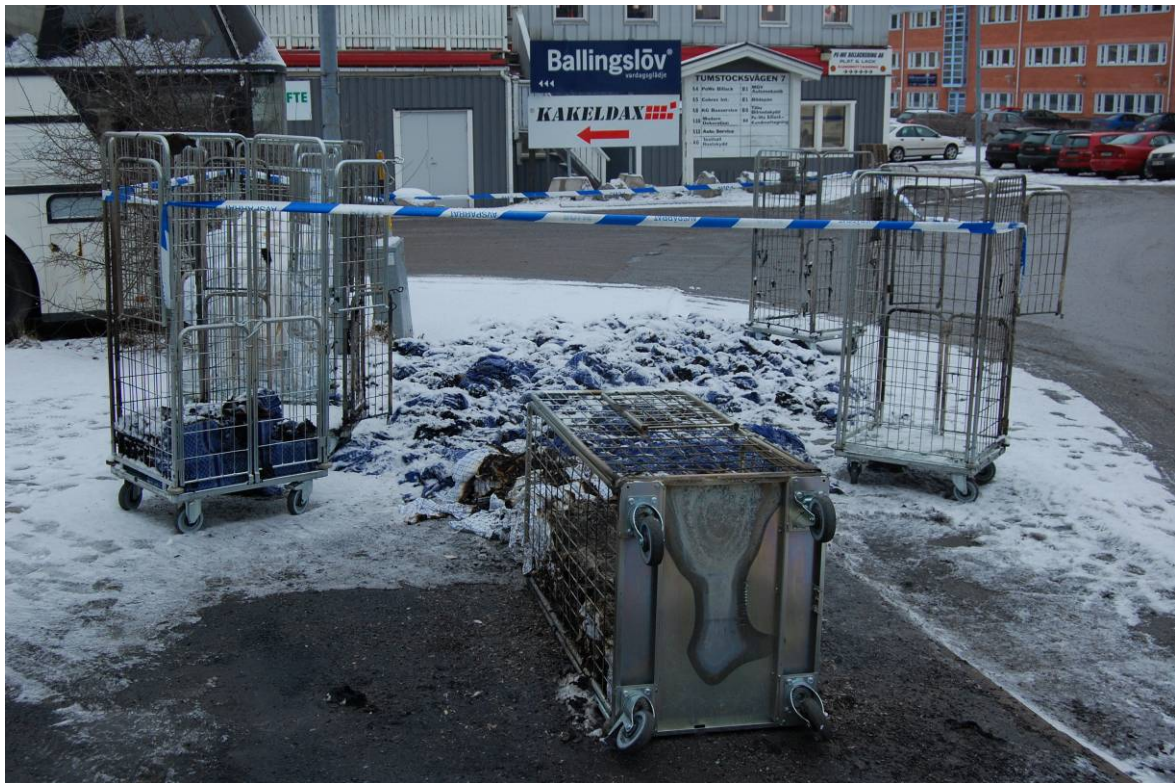
Vagnarna efter branden.