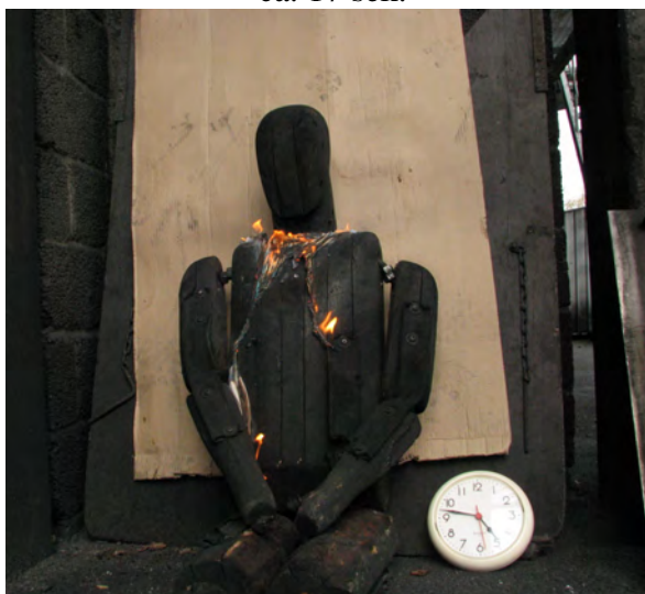
ca. 30 sek