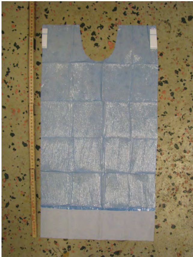
Bild 6. Engångshaklapp av plast, storlek 65 x 35 cm