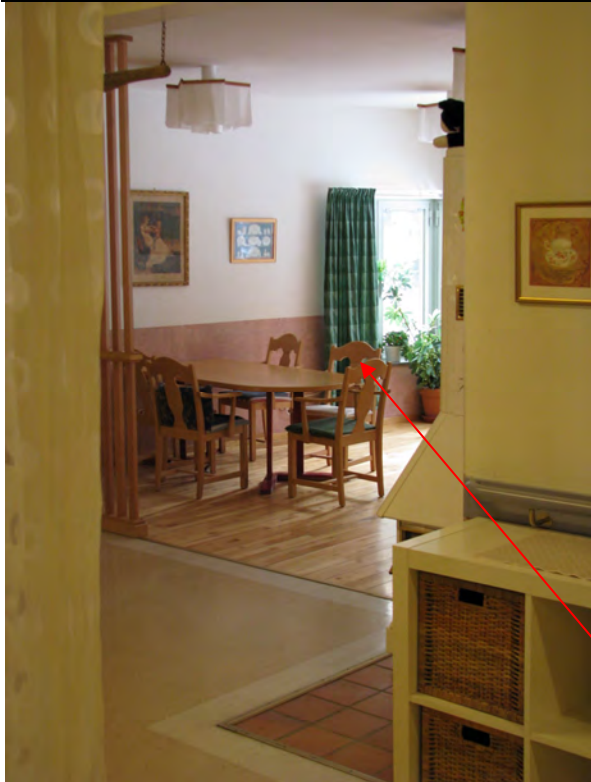
Bild 1. Matsalen fotograferad från avdelningens kök. Rullstolens placering.