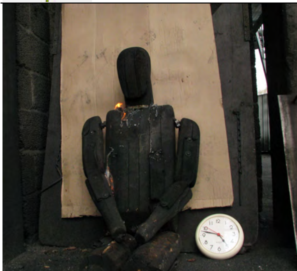
ca. 50 sek