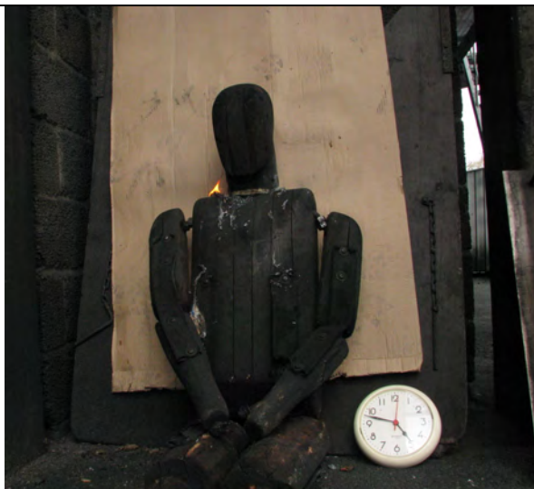
ca. 60 sek