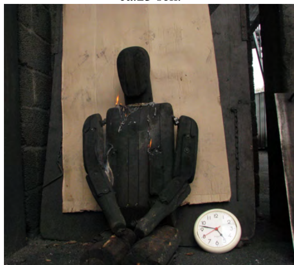
ca. 40 sek