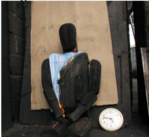
ca. 17 sek.