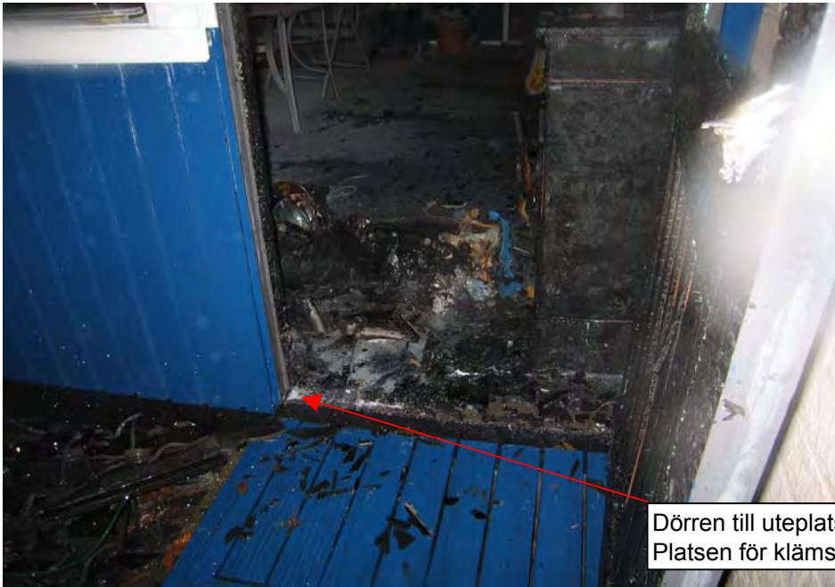
Dörren till uteplatsen. Platsen för klämskadan.